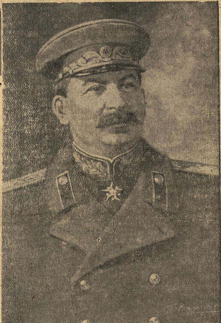
Верховный Главнокомандующий Маршал Советского Союза И. Сталин