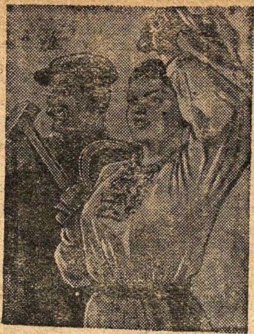
КРАСНОЙ АРМИИ ПОВЕДИТЕЛЬНИЦЕ— ЧЕСТЬ И СЛАВА!