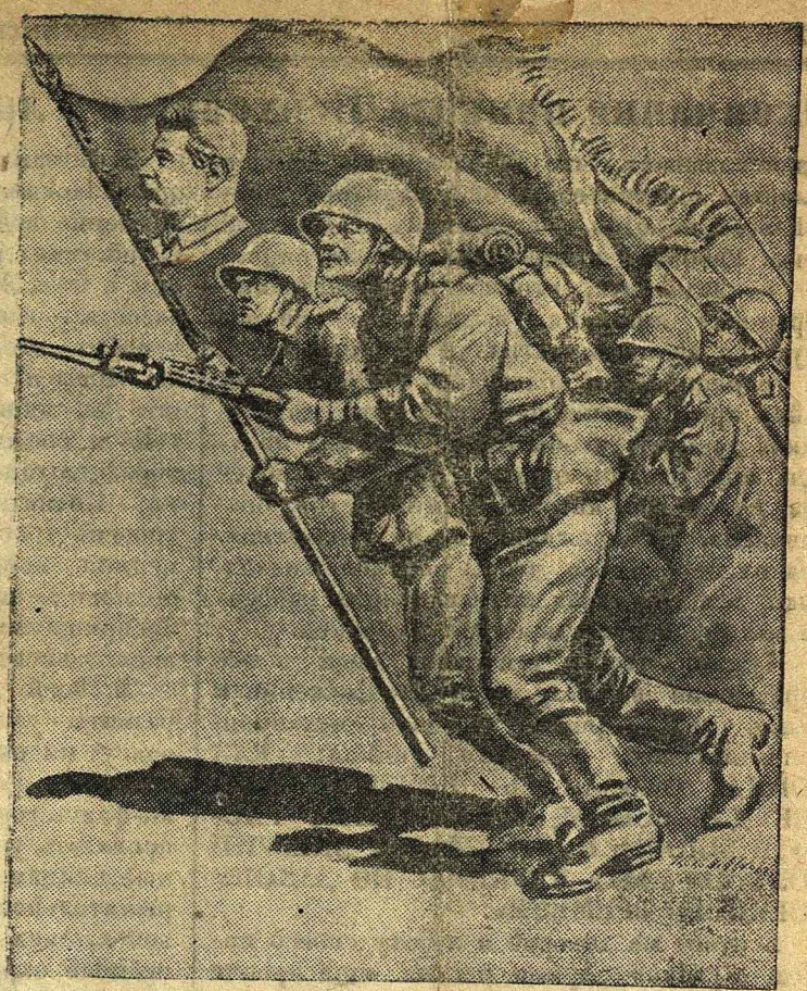
ВПЕРЕД, ЗА РАЗГРОМ НЕМЕЦКИХ ОККУПАНТОВ!

Рисунок лауреата Сталинской премии художника П. Соколов-Скаля.