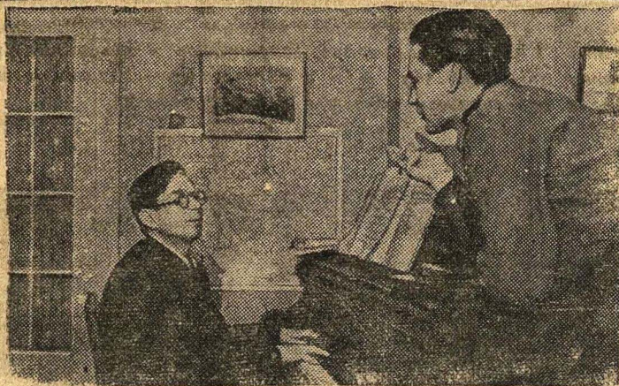
Лауреат Сталинской премии композитор В. П. Соловьев-Седой за годы войны написал около 60 песен. Почти все песни Соловьева-Седого написаны на слова поэта А. И. Фатьянова.

На снимке: В. П. Соловьев-Седой и поэт А. И. Фатьянов работают над созданием новой песни.