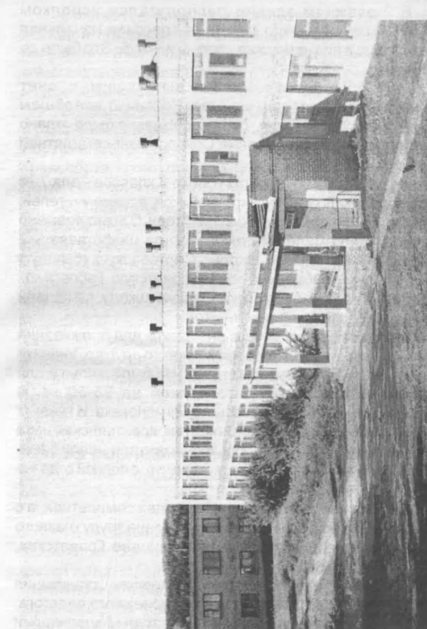
Соколовская средняя школа с интернатом. 1990 год.

Они же выполняли свою роль в годы Великой Отечественной войны как заготовительные пункты приемного семенного фонда от колхозов. Эти высокие, в два этажа здания с северо-восточной стороны села Сепыч стояли до 1965 года. Потом были снесены местными властями.