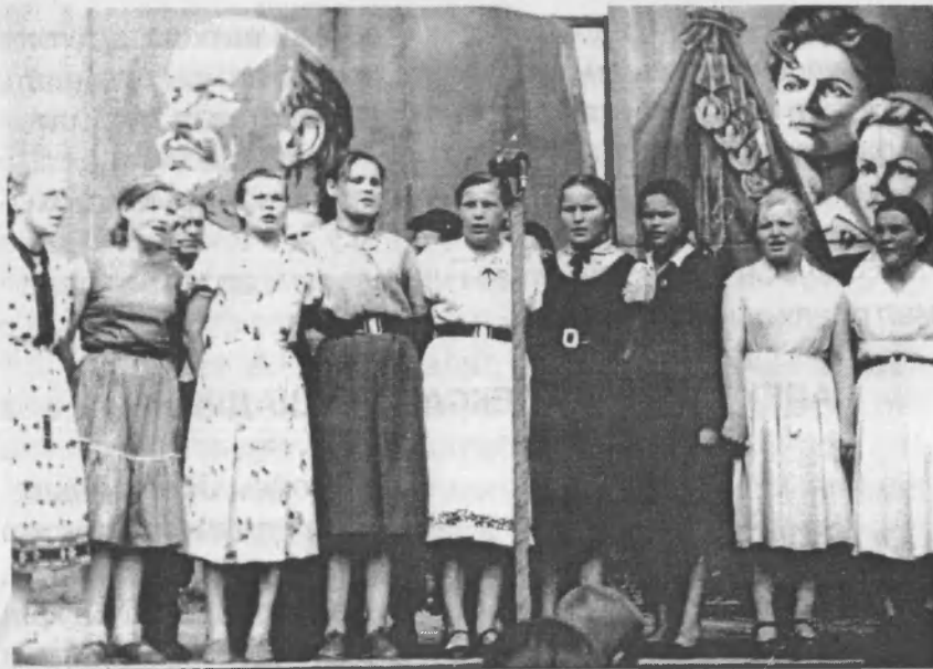
Участники художественной самодеятельности Соколовской избы-читальни (клуба) в Верещагинском железнодорожном парке. Празднование "Дня молодежи". 1959 г.