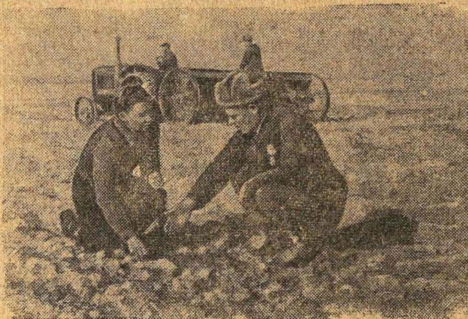
Сев пшеницы в колхозе «Коммуна», Апшхабадского района, Туркменской ССР.