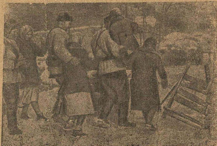
Партизаны вернулись в родное село С. после освобождения его от немцев. Радостно их встретили родные и близкие.

Помощь жителям освобожденных районов—благородное, патристическое дело.