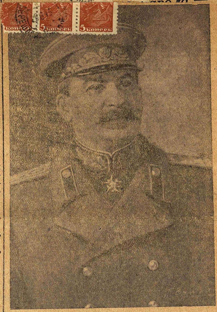
Верховный Главнокомандующий Маршал Советского Союза И. В. СТАЛИН

Четверг 28 июня 1945 года № 32 (1927) XV год издания Цена 15 коп.