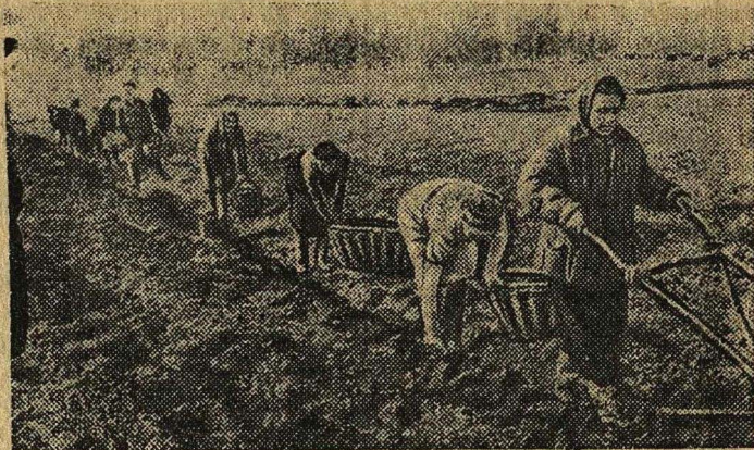
Посадка картофеля в колхозе «Власть Советов» (Борский район, Горьковская область).

Всего по району . . . 64,6 Верещагинская МТС . . . 70,2 Путинская МТС . . . 65,2 Сепычевская МТС . . . 56