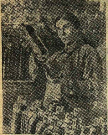
В термосном цехе стеклозавода имени Профинтерна (Ашхабад), производящем термоса для Красной Армии.