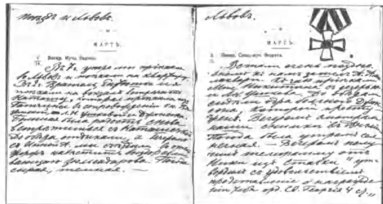
Страница из дневника великого князя за 1915 год, с его рисунком «Георгия», полученного им

Мы предлагаем вашему вниманию фрагменты из дневника последнего года жизни Михаила Александровича — точнее,