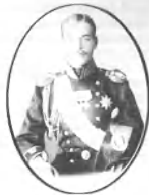
Великий князь Михаил Александрович Романов