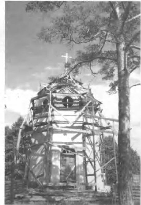
Часовня в честь Михаила Тверского

Здание часовни представляет собой правильный шестиуголь-