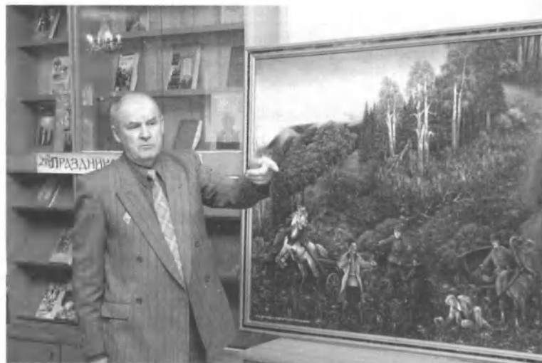
Художник Н. П. Тюрин представляет картину «Убийство великого князя Михаила Романова»

Картина «Убийство великого князя Михаила Романова» (2006) также относится к числу работ достаточно интерес-