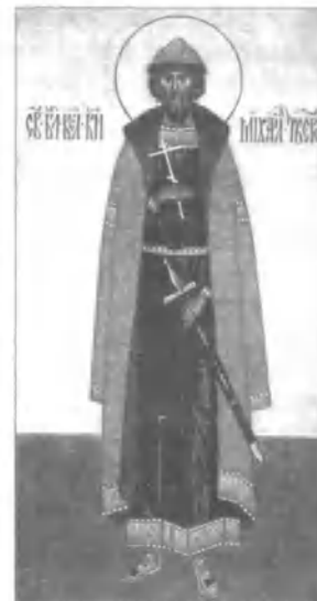
Икона святого Михаила Тверского

Святой благоверный князь Михаил Тверской родился в 1272 году уже после смерти своего отца, великого князя Ярослава Ярославича, родного брата святого благоверного князя Александра Невского. При поездке в Орду князь Ярослав Ярославич заболел и, приняв постриг с именем Афанасий, скончался. Мать Михаила, Ксения, а затем новгородский архиепископ (вероятно, Климент) воспитали в молодом князе горячую любовь к Богу. На Тверском княжении Михаил сменил старшего брата, Святослава. В 1285 г. он построил каменный храм в честь Спаса Преображения на месте деревянной церкви Космы и Дамиана. По смерти великого князя Андрея Александровича (в 1305 г.) Михаил, по праву старшего, получил в Орде ярлык на великокняжеский престол. Но московский князь Юрий Данилович, сам домогаясь великокняжеской власти, не подчинился Михаилу. Новый хан Золотой Орды Узбек, принявший магометанство, отличался жестокостью и фанатизмом. Юрий, часто бывая в Орде, сумел понравиться хану, даже взял в жены его сестру Кончаку и стал великим князем. А чтобы устранить законного претендента на великокняжеский ярлык, начал муждоусобную войну с Тверью. Хан Узбек посылает в помощь Юрию татарские отряды во главе с Кавгадыем. Однако тверичи, возглавляемые князем Михаилом, 22 декабря 1317 года наголову разбили войско Юрия. Было захвачено много пленных, в том числе Кав-