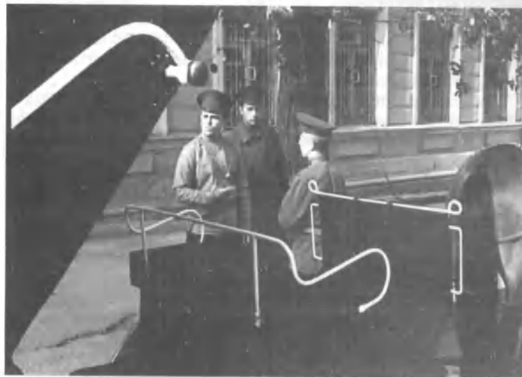
Кадр из фильма «Два Михаила — начало и конец династии»