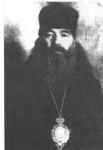
Владыка Серафим на Соловках в 1930-е годы