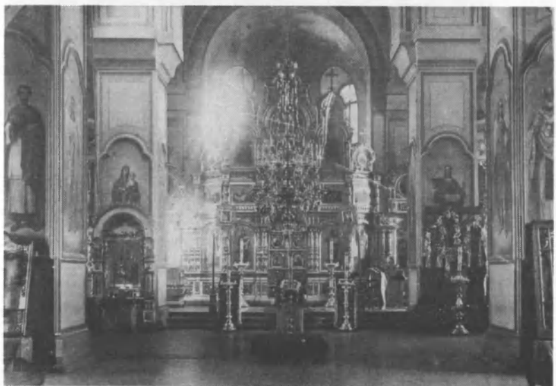
Иконостас Иоанно-Предтеченского храма в с. Култаево Пермского края. Архивный снимок, 1910-е годы