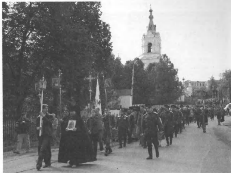
Крестный ход от Пермского Свято-Троицкого Стефанова мужского монастыря к предполагаемому месту расстрела. 12 июня 2007 года