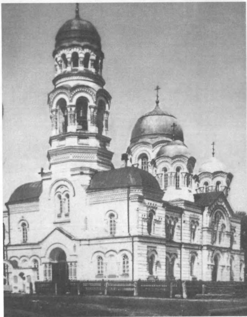
Церковь Иоанна Предтечи в с. Култаево Пермского края. Архивный снимок 1910-е годы