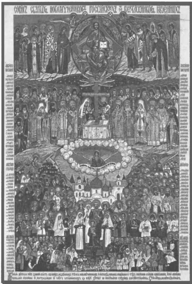
Икона Русской Православной Церкви за рубежом «Собор Святых Новомучеников Российских, от безбожников избивенных»