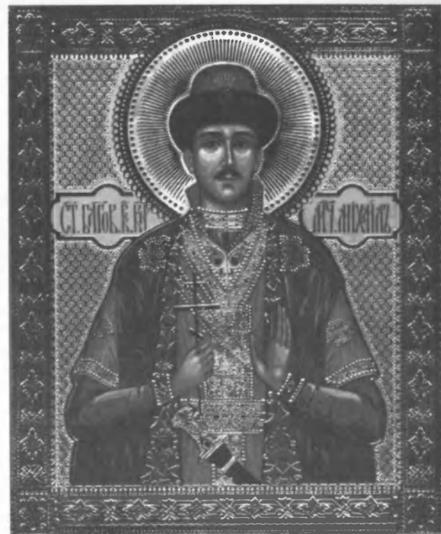
Икона Русской Православной Церкви за рубежом «Святой Благоверный Великомученик Михаил»