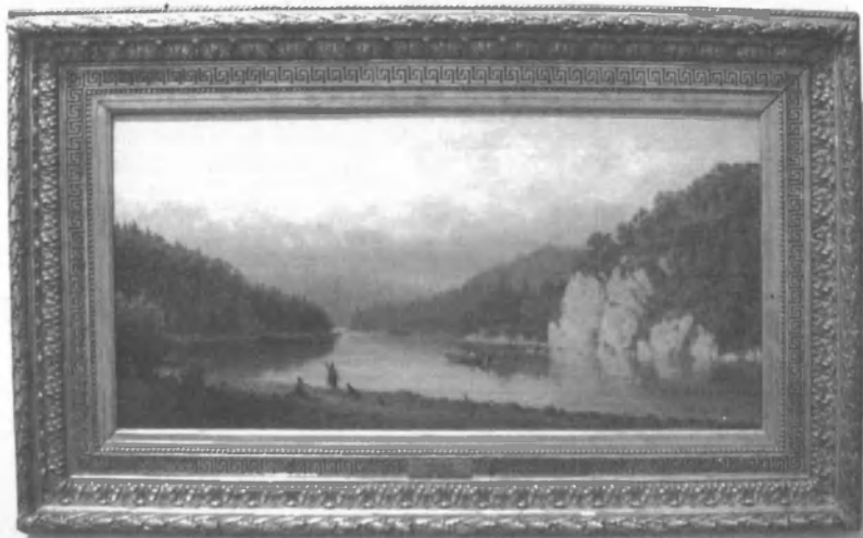
Верещагин П.П. Старая Москва. 1883. ЕМИИ. Холст, масло. 35,5x71