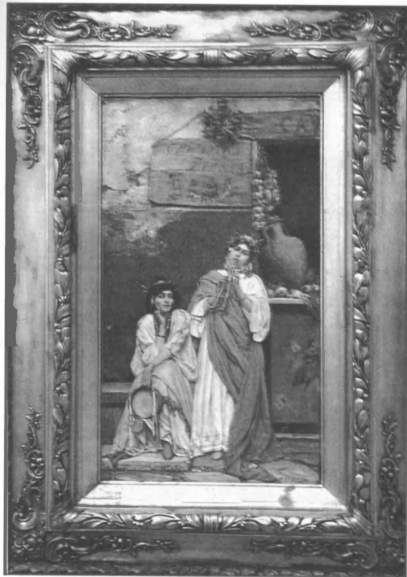
Сведомский П.А. Две римлянки с бубном и флейтой. ПГХГ. Холст, масло. 84,5x45