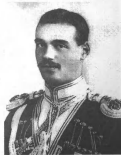
Великий князь Михаил Александрович Романов. Фото начала XX века