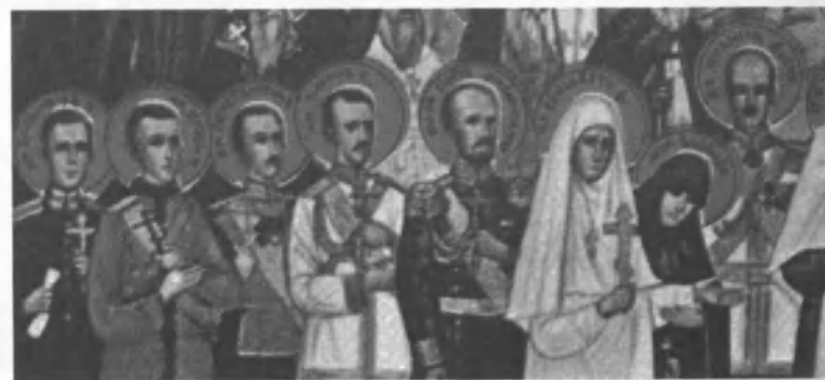
Фрагмент изображения иконы «Собор Святых Новомучеников Российских, от безбожников избивенных». Справа рядом с инокиней Варварой великий князь Михаила Александрович