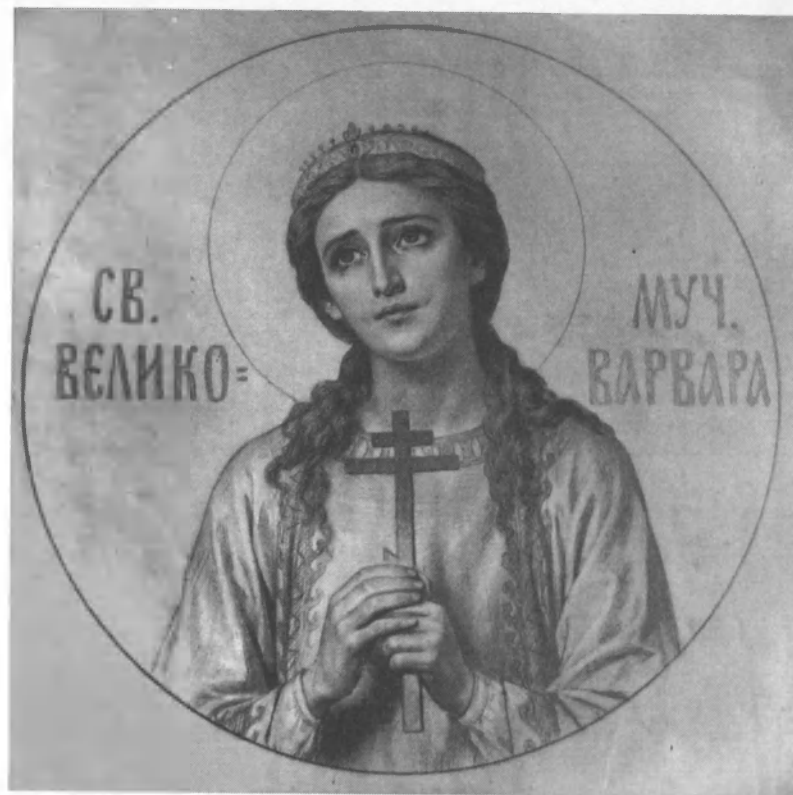
Верещагин В. П. Святая великомученица Варвара. ПГХГ

Жизнь в «Собрании» кипела. Действовали библиотека, читальня, «трезвый» буфет, бильярд. А совет старшин намечал ещё чтения и лекции по научным предметам и устройство игр для детей членов «Собрания». В материальном плане складывалось тоже всё хорошо. Имея имущества (на 1.01.1903 г.) на 1419 руб. и кассовых остатков 267 рублей, за 1903 год в «Собрание мастеровых» поступили: членские взносы – 515 руб., чистая прибыль от спектаклей и литературно-музыкальных вечеров – 910 руб., включая доход от вешалок и буфета, страховая премия – 350 руб., субсидия от управления РУЖД – 500 руб. и другие поступления – 60 руб. Получили доход на 1 января 1904 года в сумме 2365 руб. Расход на наём помещения, отопление, освещение, на конторщика и сторожа и пр. составил 1629 руб. 7 Разница в 796 рублей! «Собрание мастеровых»