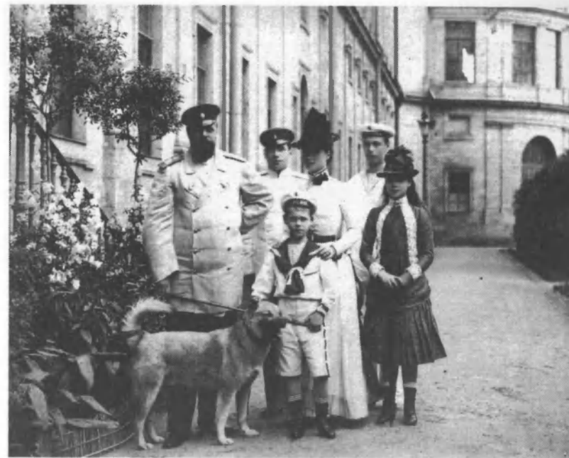
Семья Александра III в собственном саду Гатчинского дворца. 1880-е годы. Впереди стоит маленький Михаил

10 Солженицын А.И. Размышления о Февральской революции // Российская газета. – 2007. – 27 февраля. – С.16.