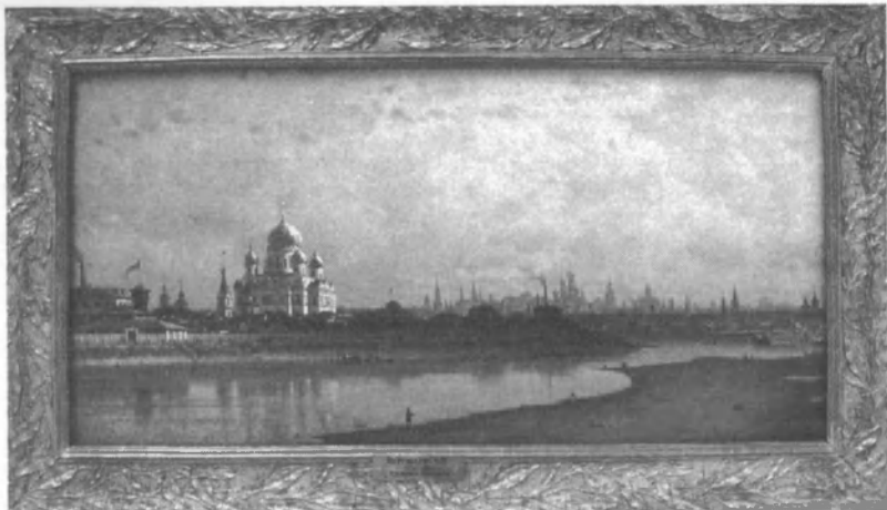
Верещагин П.П. Река Чусовая. Камень «Красный». ПГХГ. Холст, масло. 28x33,5