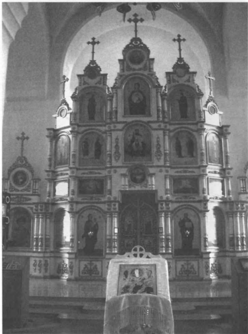
Современный иконостас Иоанно-Предтеченского храма в с. Култаево Пермского края

« доказало свою состоятельность. За 1903 год было поставлено 64 спектакля, 8 литературно-музыкальных вечеров и одна новогодняя ёлка для детей членов «Собрания». Кроме того, были даны два спектакля гастролёрами из Малороссии: «Гайдамаки» и «Весели полтавцы» и приглашённый фокусник Де-Фоти дал два сеанса.