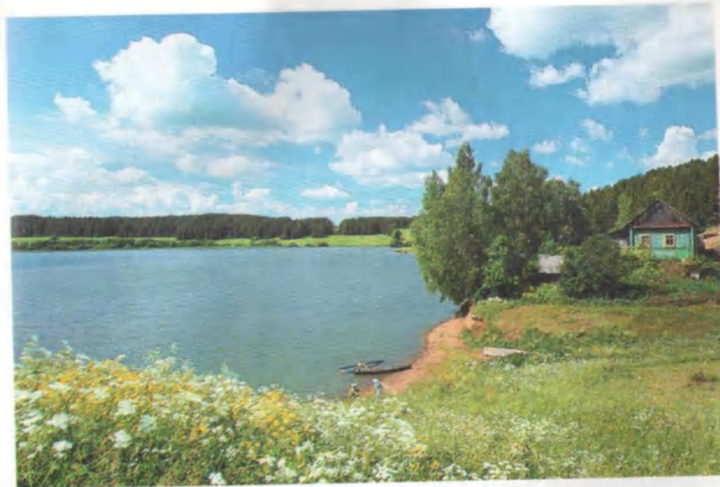
Живописный вид на пруд села Буб.