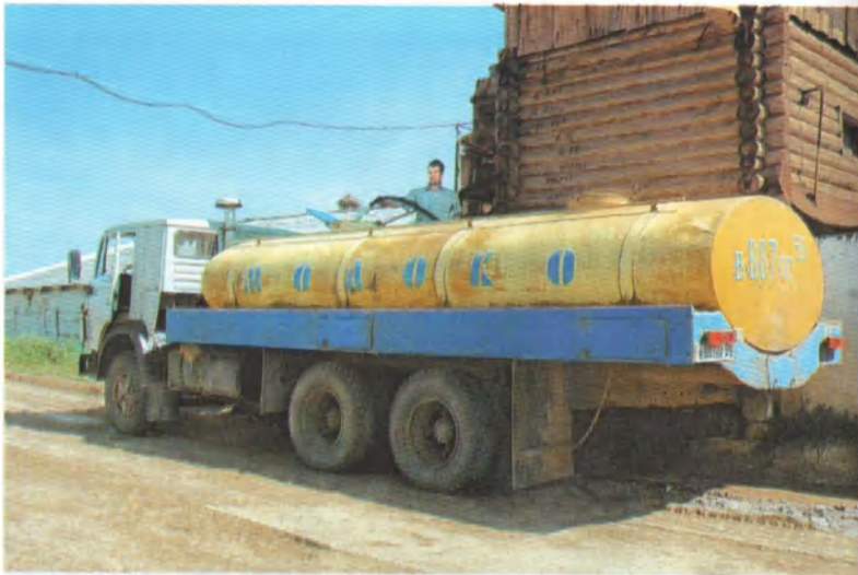
Вывоз молочной продукции современной техникой приносит колхозу ощутимые доходы.