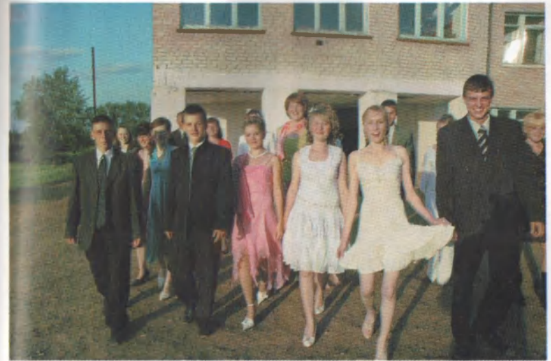
Шагает будущая смена колхоза.