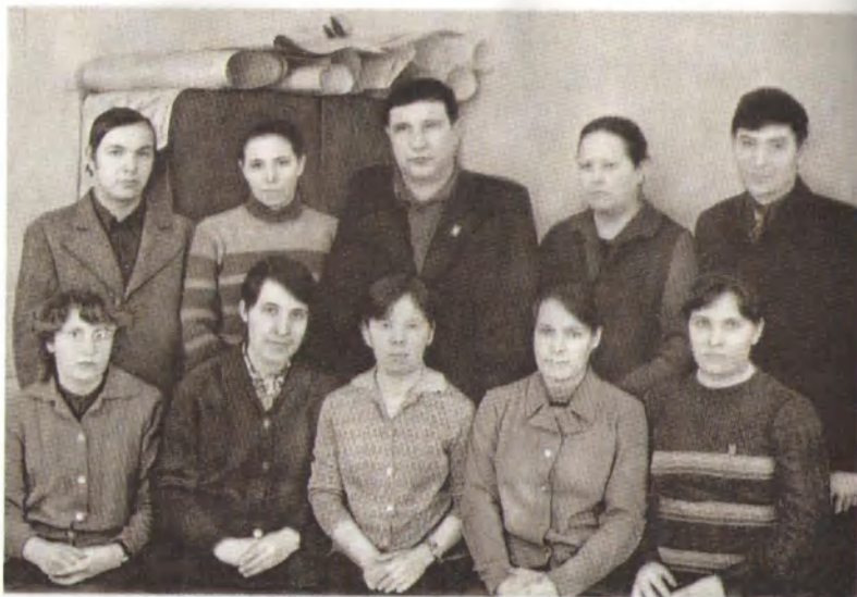
Ведущие специалисты колхоза разных лет.