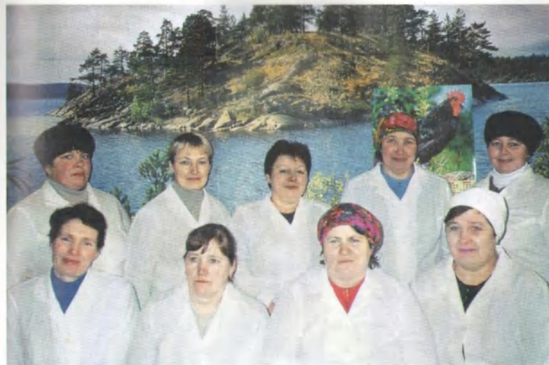
Коллектив доярок Бубинской МТФ.