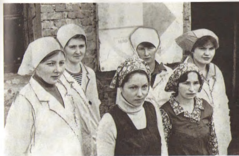
Комсомольско-молодёжное звено Бубинской МТФ.