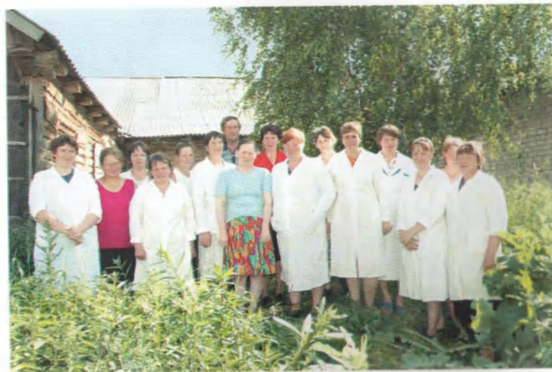
Коллектив доярок Якимовской МТФ.