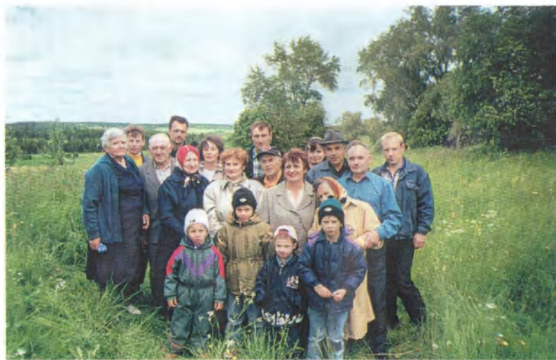
Борейковская родня собралась на месте отчего дома...