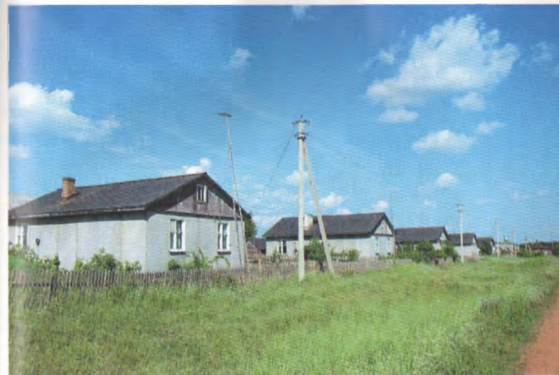
Дома колхозников деревни Якимово.