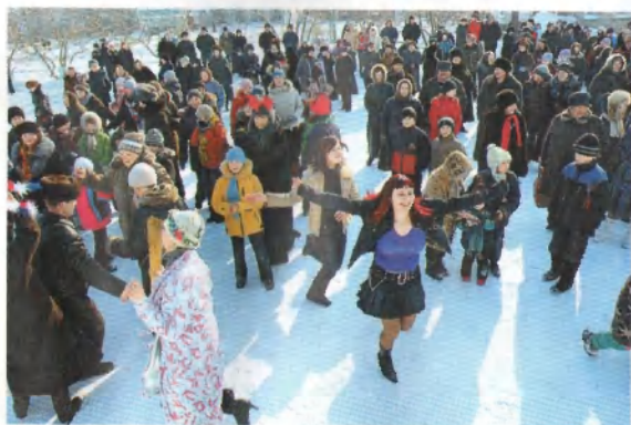
Продолжение Масленицы. Народные гуляния.