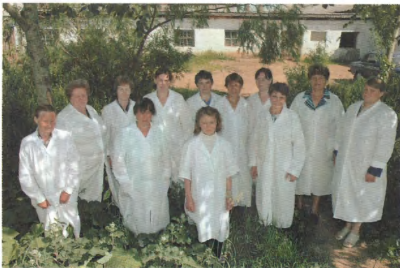
Коллектив доярок Мерзлянской МТФ.