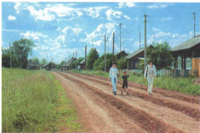
На улице деревни Бровилята.