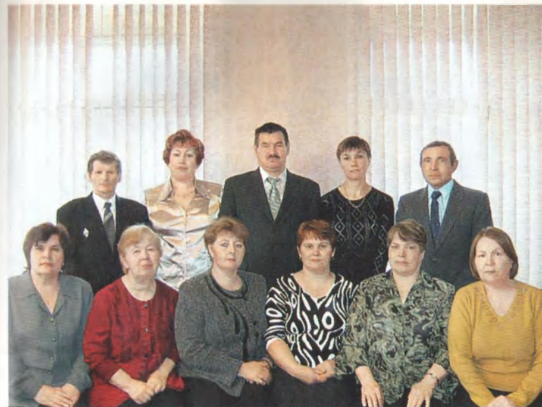
Главные специалисты колхоза им. Ленина — его штаб и мозг.