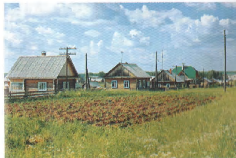
Новая улица села Буб.