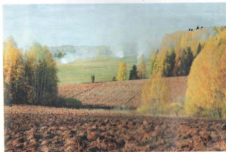
Золотая осень на Бубинской земле.