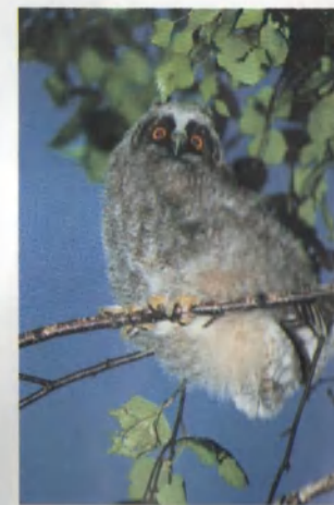
На охотничьих просторах колхоза.