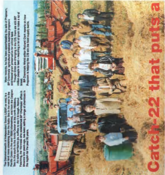
Представители фирмы Бритиш Петролиум Кэмиклз — производители промывочной кислоты для консервирования зерна — пришли в колхоз им. Ленина, чтобы помочь в освоении технологии. Разворот из английского журнала, 1991 год.