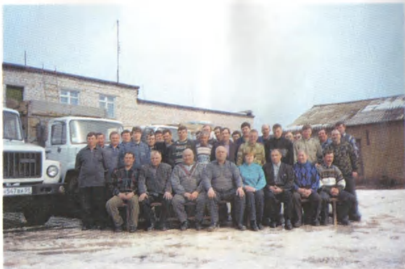
Коллектив колхозного автогаража.