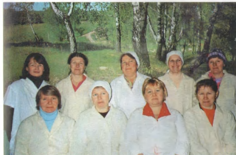
Коллектив доярок Кичаповской МТФ.