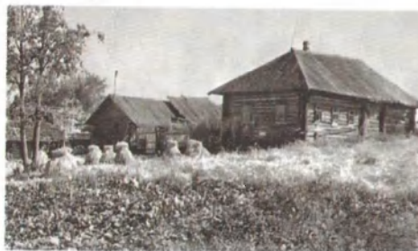
Родительский дом — начало начал...