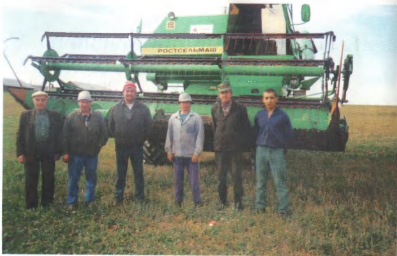
Остановка для снимка на память.