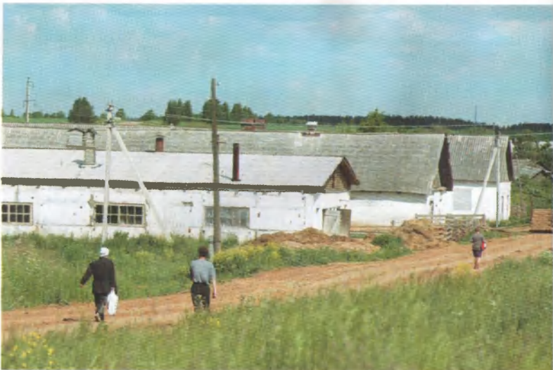
Корпуса Мерзлянской молочнотоварной фермы.