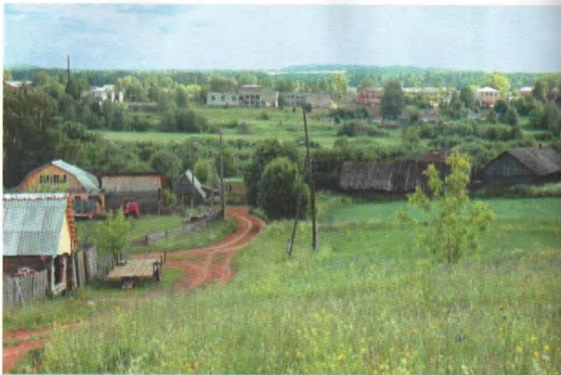
Общий вид села Буб — центральной усадьбы колхоза.