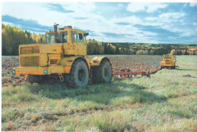
Идёт вспашка зяби.