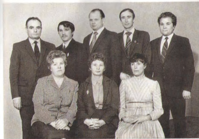
Хозяйственно-партийный актив колхоза им. Ленина.