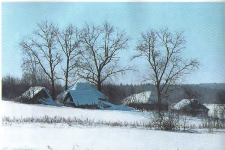
В деревне Борейково зима...