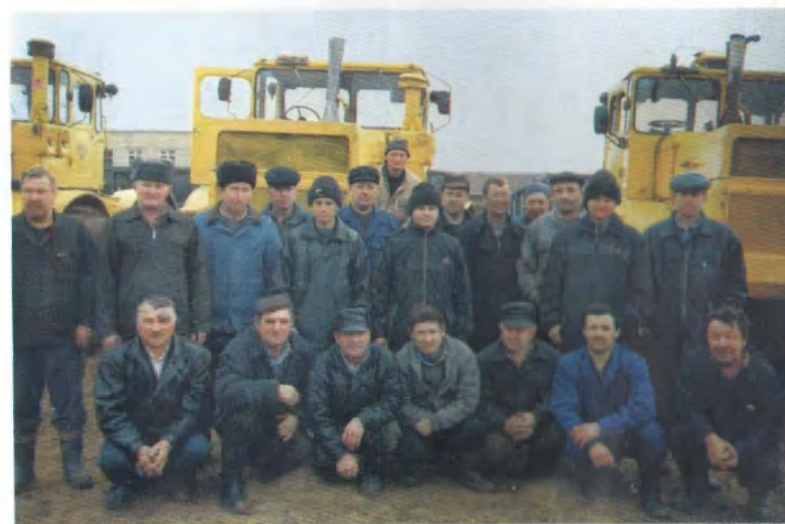
Коллектив механизированного отряда колхоза.