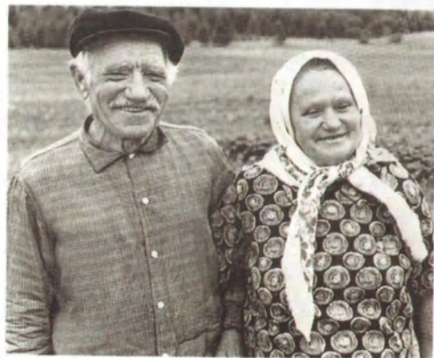
Они же — в день «золотой» свадьбы, 1969 год.