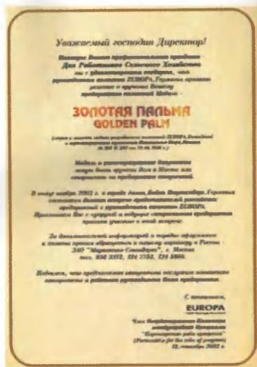
Присуждение колхозу им. Ленина памятной медали «Золотая пальма» германской компанией EUROPA и приглашение руководителю хозяйства с супругой на церемонию вручения, 2002 год.