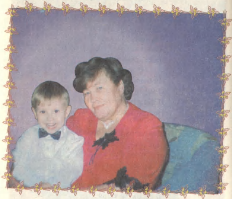
Бабушка с внуком – жизнь продолжается.