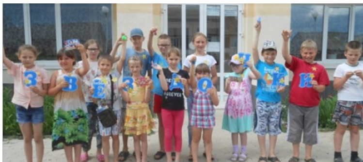
Отряд "Звездочка" при Вознесенской библиотеке

В июле при 4-х библиотеках работали отряды дневного пребывания детей : при Вознесенской, Кривчановской, Субботниковской библиотеках и библиотеке Кукетского разъезда. Каждый день ребят ждали интересные мероприятия, игровые программы, часы творчества, физкультминутки и полезный труд. Был организован активный полноценный отдых 40 детей, в том числе 3 детей группы СОП.