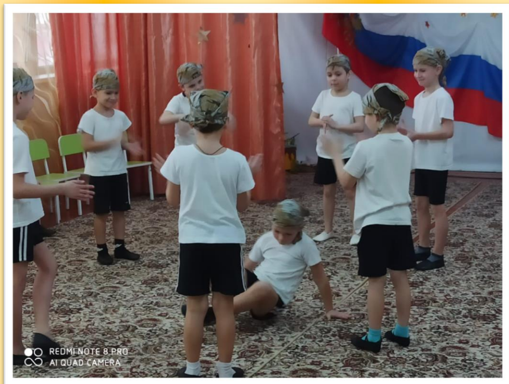
Эстафеты и подвижные игры