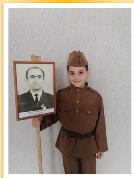
Парад «День Победы» и «Бессмертный полк»