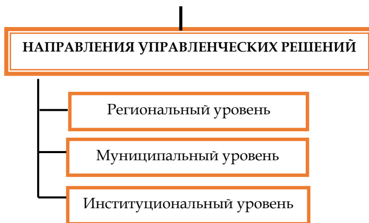
Рисунок 2. Структура региональной модели оценки качества общего образования

Обобщенная характеристика региональной модели оценки качества общего образования представлена в приложении 1.