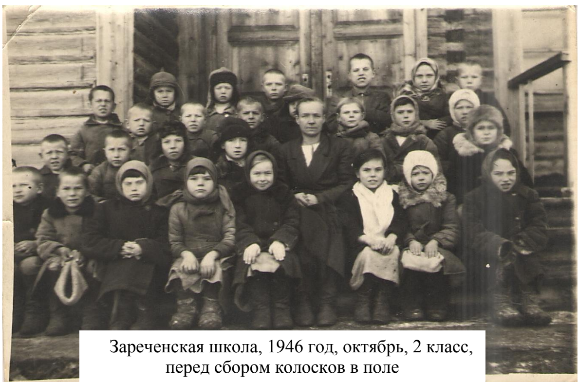
Зареченская школа, 1946 год, октябрь, 2 класс, перед сбором колосков в поле