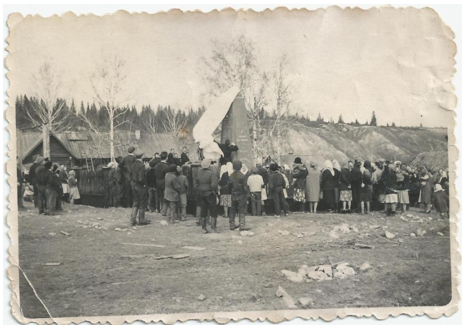
Открытие первого памятника погибшим землякам в д. Павлово, 9 мая 1965 года