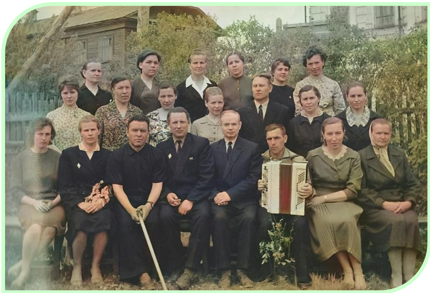
Учителя Ординской школы. 1966 г.