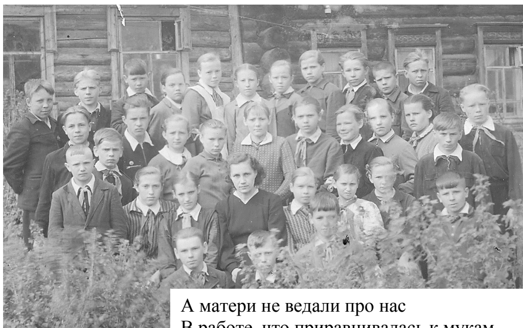
Фото: 6 класс, 1961 год

Именно о таких учителях написано у меня когда-то стихотворение.