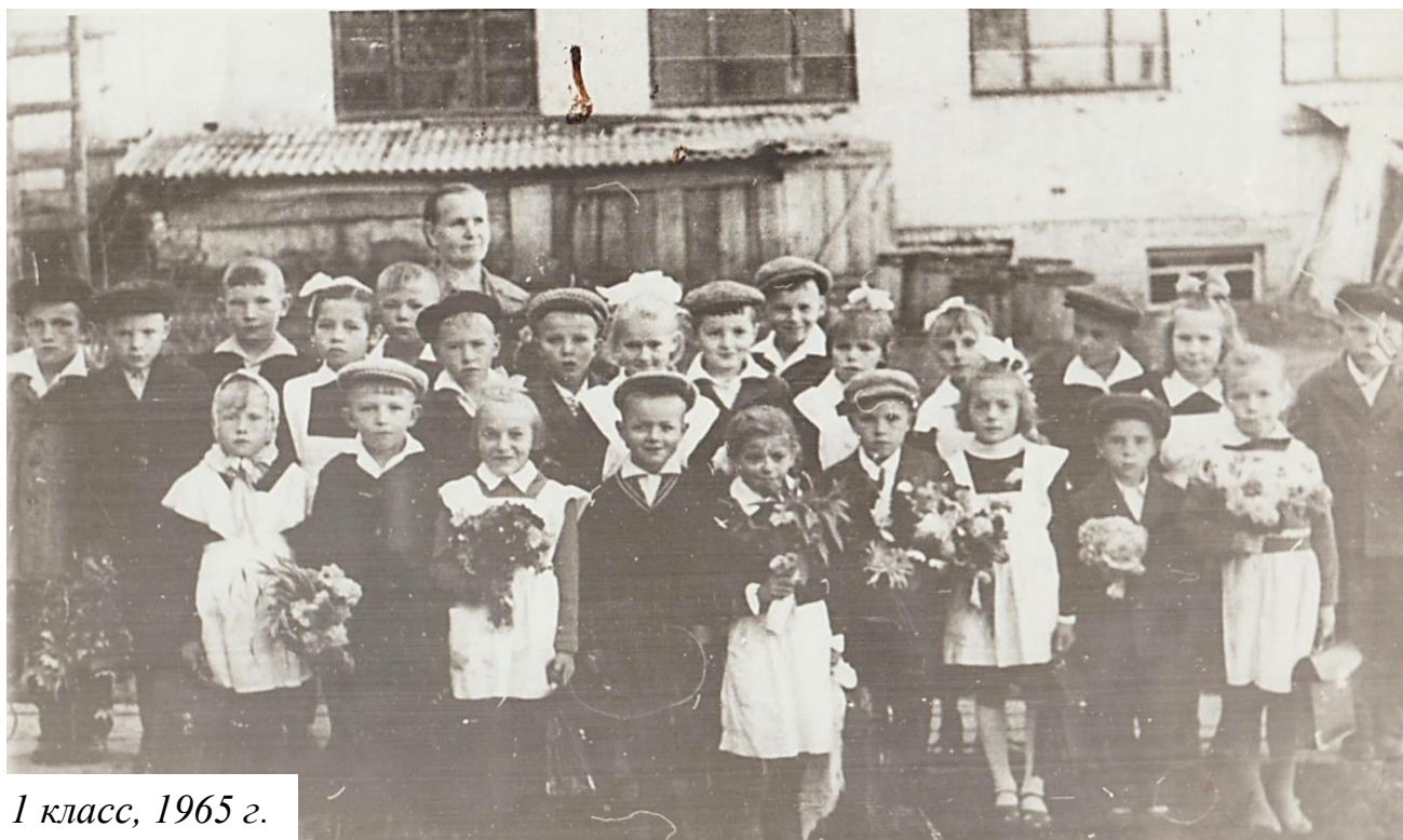
1 класс, 1965 г.