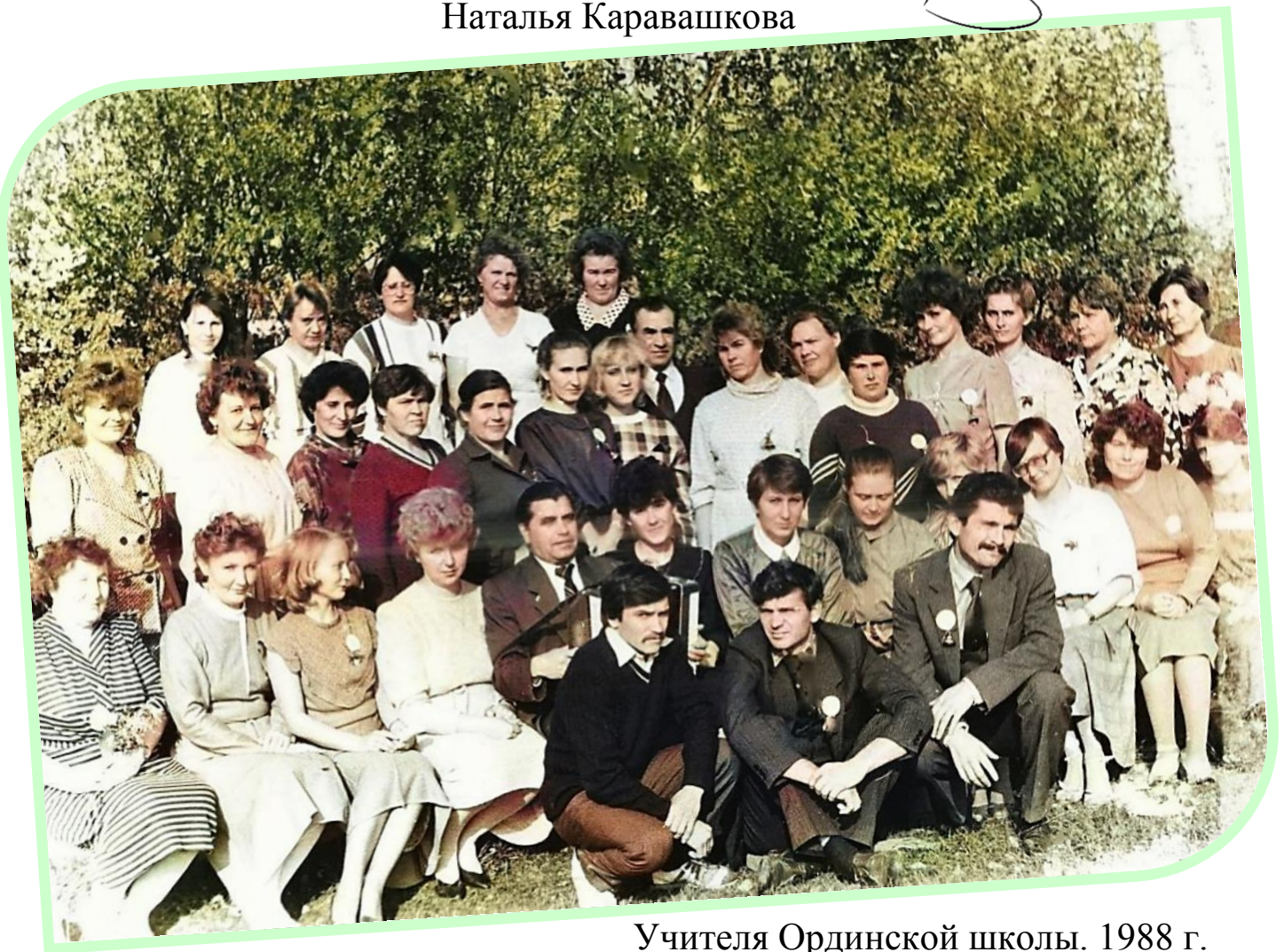
Учителя Ординской школы. 1988 г.