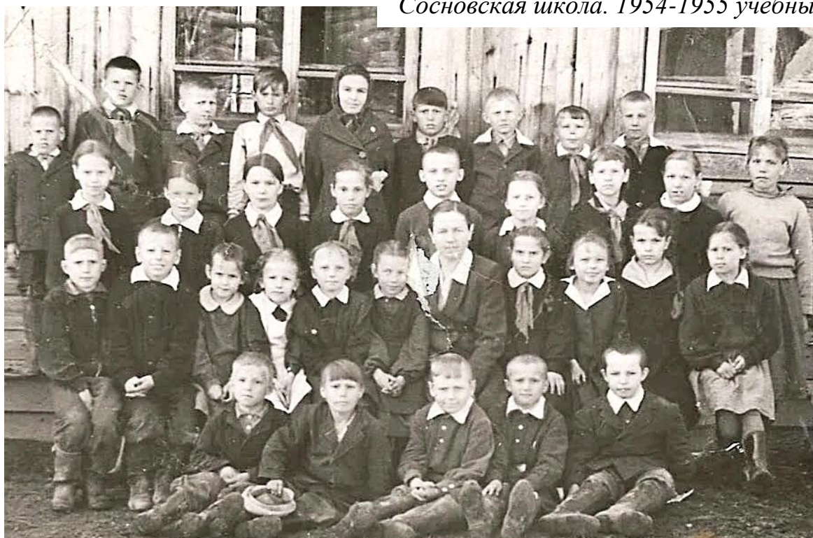
Сосновская школа. 1954-1955 учебный год