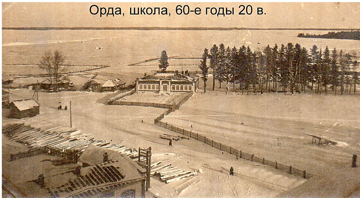
Орда, школа, 60-е годы 20 в.