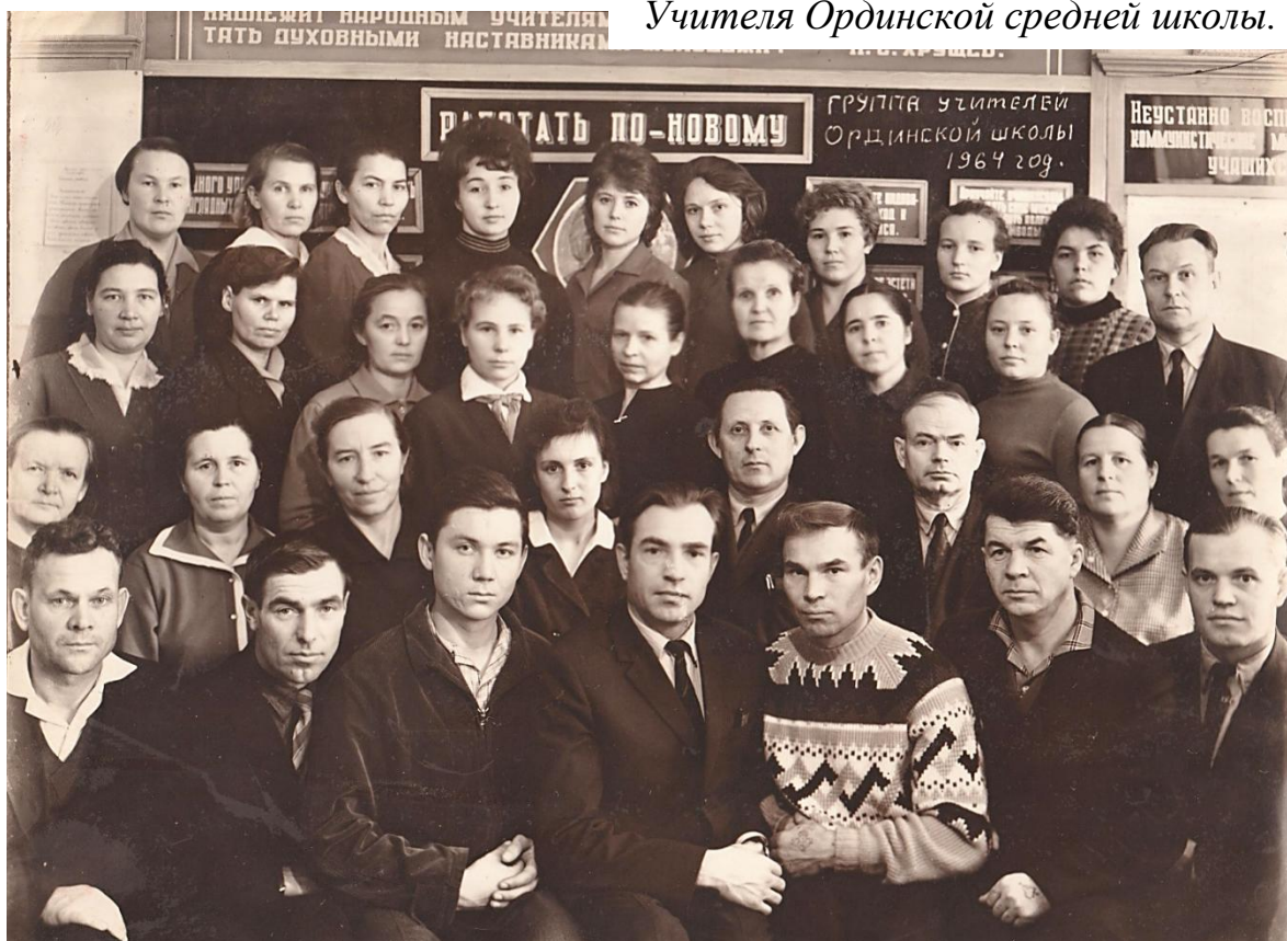
Учителя Ординской средней школы. 1964 г.

От знаний учителя, любви к своей профессии и детям зависит будущее нашей страны. Следовательно, труд учителя всегда был и будет в почёте для всех нас.