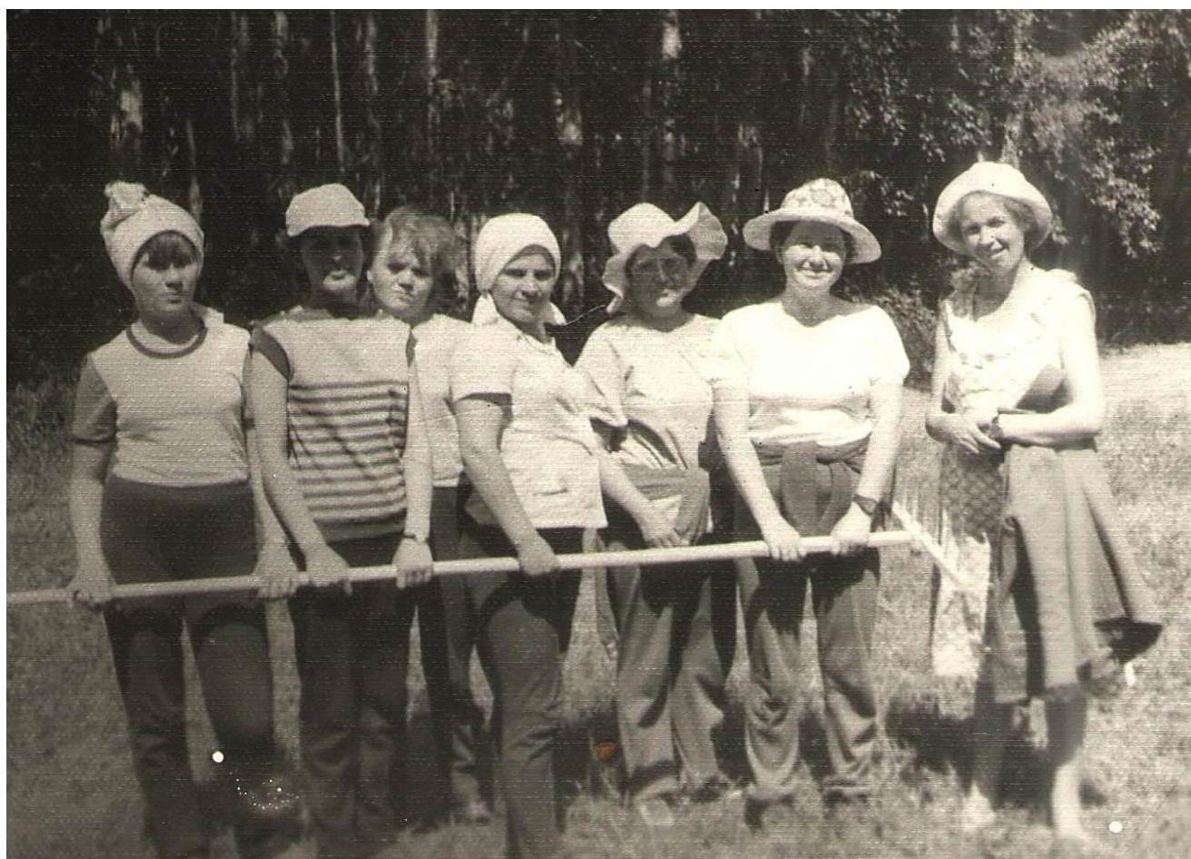
Коллектив библиотеки на сенокосе. 1987 г.