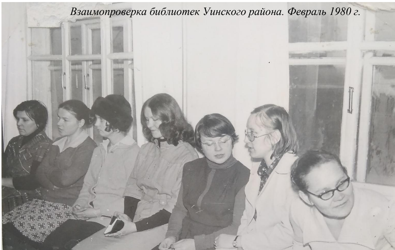
Взаимопроверка библиотек Уинского района. Февраль 1980 г.