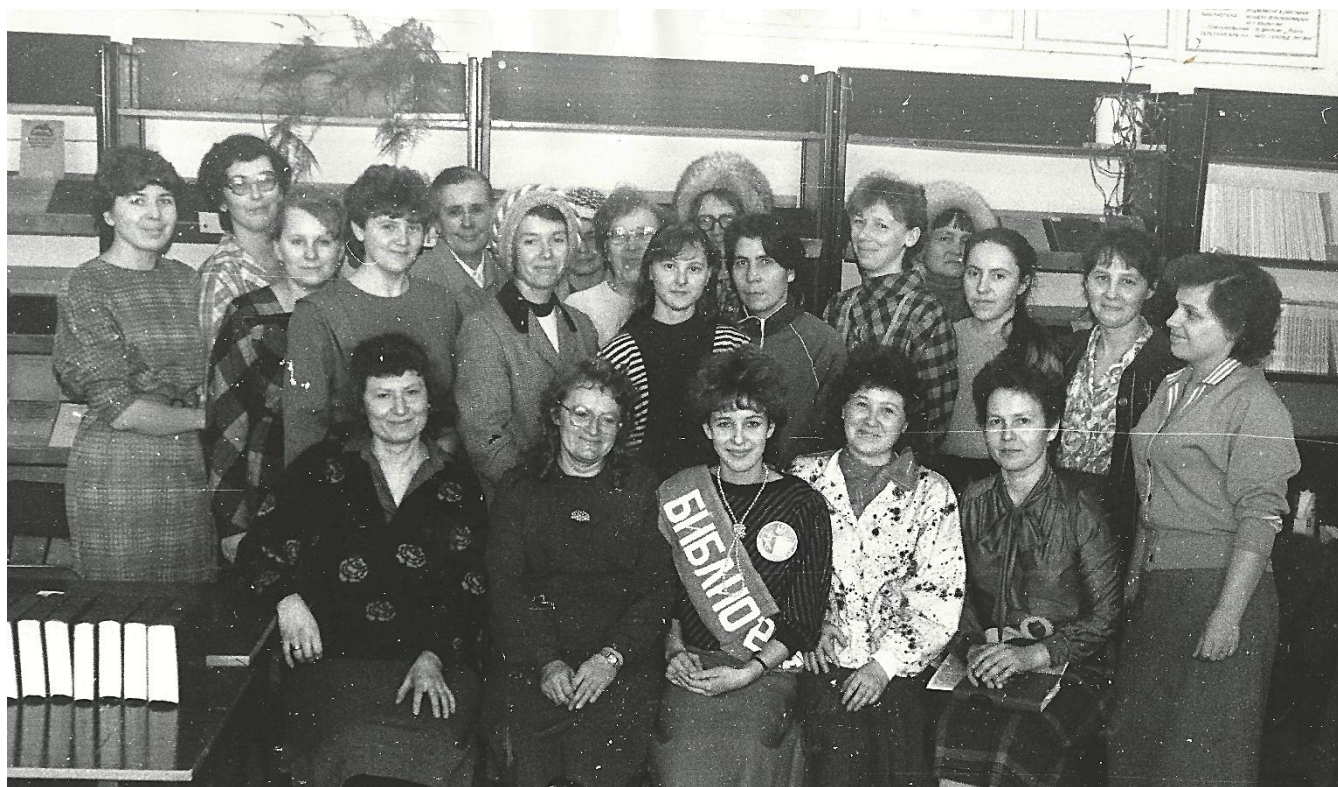
1989 г. Конкурс профмастерства