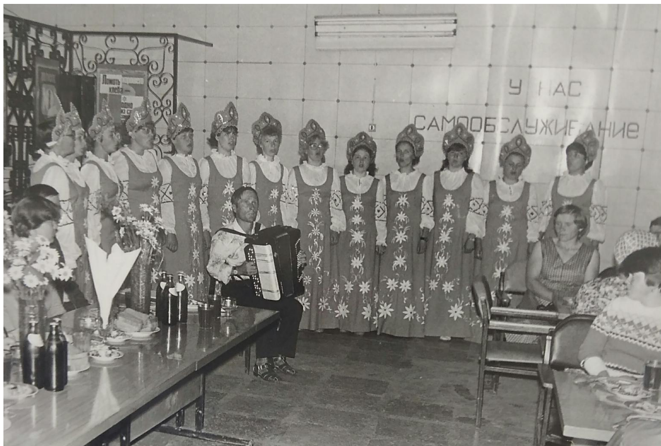
Выступление хора отдела культуры на встрече победителей соцсоревнования и передовиков производства. 9 июля 1986 г.