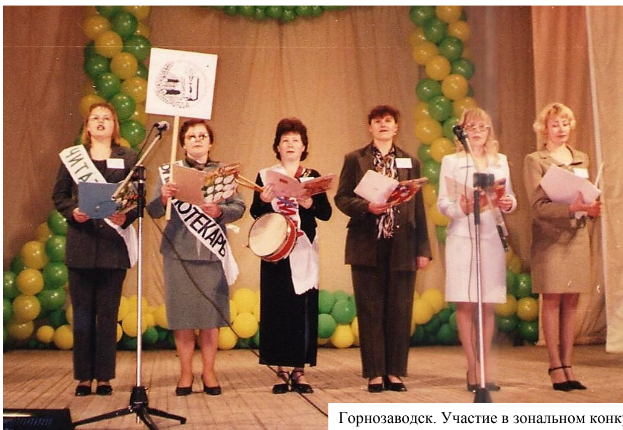
Горнозаводск. Участие в зональном конкурсе

Библиотека развивалась, менялась, совершенствовалась, а мы – постоянно учились: вузы, ежегодное участие в областных школах передового опыта, семинарах и совещаниях, каждые 5 лет – курсы повышения квалификации.