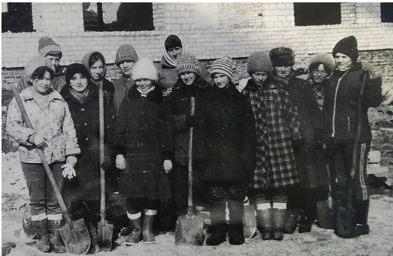
Коммунистический субботник к 20 съезду ВЛКСМ. На строительстве новой школы. 1987 г.