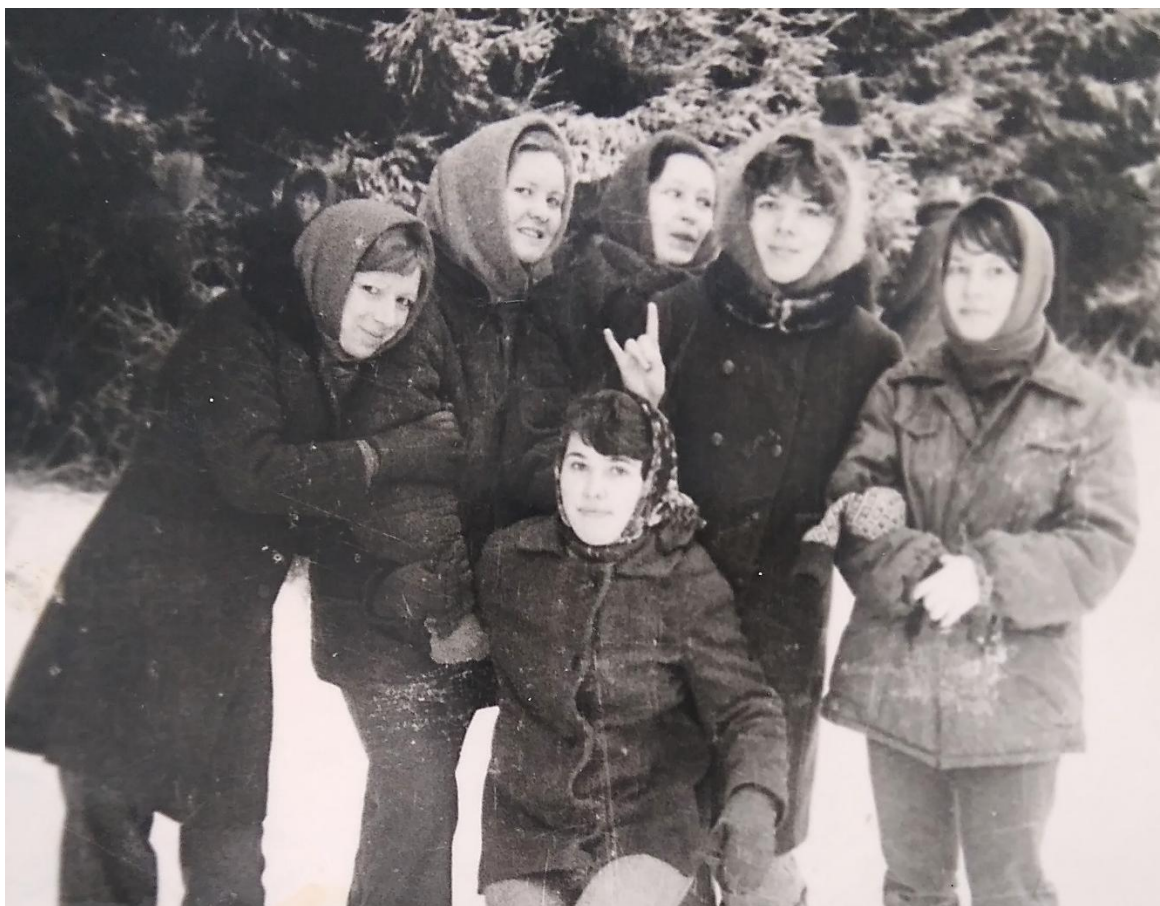
На заготовке хвойной лапки. 1980 г.