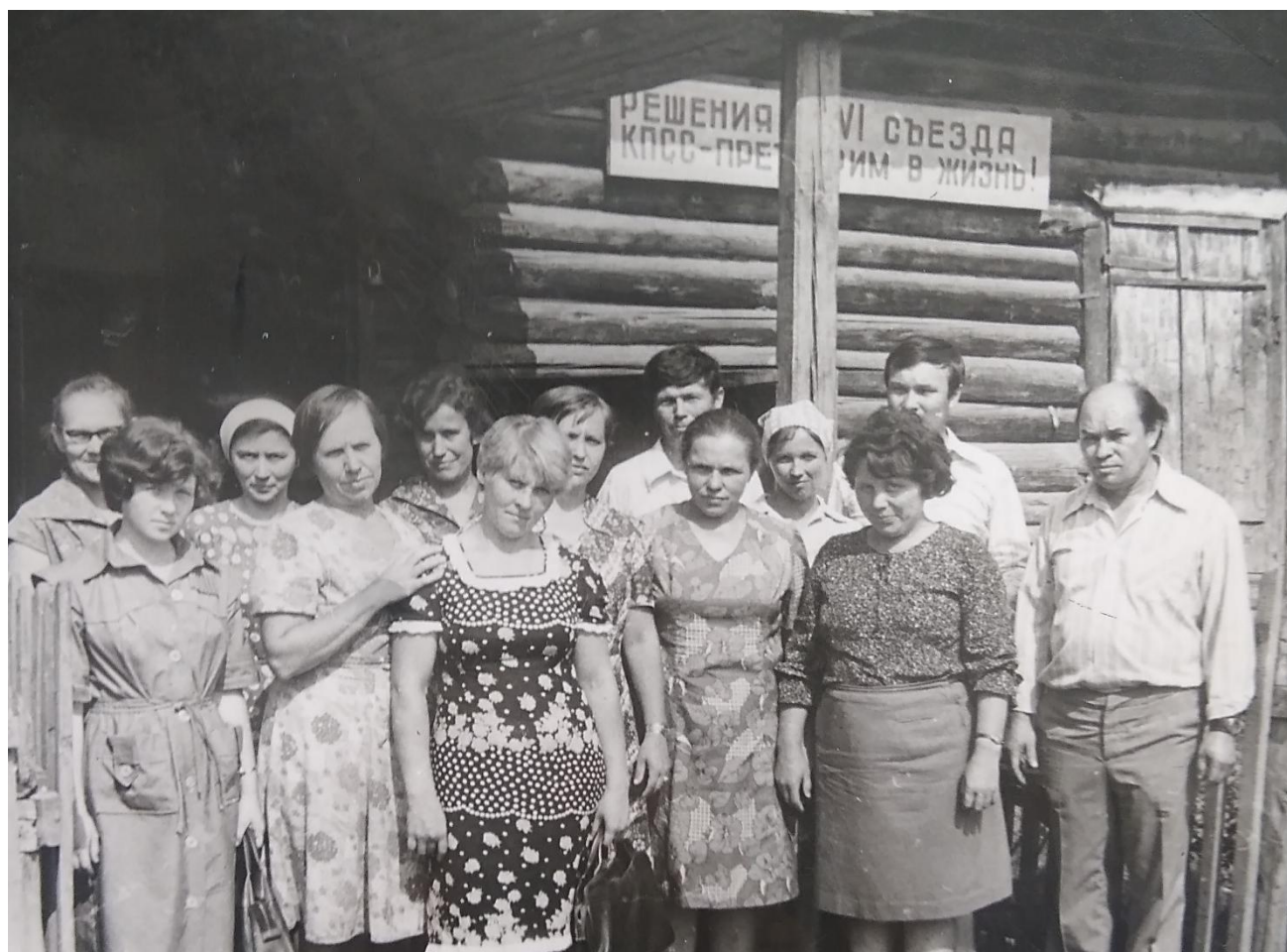
Взаимопроверка библиотек Уинского района. 1981 г.