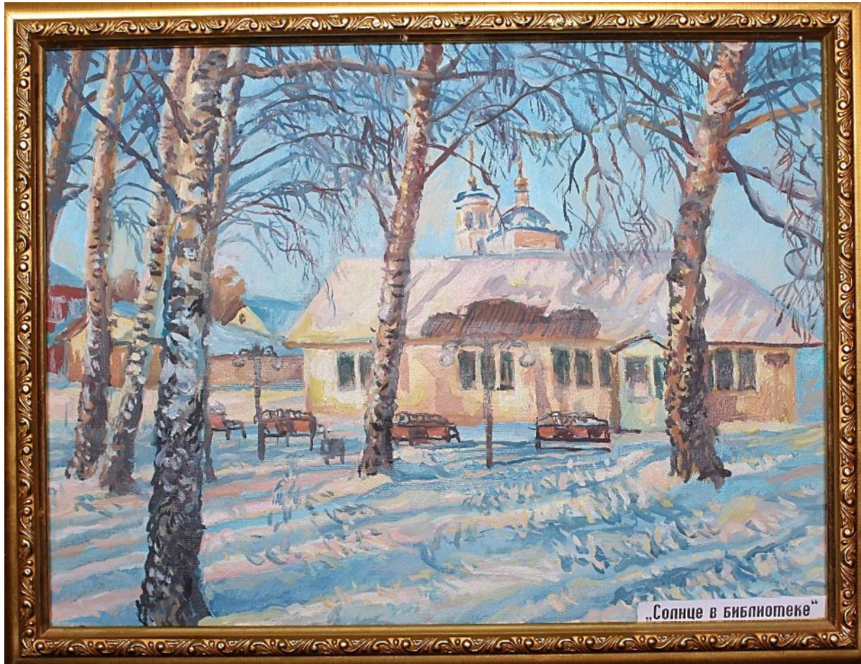
С.Мухинъ (С.Татауров). Солнце в библиотеке