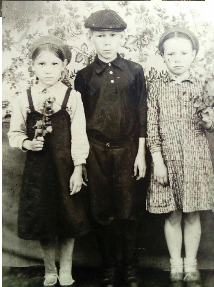
Безукладниковы Антонида, Николай, Анна. 1943 г.