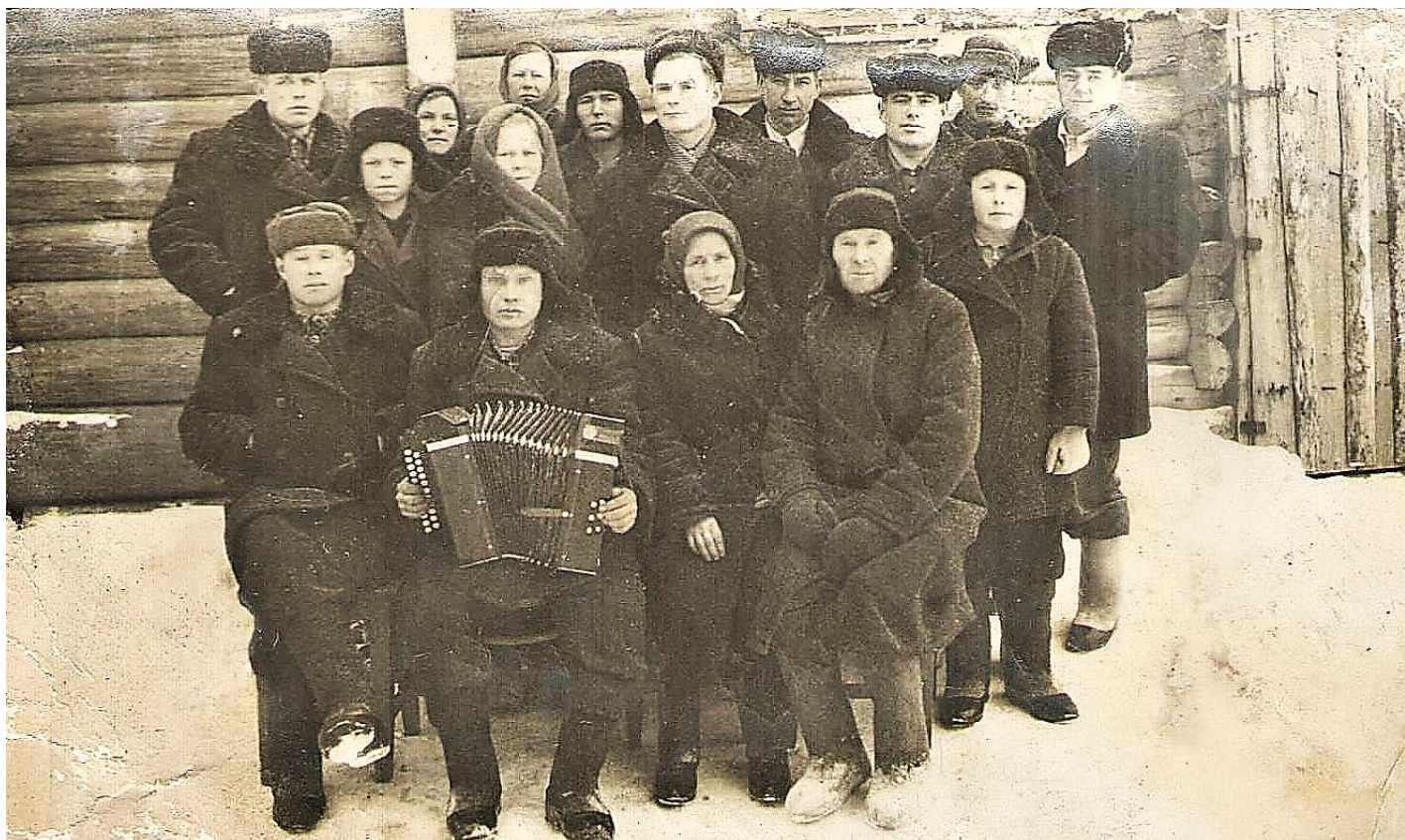
Проводы в армию, 1950 г.