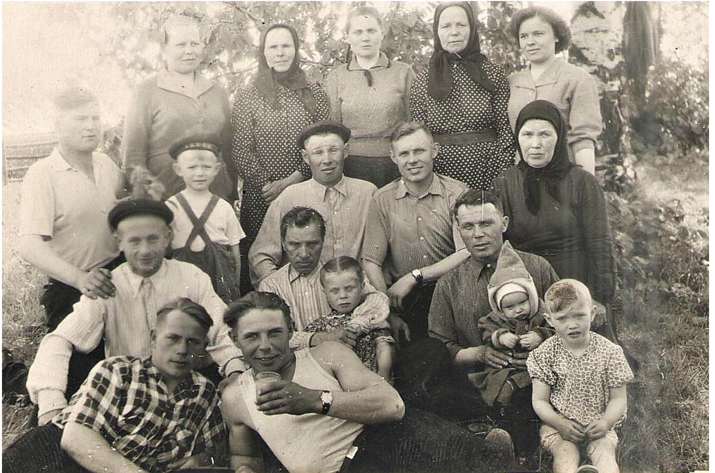
Иванов день. 1960 год.

Престольным праздником в деревне Голузино был Иванов День (11 июня). В этот день принимались гости, их усаживали за столы и угощали. В праздники, загодя, пеклись большие и маленькие пироги, трех – четырех сортов шаньги,