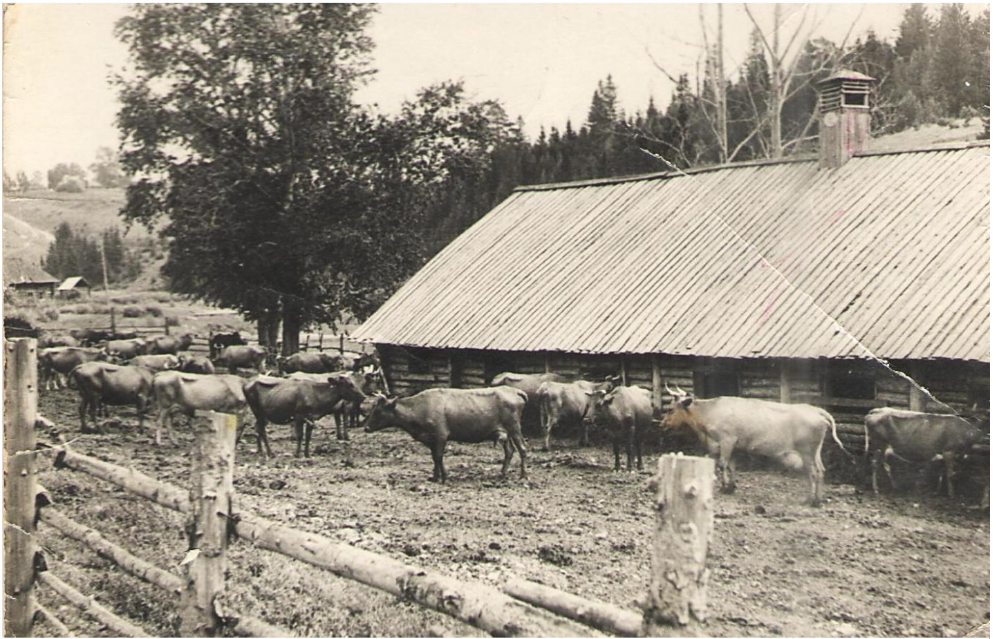
Коровник. Примерно 1947 год.

Обжитое место в пойме реки жители любовно называли Подгорица. Что же включала в себя Подгорица? По правую сторону взвоза - улицу Подгорную, находившуюся недалеко от нее свиноферму и около лесочка коровник. По левую сторону взвоза – «капустник». Это обгороженные жердями грядки, на которых ежегодно каждая семья высаживала капусту. Удобно, река рядом! Не бадьи же таскать! В годы войны за «капустником» была построена птицеферма. Держали белых курей (кур), но птицеферма просуществовала только 2 года. Далее, за птицефермой, в горе, жители нашли небольшую пещеру. Говорили, что ее ходы тянутся под всей горой, на которой стоит деревня Голузино.