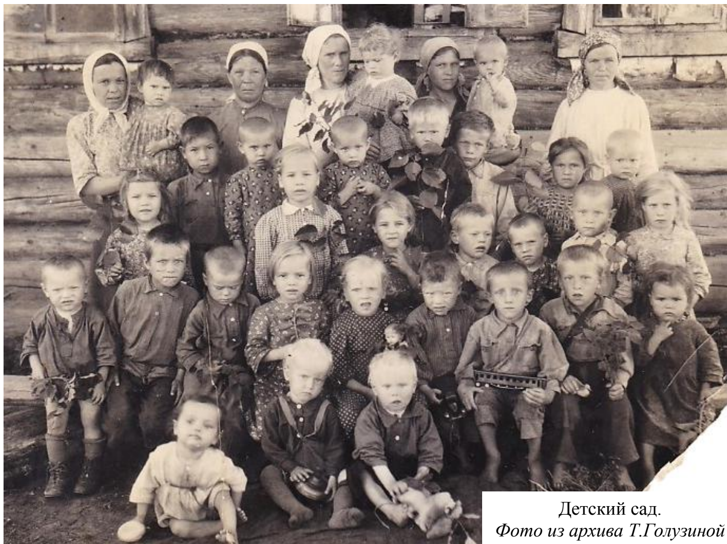
Детский сад.

Мы покупали платья и платки капроновые с павлинами, красивые, разноцветные. Покупали сладости какие-нибудь, сахар кусковый, который