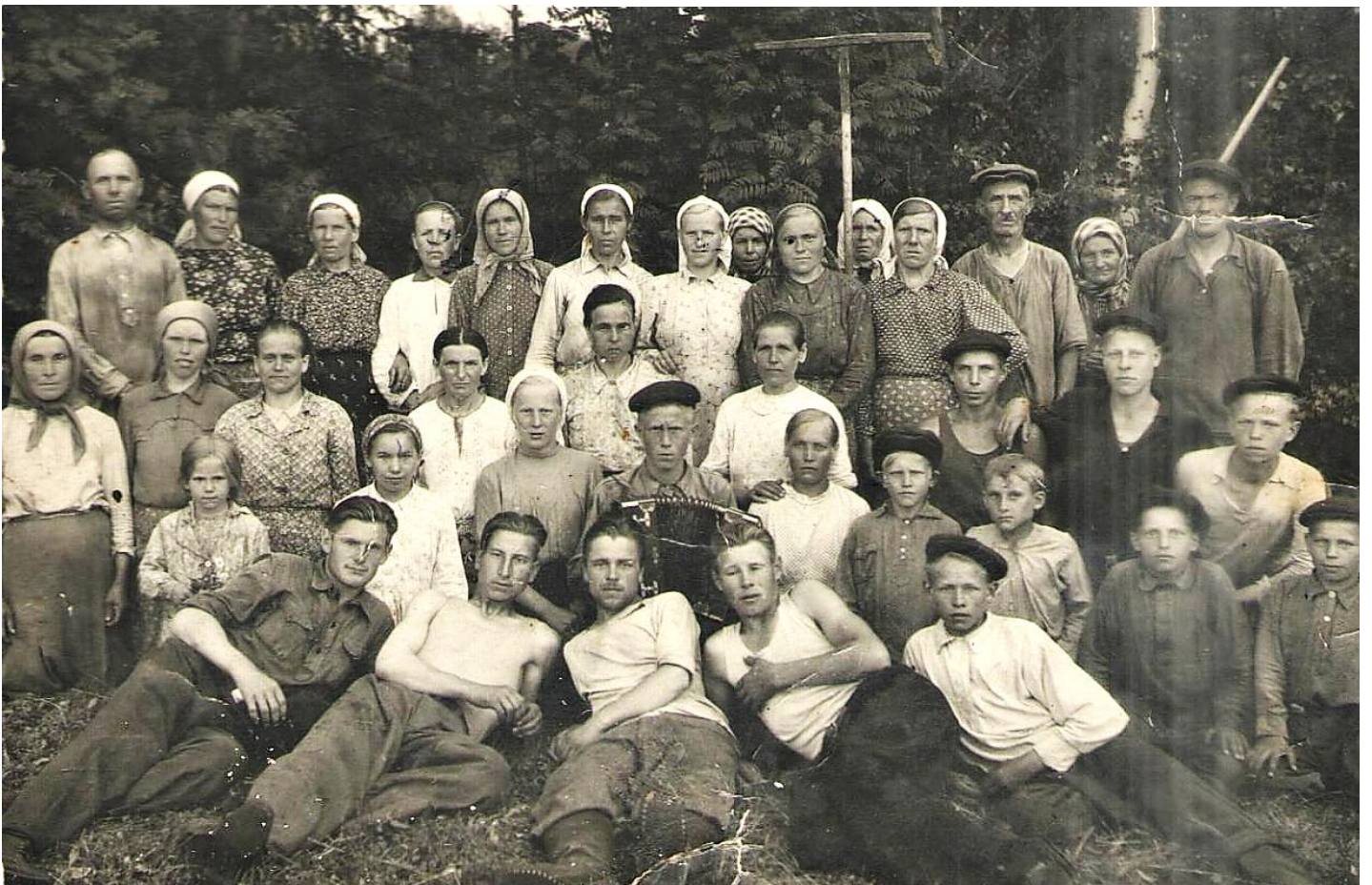
Сенокос. 1954 год.

Ничего не осталось от той трудяги-деревни и лишь черёмуха, которая росла в огороде у деда, напоминает нам о былом.