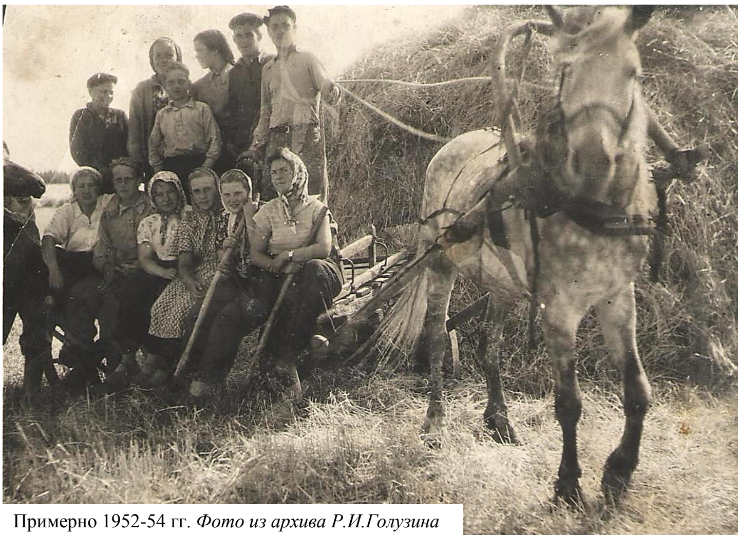
Примерно 1952-54 гг.

Запомнились некоторые улицы: Бараба, Ремково, Подгорная. Чтобы спускаться на лошадях из деревни вниз, нужна была дорога, которую не просто было проложить в горе. Когда-то предки жителей деревни сделали эту дорогу к низине, она называлась взвозом. По взвозу могли заехать на лошадях, а позднее на любом транспорте, в деревню. Сделать взвоз – это труд, наверное, не одного поколения. А в низине текла маленькая речка и стояло несколько домов. Но однажды пришло несчастье – пожар. Он уничтожил большую часть деревни, и жители стали разъезжаться. А сейчас, говорят, один жилой дом. И сколько таких заброшенных деревень на Руси, не сосчитать?! А человек всегда тоскует по родным местам – ведь это его малая родина.