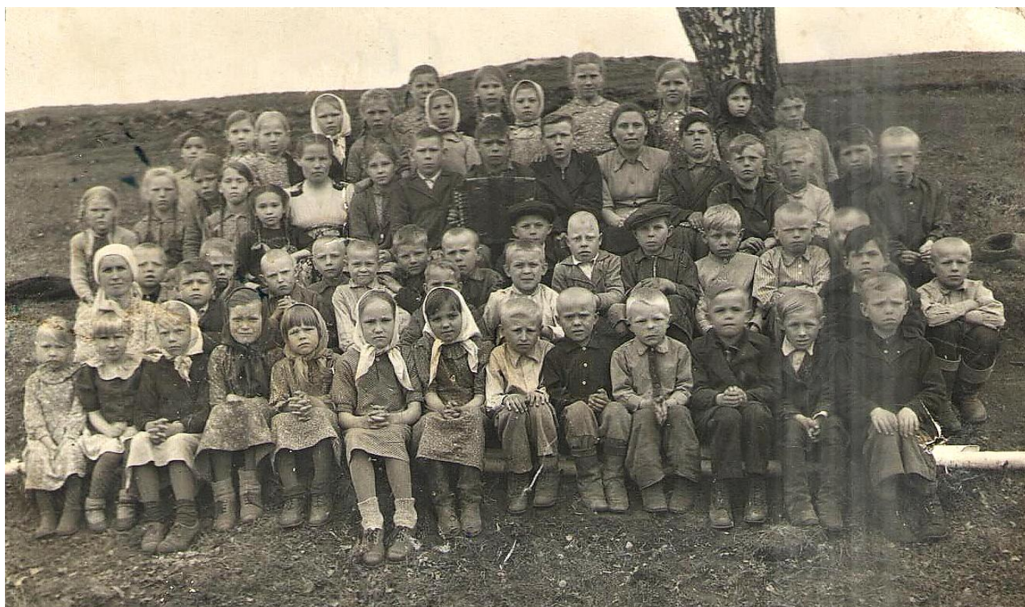
1946 год.