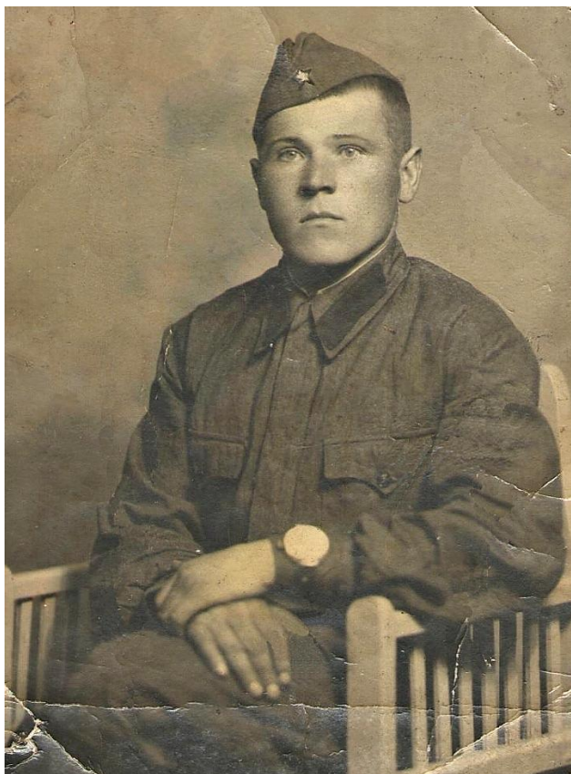
Григорий Михайлович Голузин.