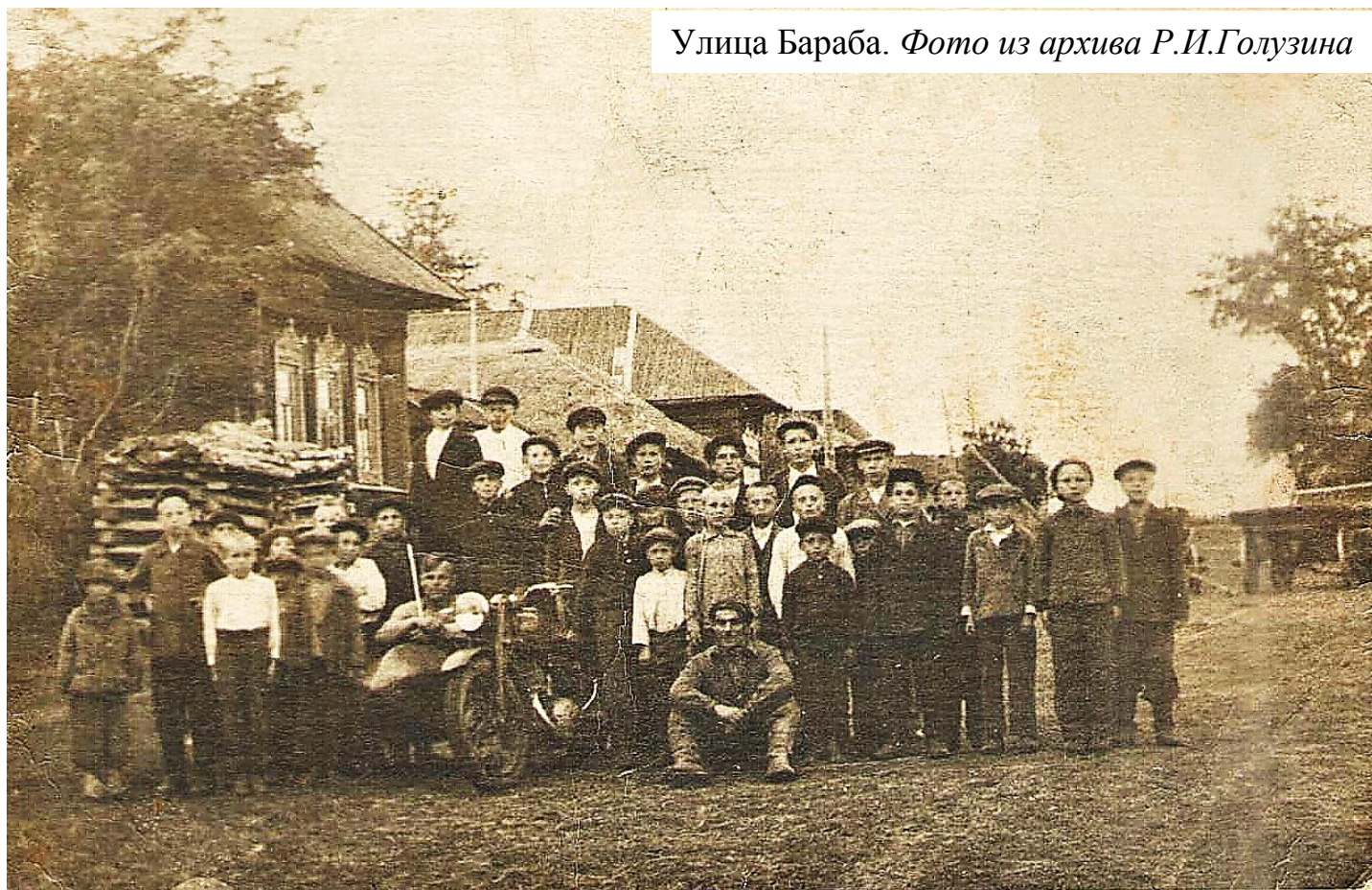
Улица Бараба.