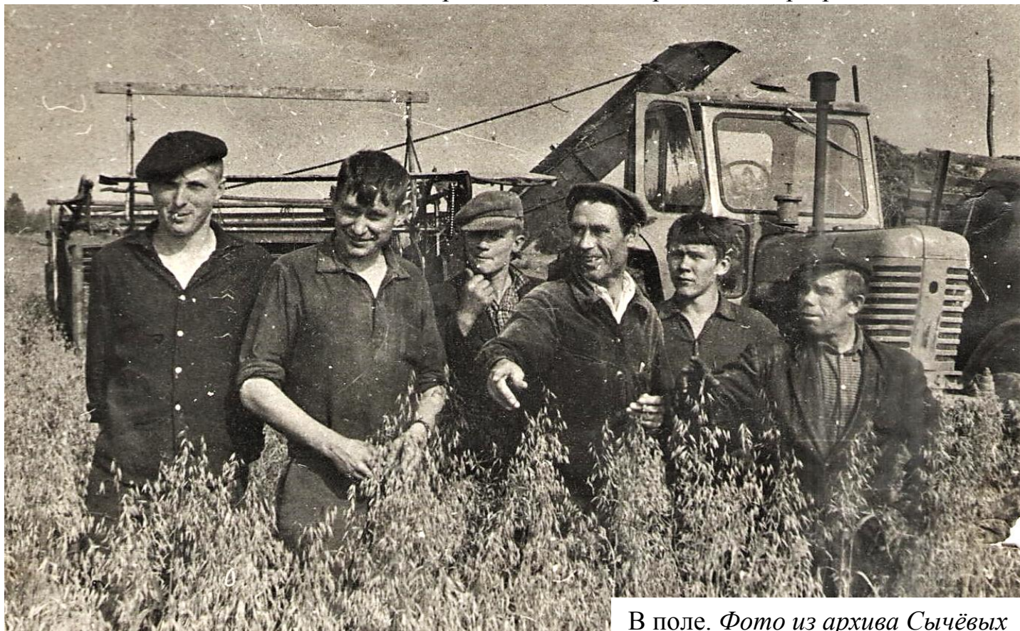
В поле.