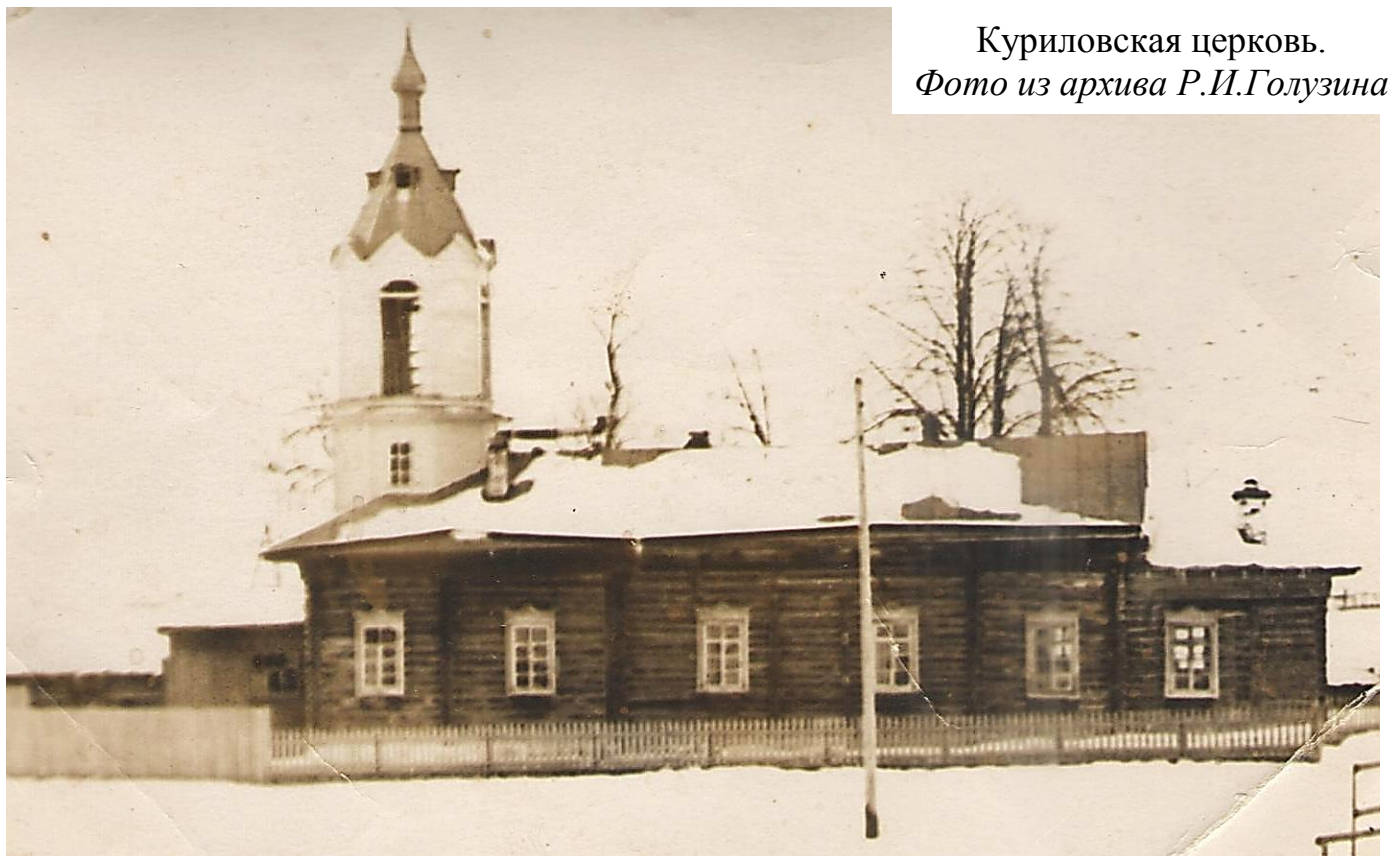
Куриловская церковь.

Дом Матвея Михайловича стоял на краю крутого лога. Лог как бы делил деревню, но только до основной дороги по деревне. В этом логу, по сторонам,