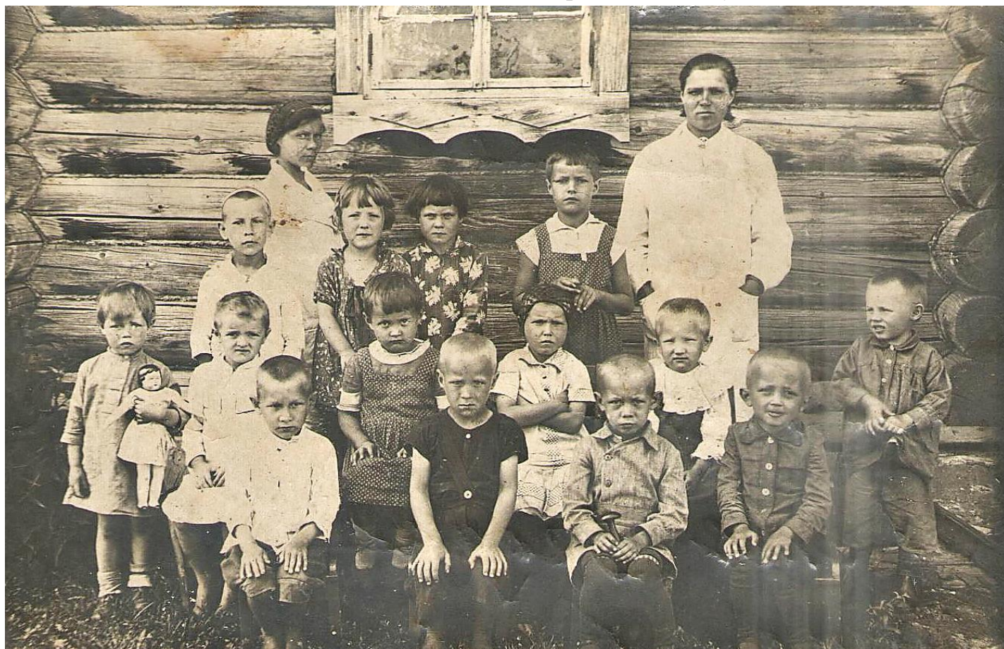
Детский сад, 1938 г.