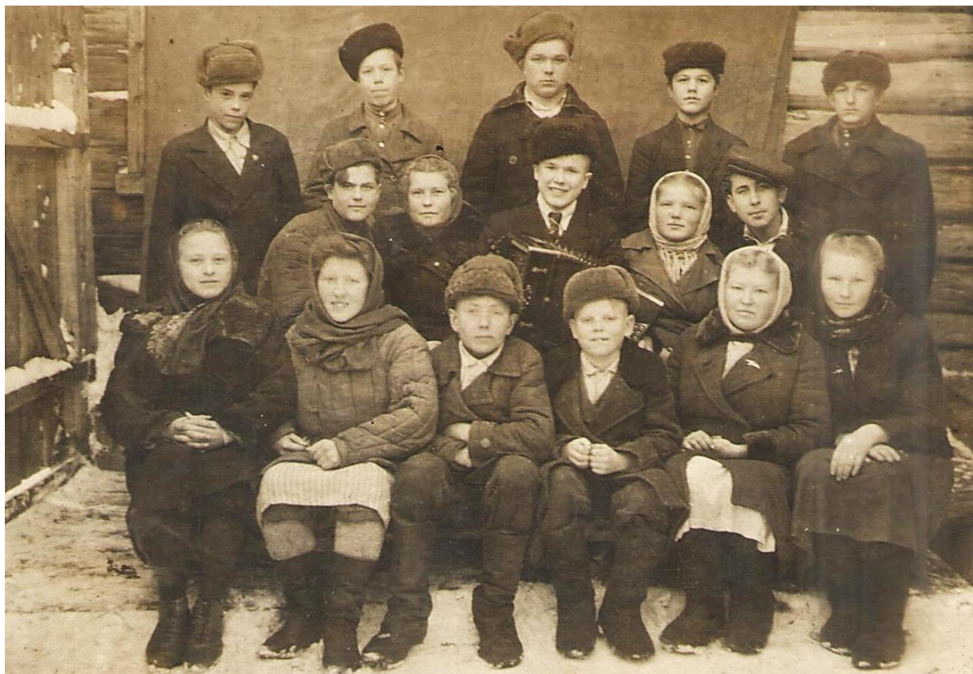
Декабрь 1947 г.