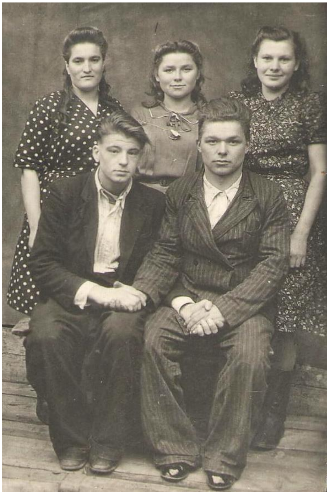
Друзья.