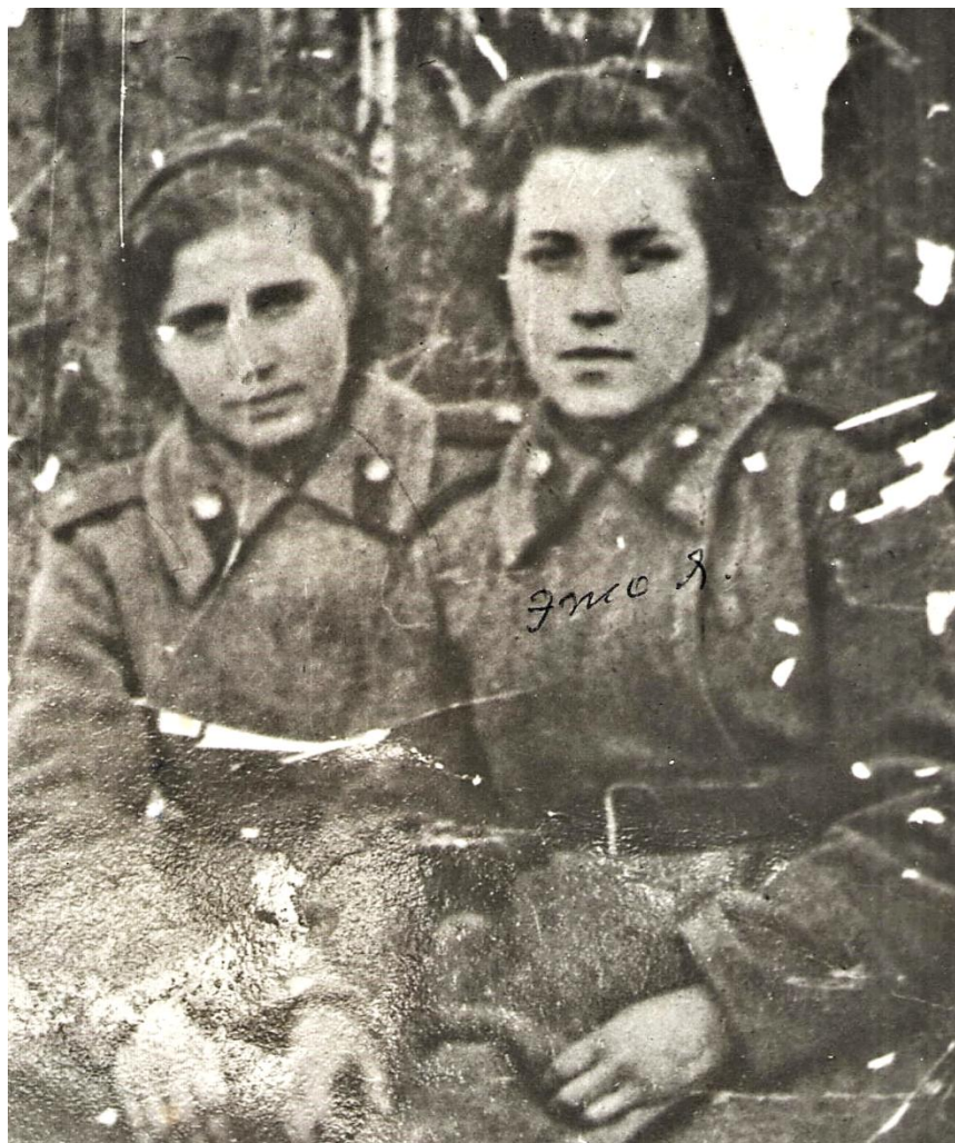
1944 г.