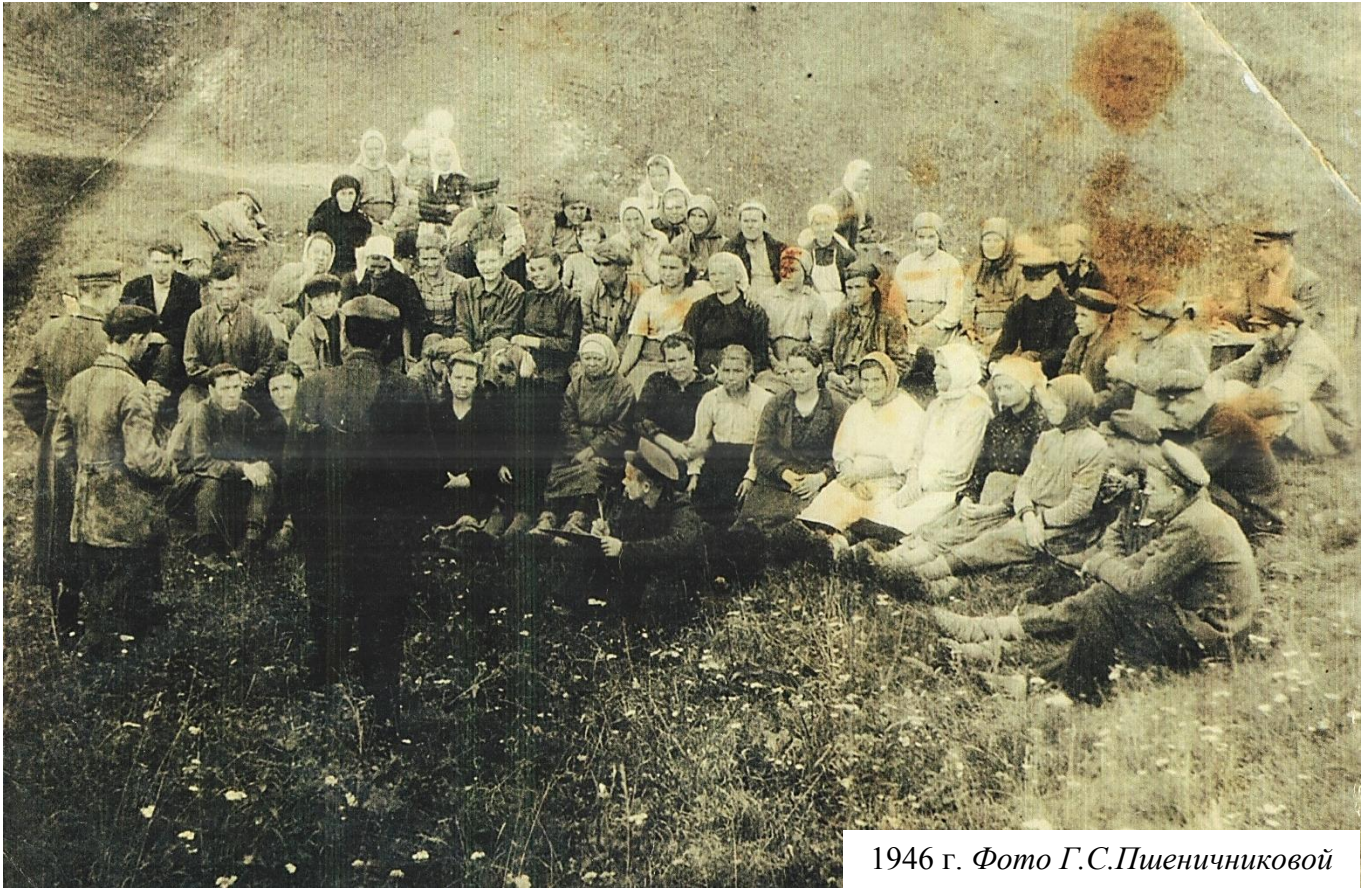
1946 г.