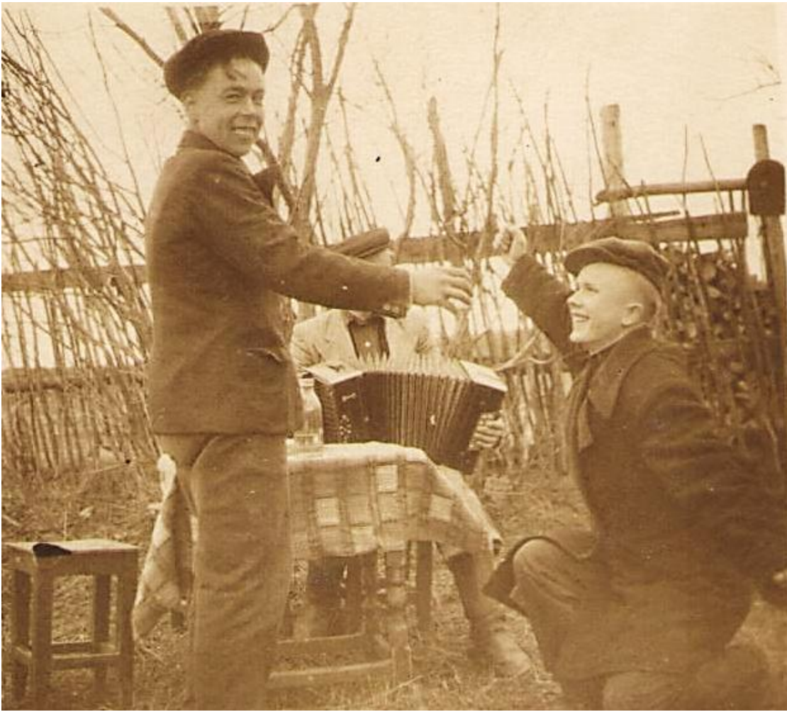
Май 1948 года.