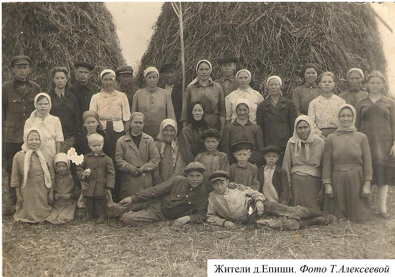
Жители д.Епиши.

ремонт, и Епишка в беде не оставлял никого. Он со временем не считался. Всегда был готов помочь проезжим людям. Нужно колесо к телеге — пожалуйста, есть готовое, и деготь всегда в запасе имеется. Он и лошадь подкует своей самодельной подковой, винтом скрепит облучок у телеги. Его потомки проживают в настоящее время в двух селениях — Пискунах и Епишах. Они так же трудолюбивы, честны и приветливы.