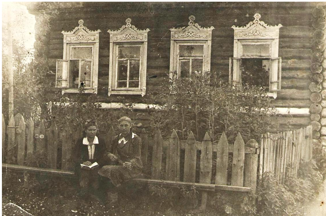
Дом Кобелевых.

И куда б ни ушел, ни уехал, Где бы ты ни работал, ни жил – Всюду слышится дивное эхо Той земли, где счастливым ты был!