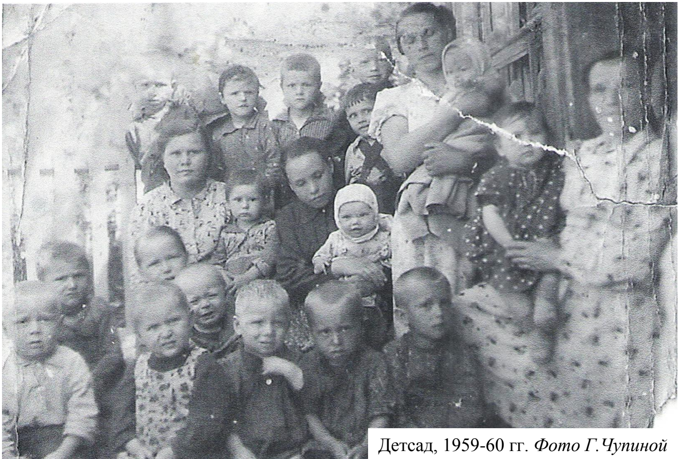
Детсад, 1959-60 гг.