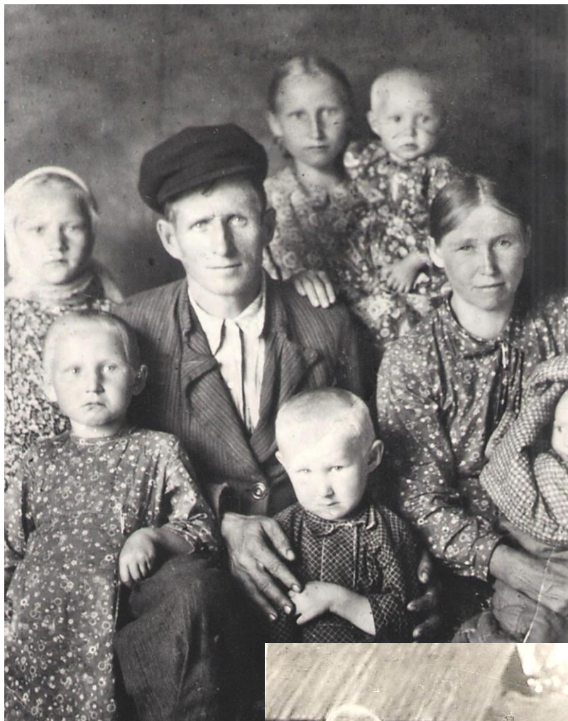
д.Пискуны, 1952 г.