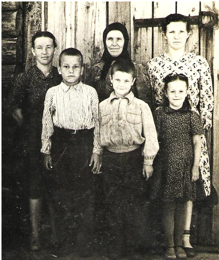
Жители д.Пискуны.