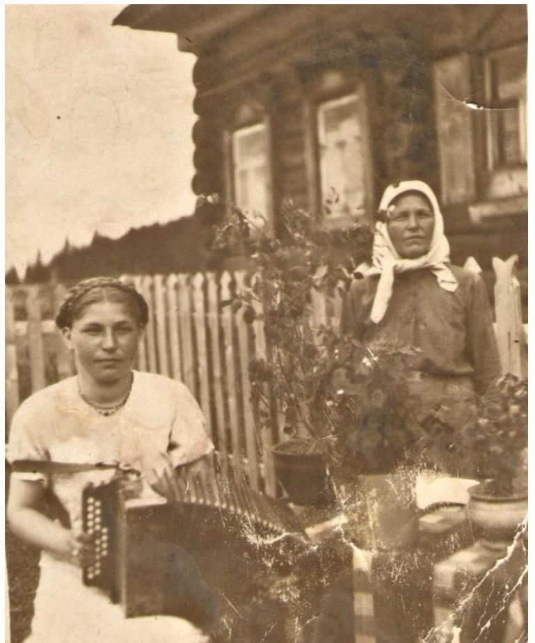
1947 год.