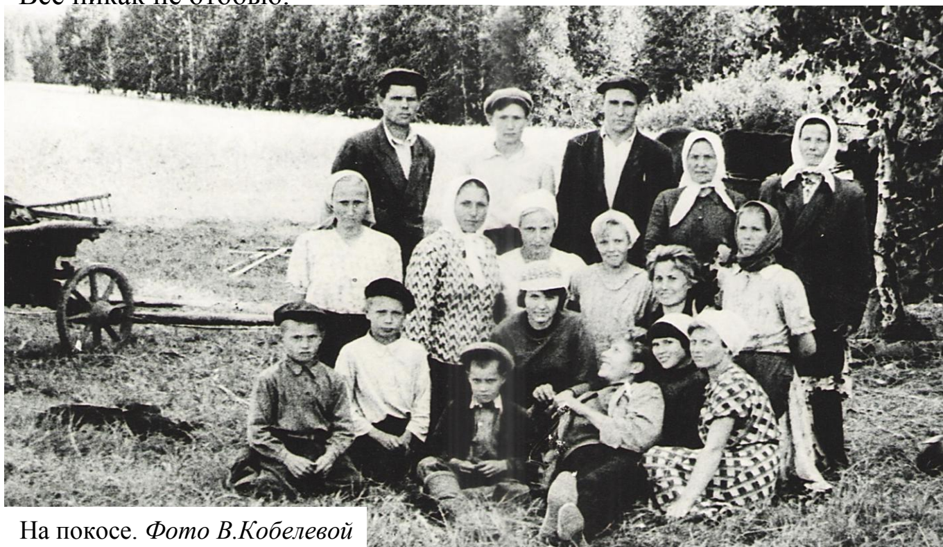
На покосе.

Вода у берега волну качает, А сердце всё тоскует о тебе. Родимый дом, я по тебе скучаю, Вот и опять увиделись во сне. Поля в меду я вижу за болотом, А под окном цветёт акаций куст. Присесть бы тихо на родном крылечке, Побыть там не во сне, а наяву. Моя душа, ну что ты снова плачешь? Ну что ты мне покоя не даёшь? Не может видно в жизни быть иначе. Чего ушло – обратно не вернёшь. В небесах, где душа в облака превращается, Светом тихо своим до тебя прикоснусь... Я – туман. Рано утром с зарей распрощаюсь, Каждой каплей росинки к тебе я прижмусь.