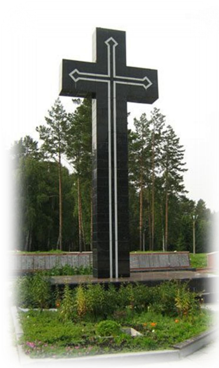
Мемориал жертв политических репрессий 1930-1950-х годов (12-й километр Московского тракта г. Екатеринбурга)

Это было, когда улыбался Только мёртвый, спокойствию рад. И ненужным привеском качался Возле тюрем своих Ленинград. И когда, обезумев от муки, Шли уже осуждённых полки, И короткую песню разлуки Паровозные пели гудки, Звёзды смерти стояли над нами, И безвинная корчилась Русь Под кровавыми сапогами И под шинами чёрных марушь.