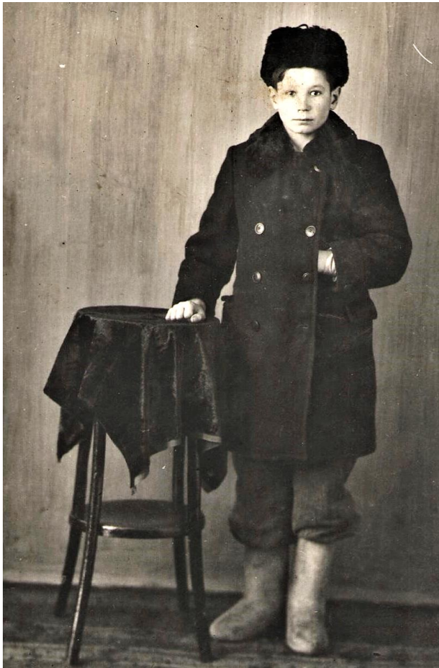
Иван Арапов.