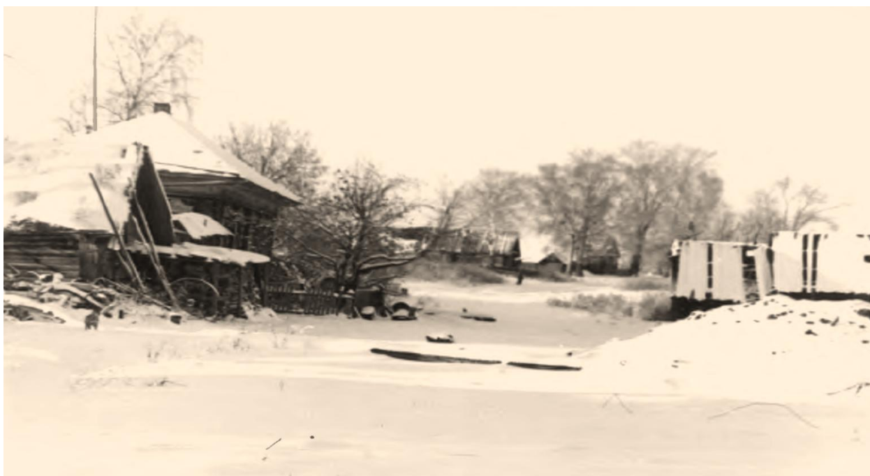
Общий вид д. Подавихи, 12.11.1980 г.

В 1909 году при Подавихинском училище открыли библиотеку, в которой в 1912 году насчитывалось 385 томов книг и был уже 31 читатель.