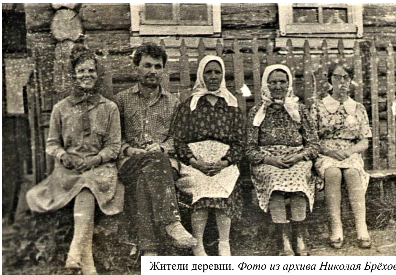
Жители деревни.