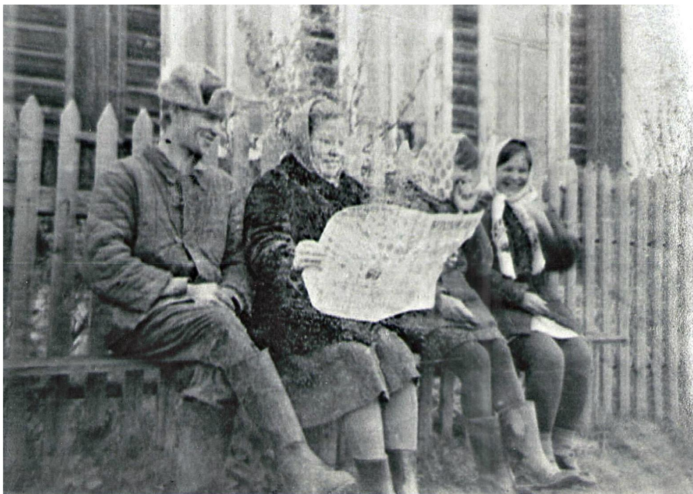
Новости Мужики