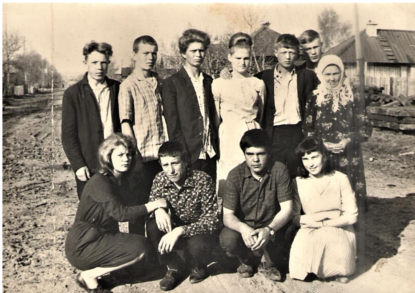
Молодёжь деревни.

Если бы вернуть всё назад и снова вернуться жить в деревню, я бы, не раздумывая, уехала туда.