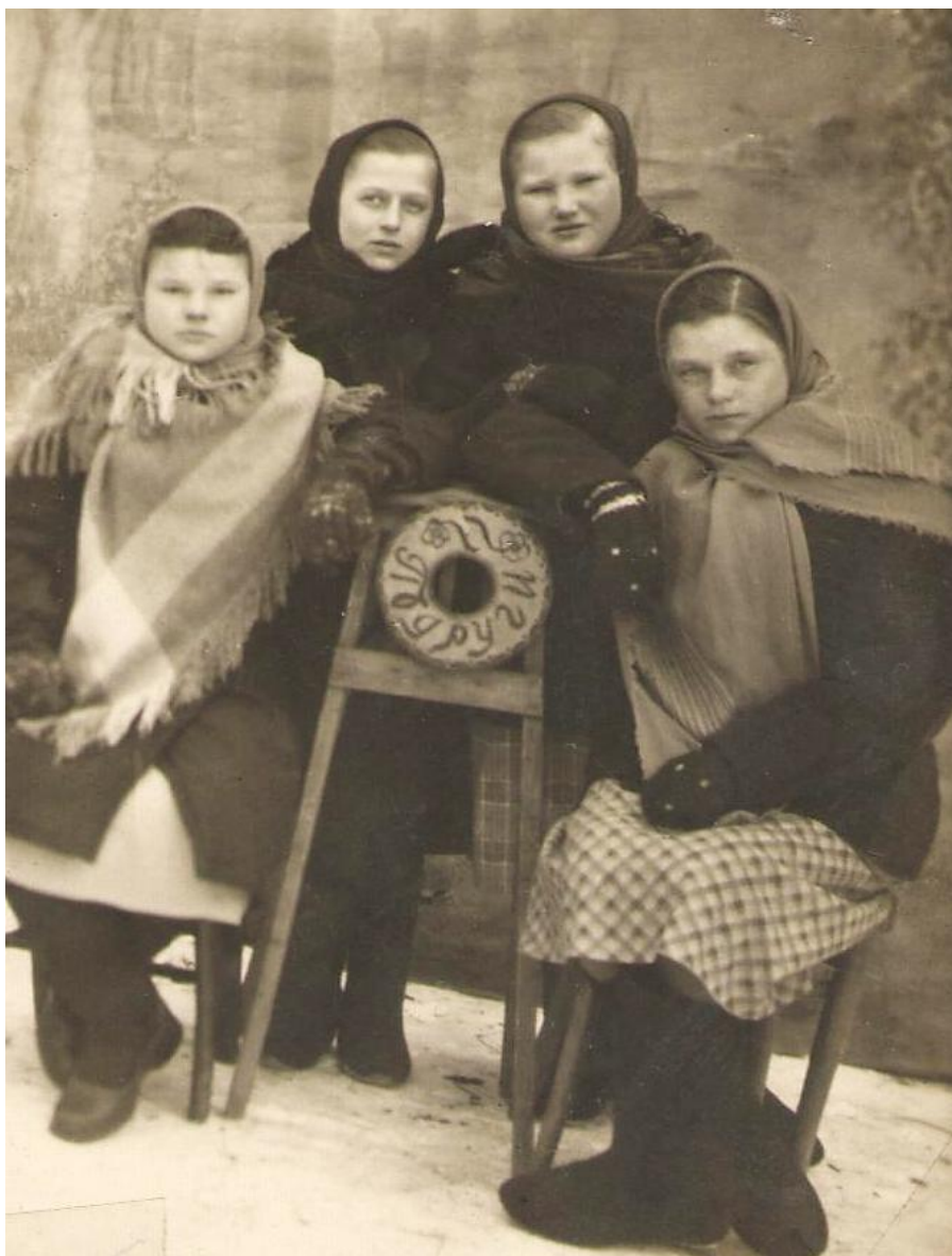
1946 год.