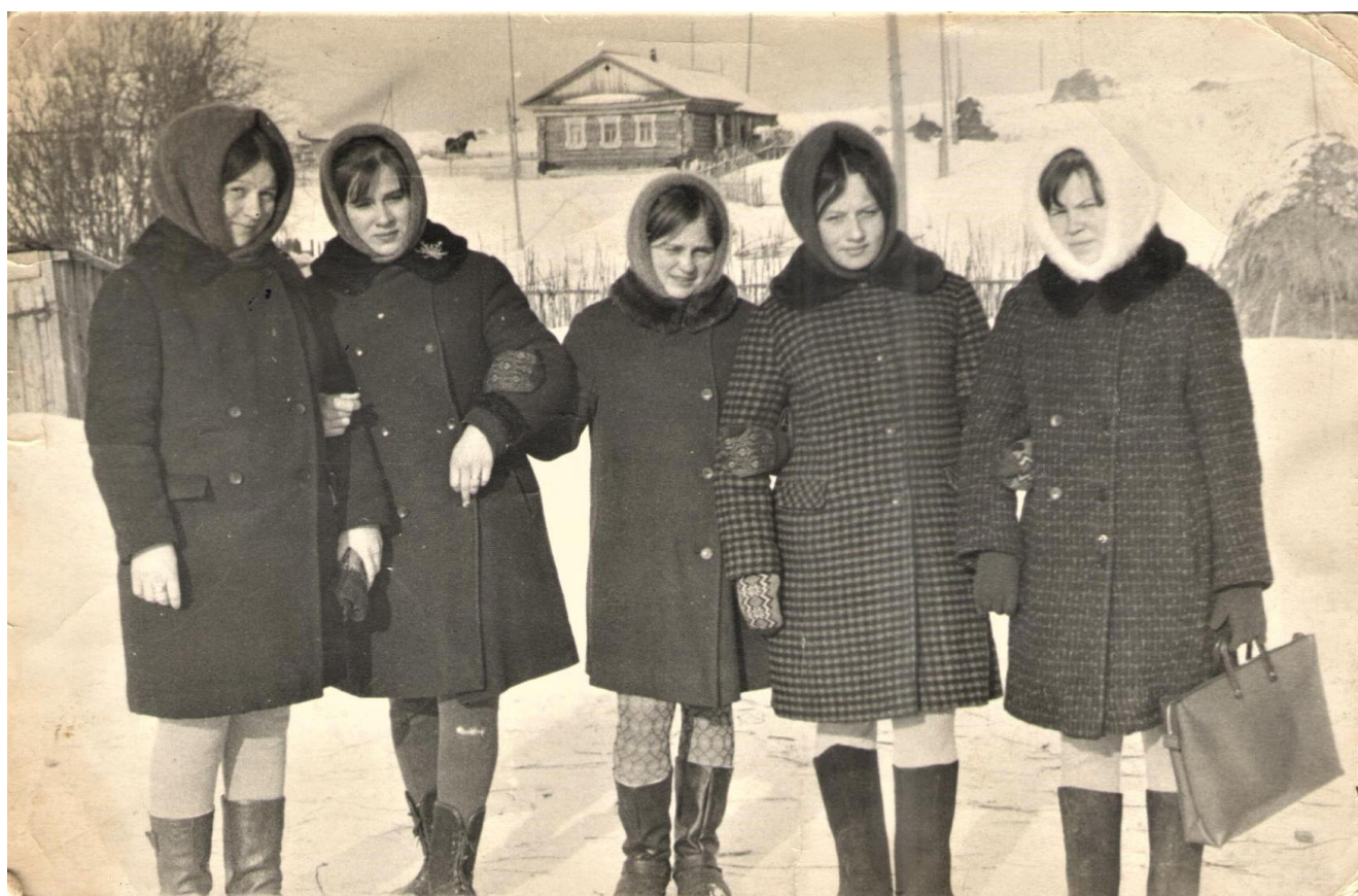
1971 г.