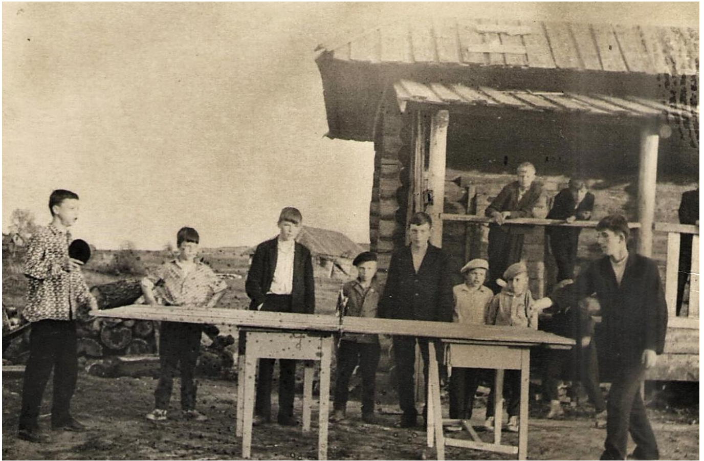
У избы-читальни, лето 1966 г.