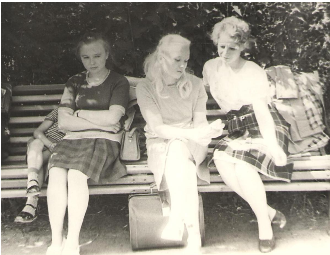
Нина и Галя Феденёвы.