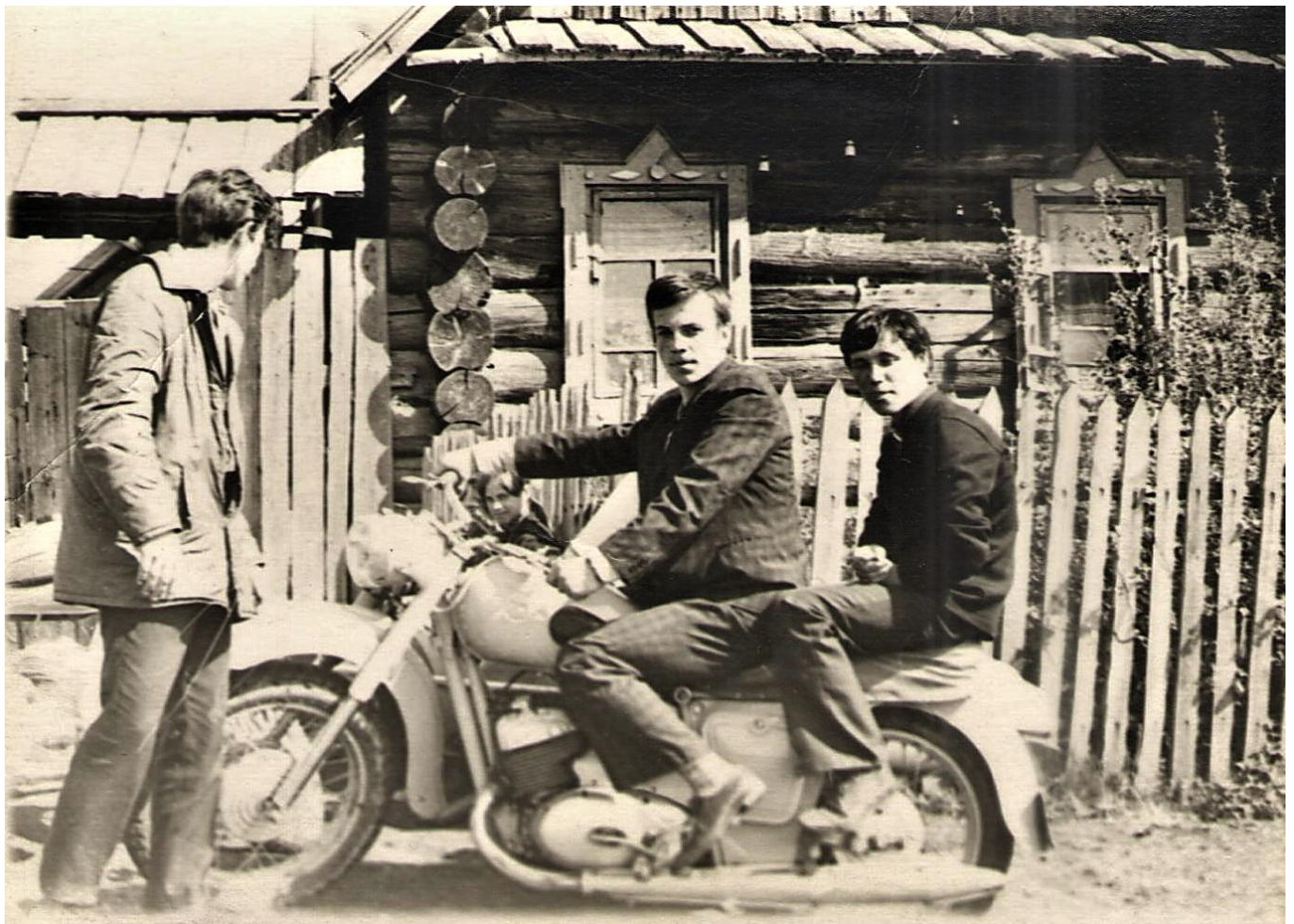
У дома Н.И.Коноваловой.