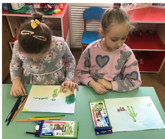
Изготовление папки – передвижки «23 февраля».