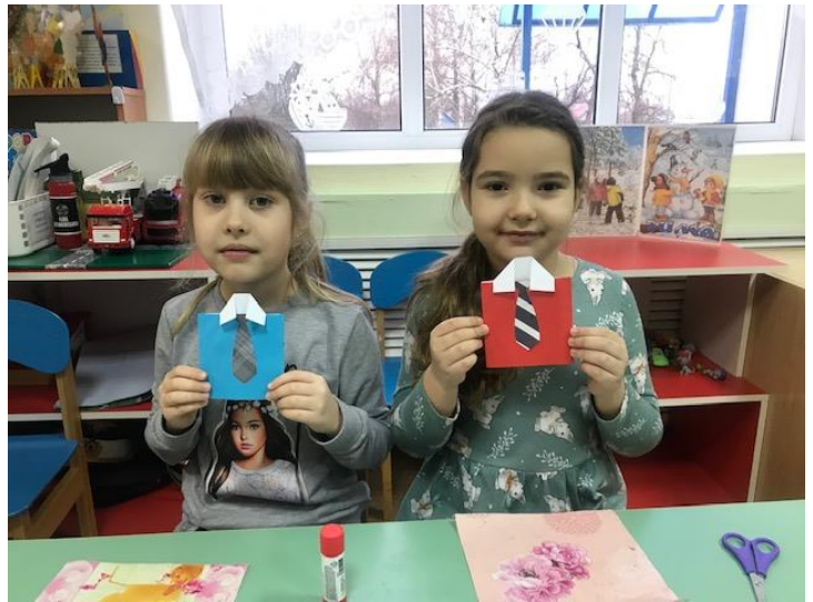
Акция «Письмо солдату».