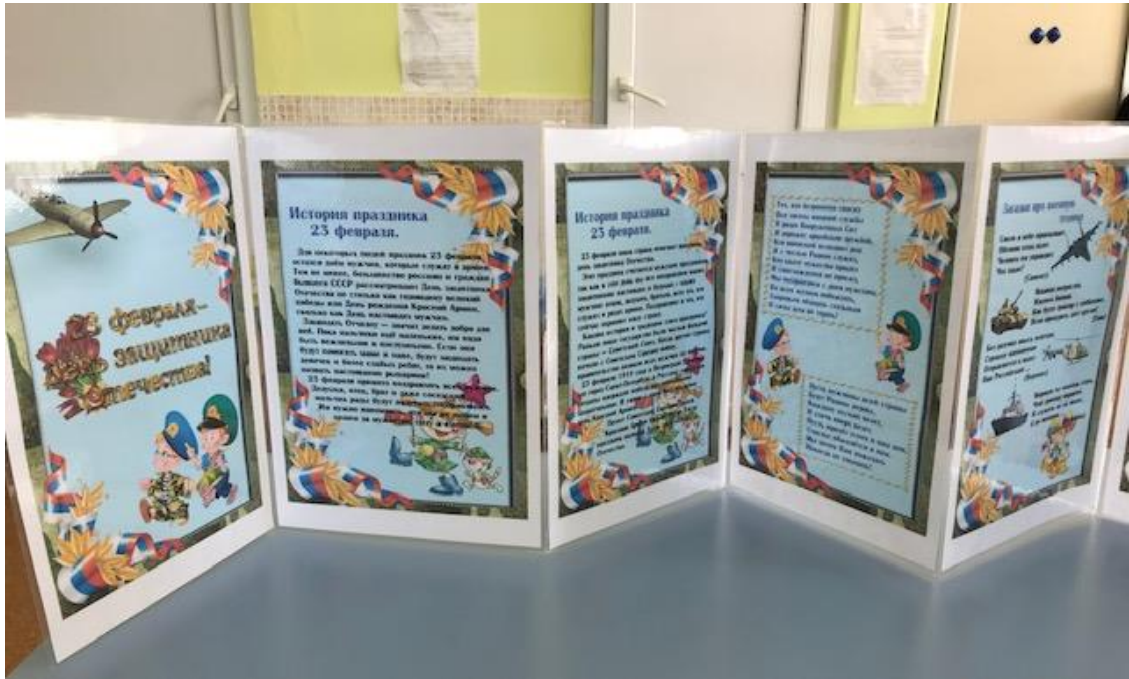
Изготовление поздравительной газеты к празднику