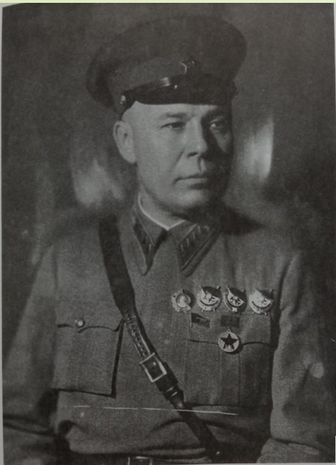
Тимошенко Семен Константинович, главнокомандующий войсками Западного направления, заместитель наркома обороны, Маршал Советского Союза