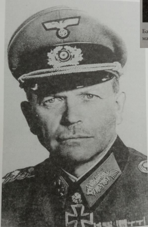
Гудериан Гейнц, генерал-полковник, начальник Генштаба сухопутных войск Третьего рейха