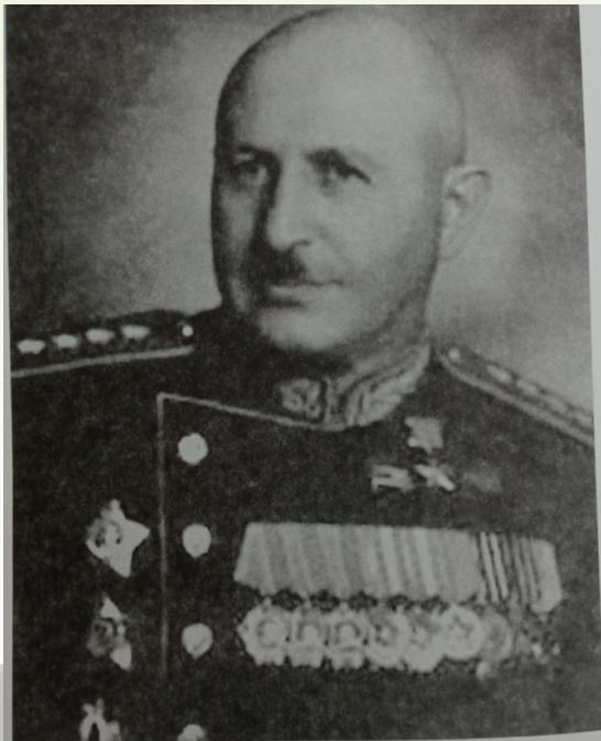
Баграмян Иван Христофорович, советский военачальник, командующий 3-м Белорусским фронтом