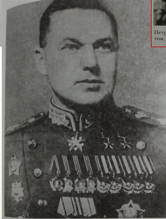
Рокоссовский Константин Константинович, командующий 2-м Белорусским фронтом, Маршал Советского Союза