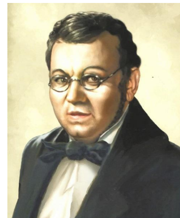
Пётр Павлович Ершов (1815–1869)

Петр Павлович вел активную общественную деятельность в сфере образования: благодаря его содействию были открыты новые гимназии, в тот числе и редкие в тот период женские. В своем колледже Ершов основал студенческий театр, для постановок которого сочинял пьесы.