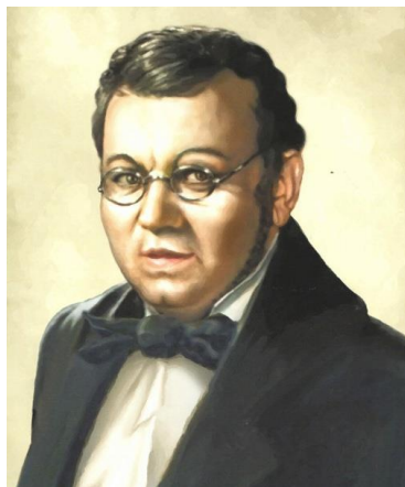
Пётр Павлович Ершов (1815–1869)

Петр Ершов – русский поэт 19-го века, автор прозаических и драматургических произведений. Создатель знаменитого «Конька-горбунка», вошедшего в список бессмертных произведений русской классики.