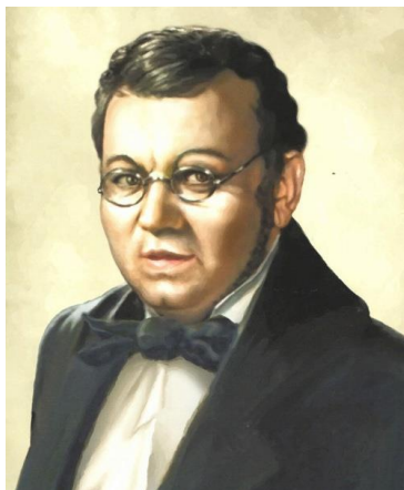
Пётр Павлович Ершов (1815–1869)

Петр Павлович вел активную общественную деятельность в сфере образования: благодаря его содействию были открыты новые гимназии, в тот числе и редкие в тот период женские. В своем колледже Ершов основал студенческий театр, для постановок которого сочинял пьесы.