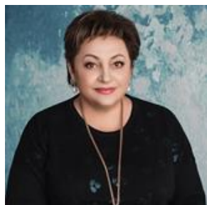
Мария Метлицкая (1959)

Мария Метлицкая — является автором нескольких десятков книг, написанных в жанре популярной литературы. Она пишет по три книги в год, которые расходятся многотысячными тиражами. Огромная армия поклонниц считает ее своей подругой, учительницей и наставницей. Ее книги часто называют «мелодрамой в прозе»; читая их, кажется, что смотришь сериал про маленькую жизнь маленьких женщин, про их обиды, ошибки, страдания.