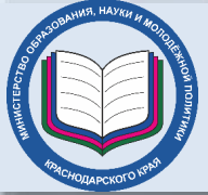
Схема проведения в 2018/2019 учебном году

Вправе пересдать сочинение (изложение) в дополнительные сроки в текущем учебном году обучающиеся: