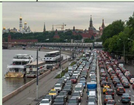
Загрязнение воздуха в г. Москве

Город Липецк, население которого составляет около 500000 жителей, расположен в Центральном федеральном округе. Это крупнейший в Европе центр чёрной металлургии. Город Москва – самый большой город и главный транспортный узел страны.