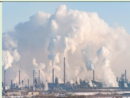
Загрязнение воздуха в г. Липецке