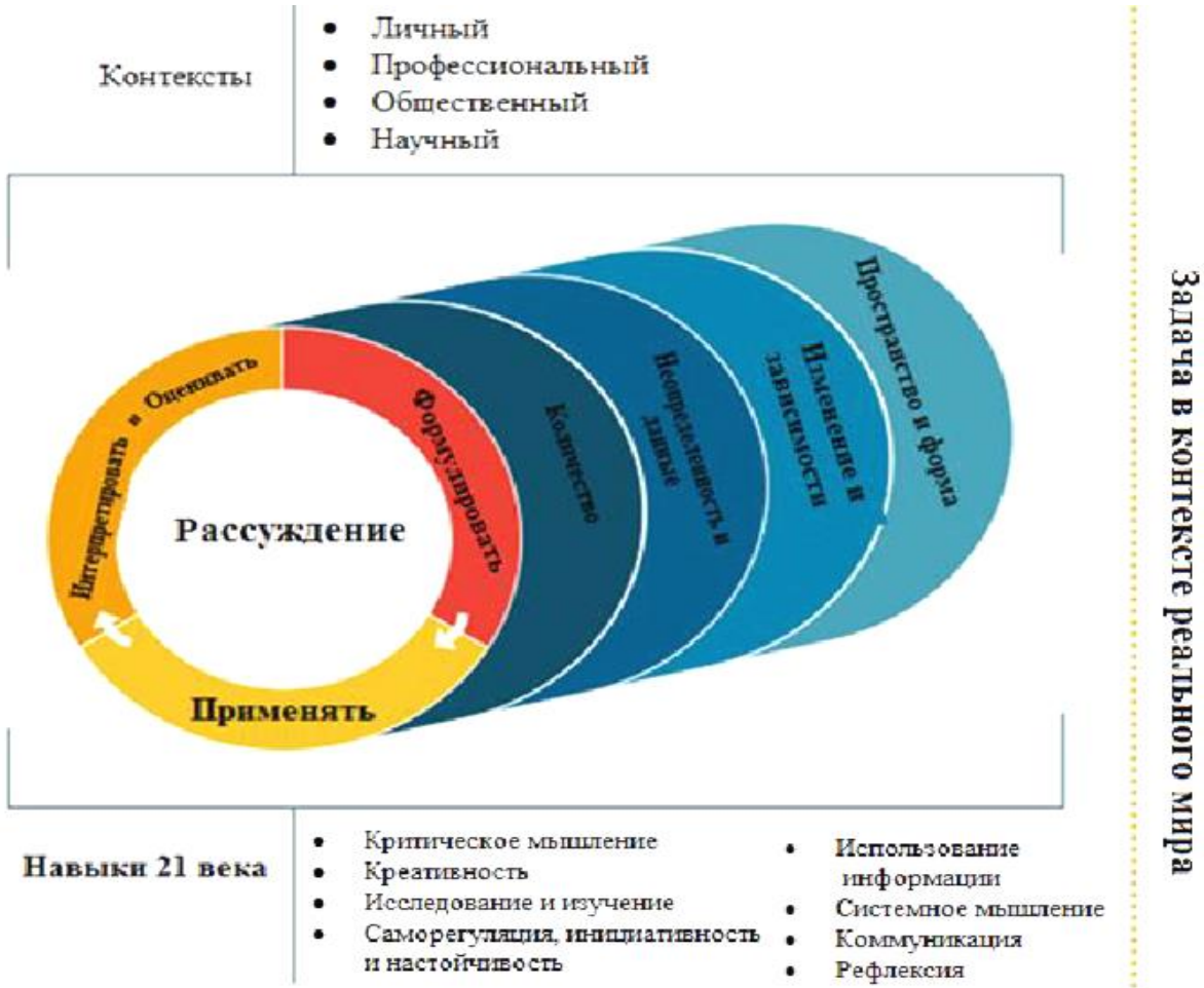
Рис. 1. Навыки XXI века

саморегуляция, инициативность и настойчивость; использование информации; системное мышление; коммуникация; рефлексия [4].