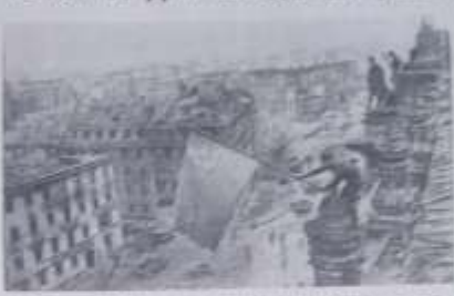
На плакате: воздушная атака на Берлин, май 1945 года.

Двадцать лет советский народ, завоевавший свободу, продолжает бороться за свободу и независимость своего народа. Мы считаем, что все вопросы, которые были поставлены на сессию, были рассмотрены и разрешены.