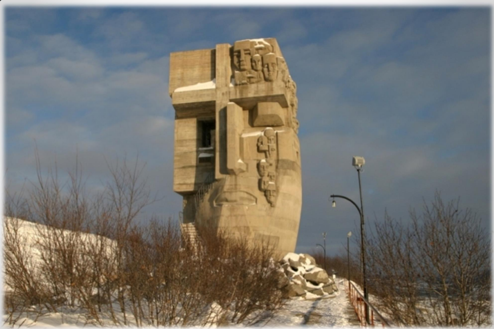
• ..Магадан, мемориал «Маска скорби» •