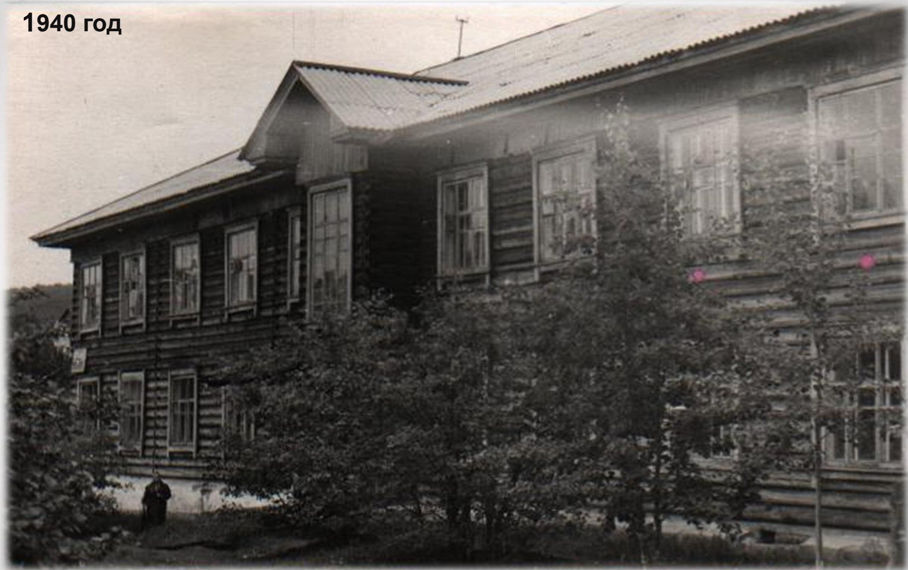
Средняя школа №1 г. Киренска