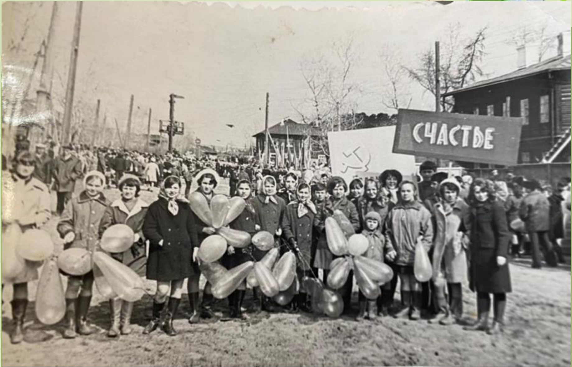
Первомайская демонстрация жителей Киренска на Ленина улице. 1973 г.