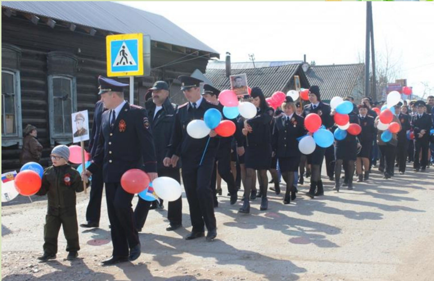
Я на праздничном шествии 9 мая по улице Ленина. 2013 г.