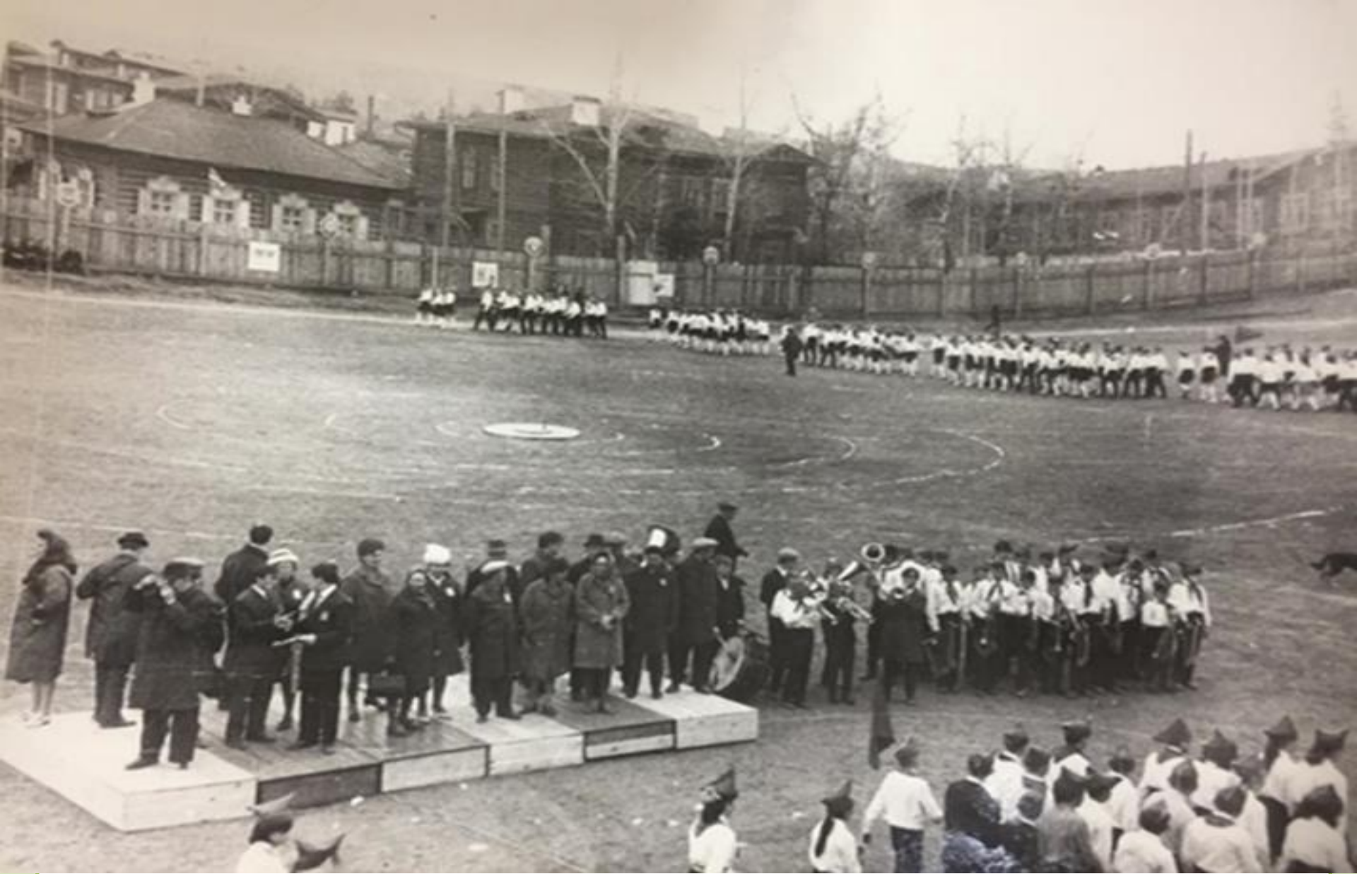
Празднование 50-летия пионерской организации на территории стадиона «Водник», 19 мая 1972 года.