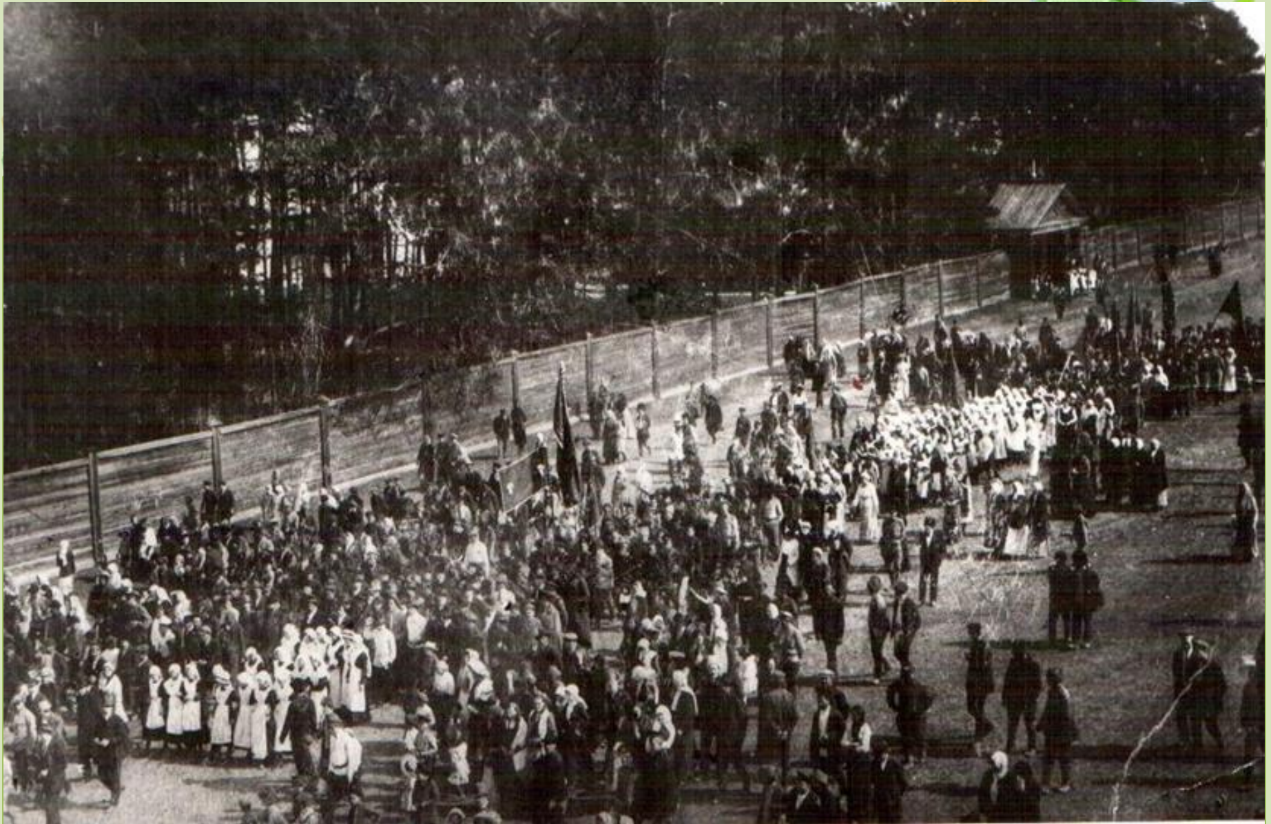
Первомайская демонстрация жителей Киренска на Троицкой улице. 1917 г.