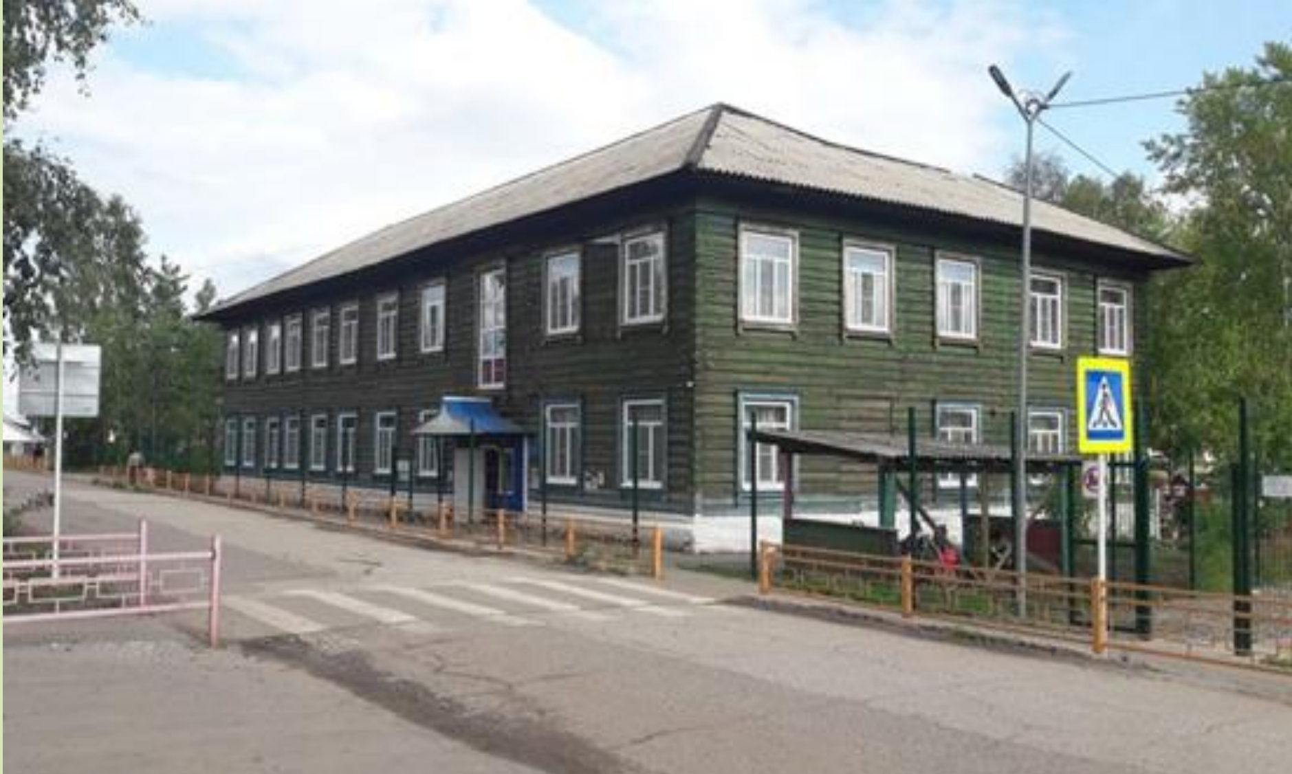
Муниципальное казённое дошкольное образовательное учреждение «Детский сад № 9 г. Киренска».