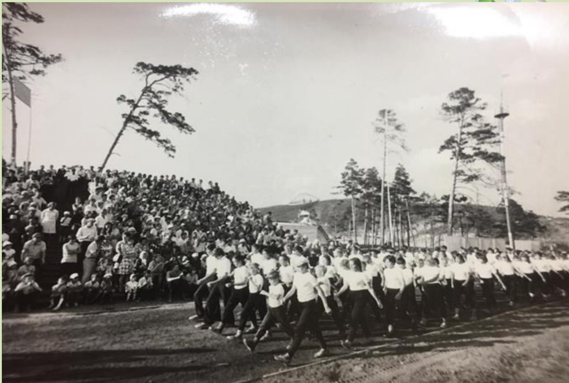
Шествие спортсменов на стадионе в честь 200-летнего юбилея города, 26 июня 1975 года.