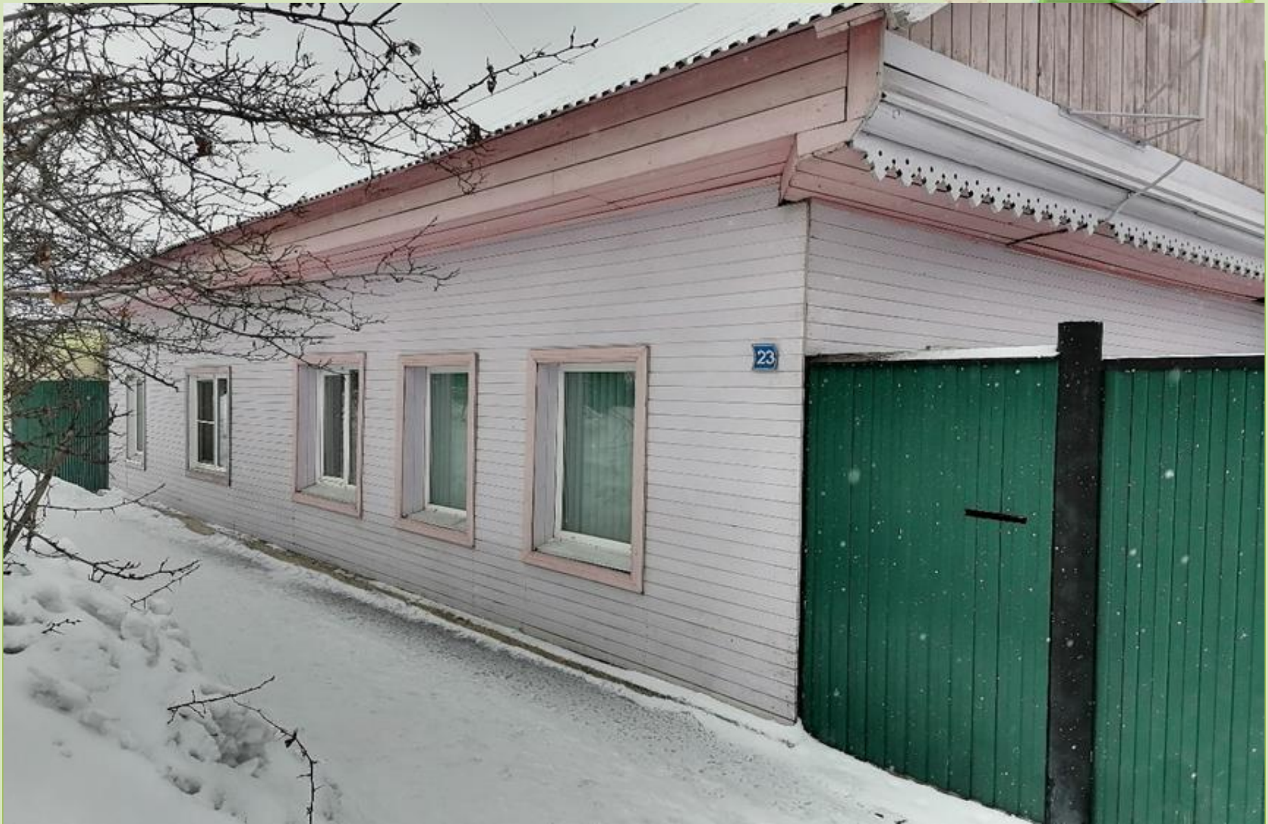
Дом 23. Жилой дом, начало 20 века.