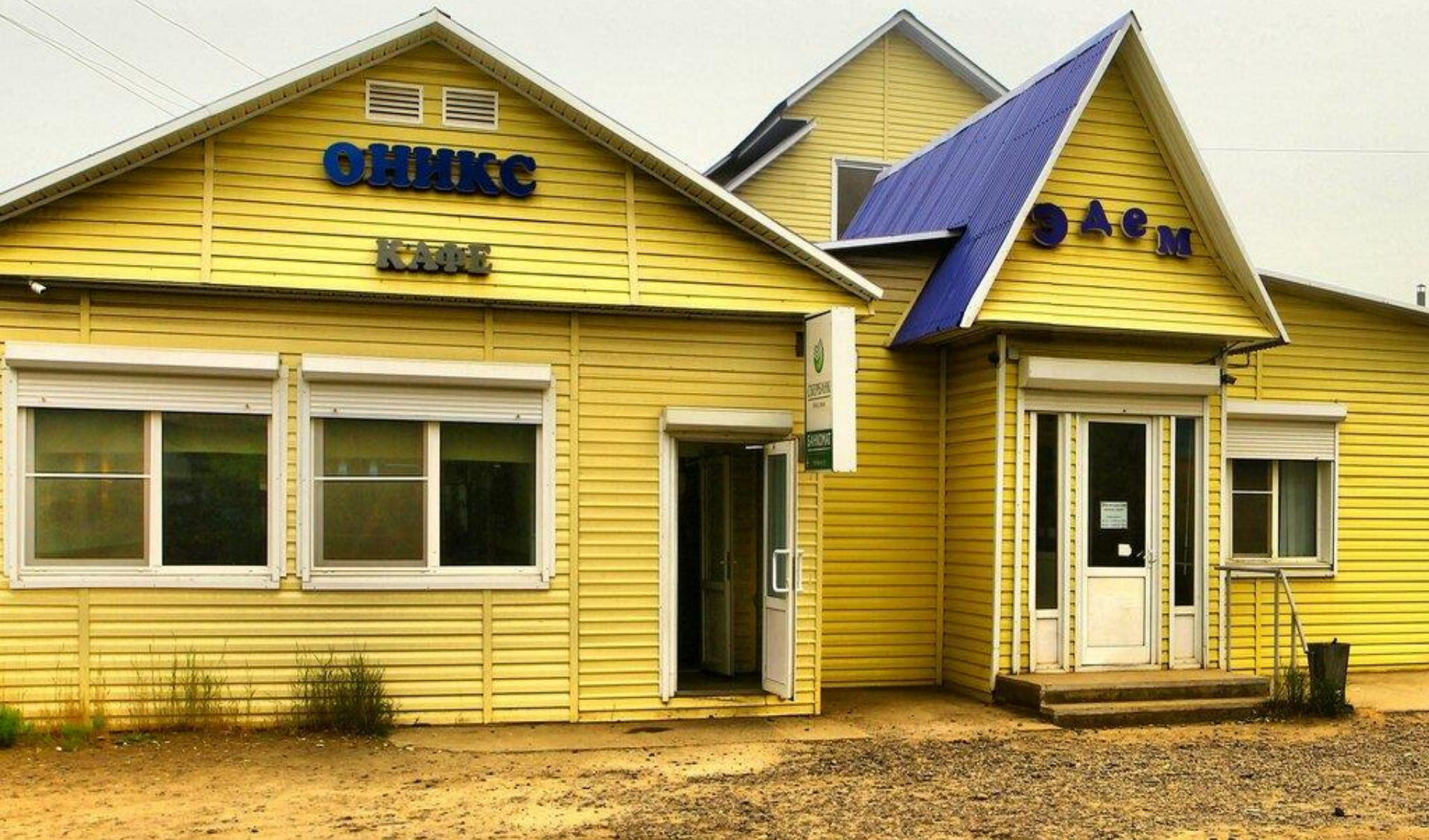
Мини- отель «Эдем»