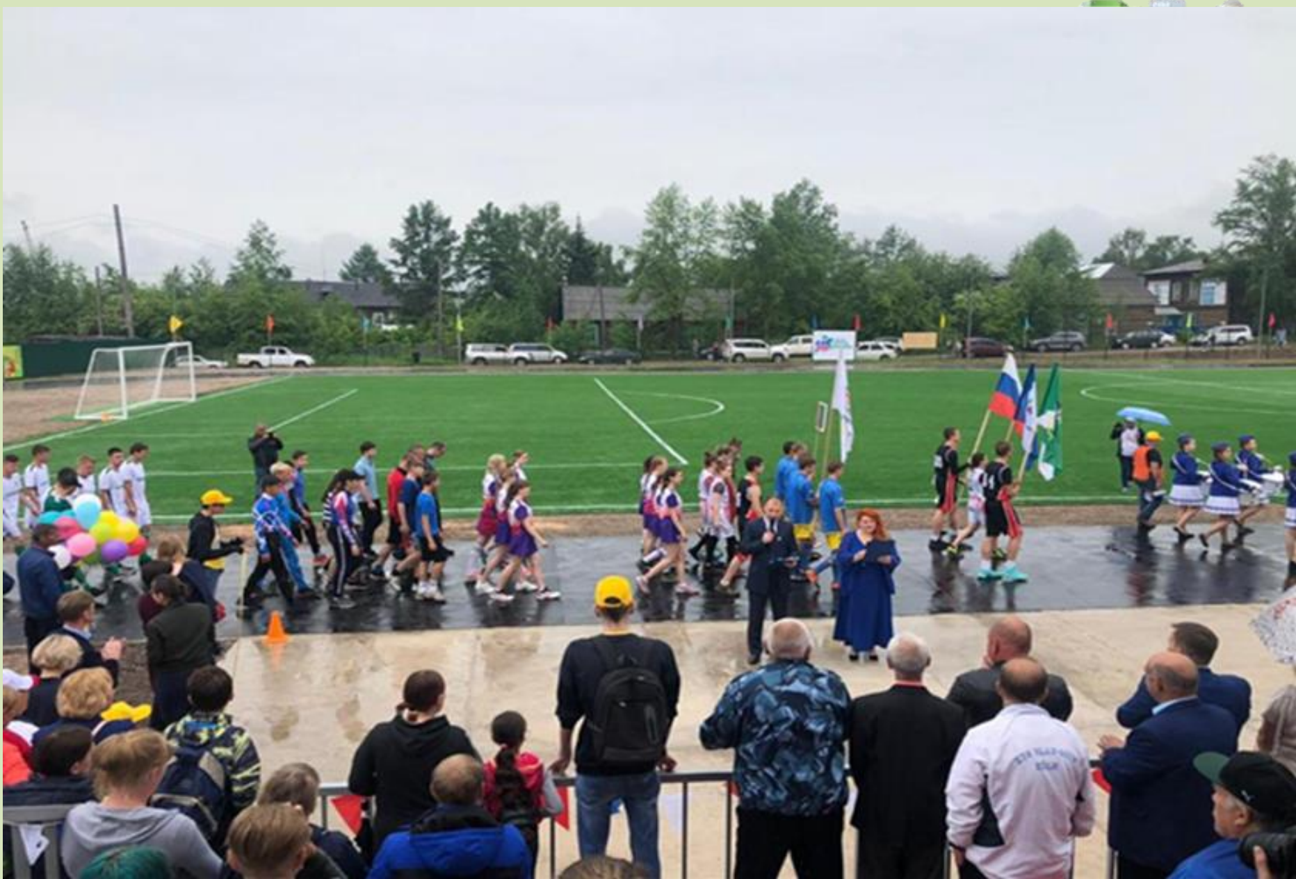
Открытие стадиона «Водник», 2019 г.