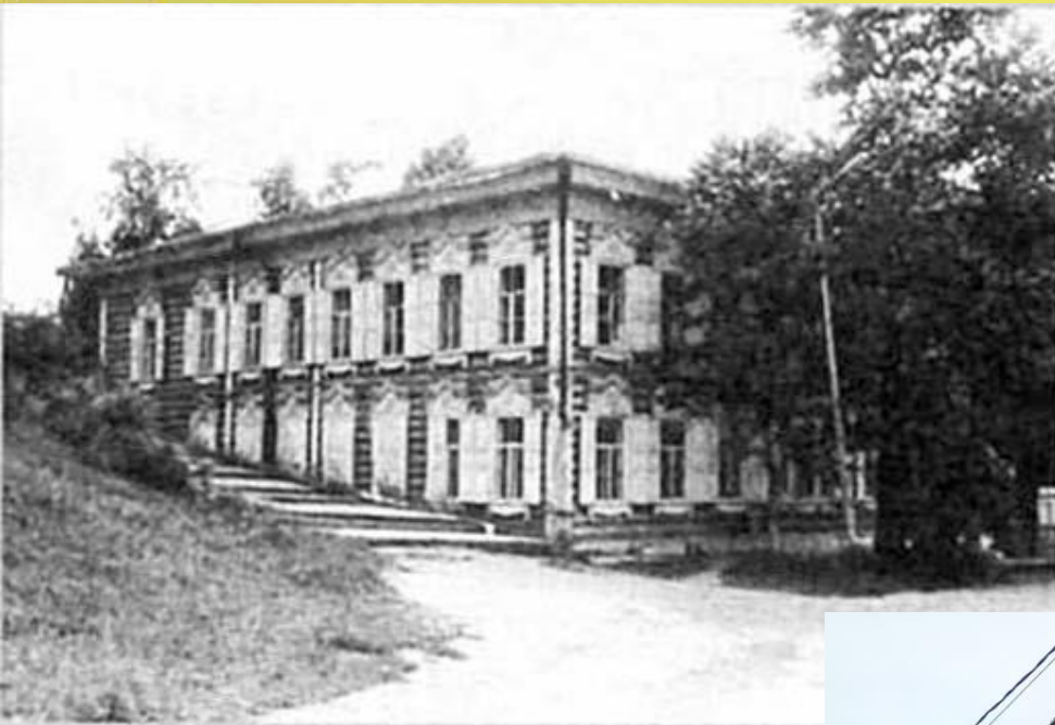
Доходный дом по ул. Ленских Рабочих, 31