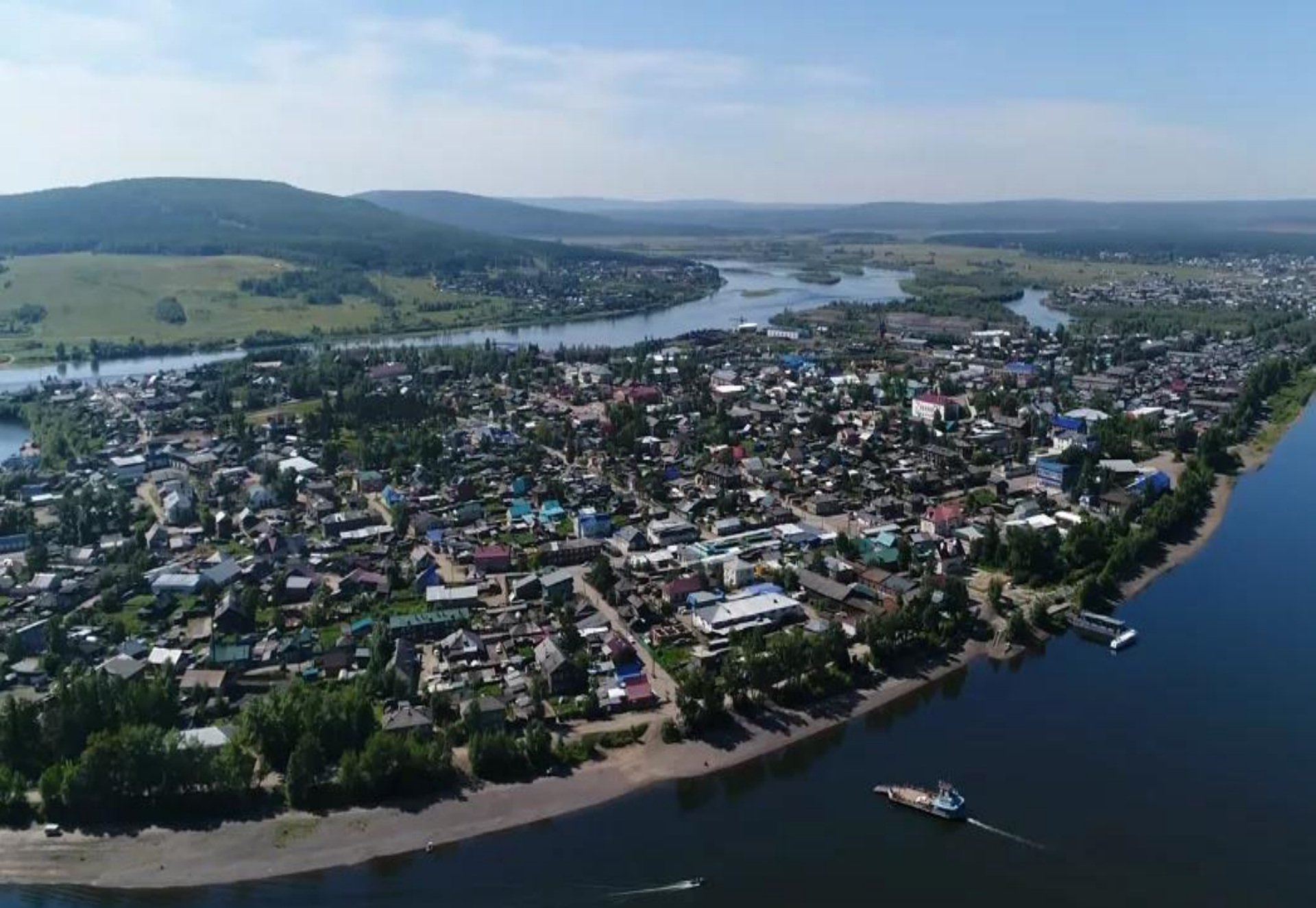
Киренск с высоты птичьего полета