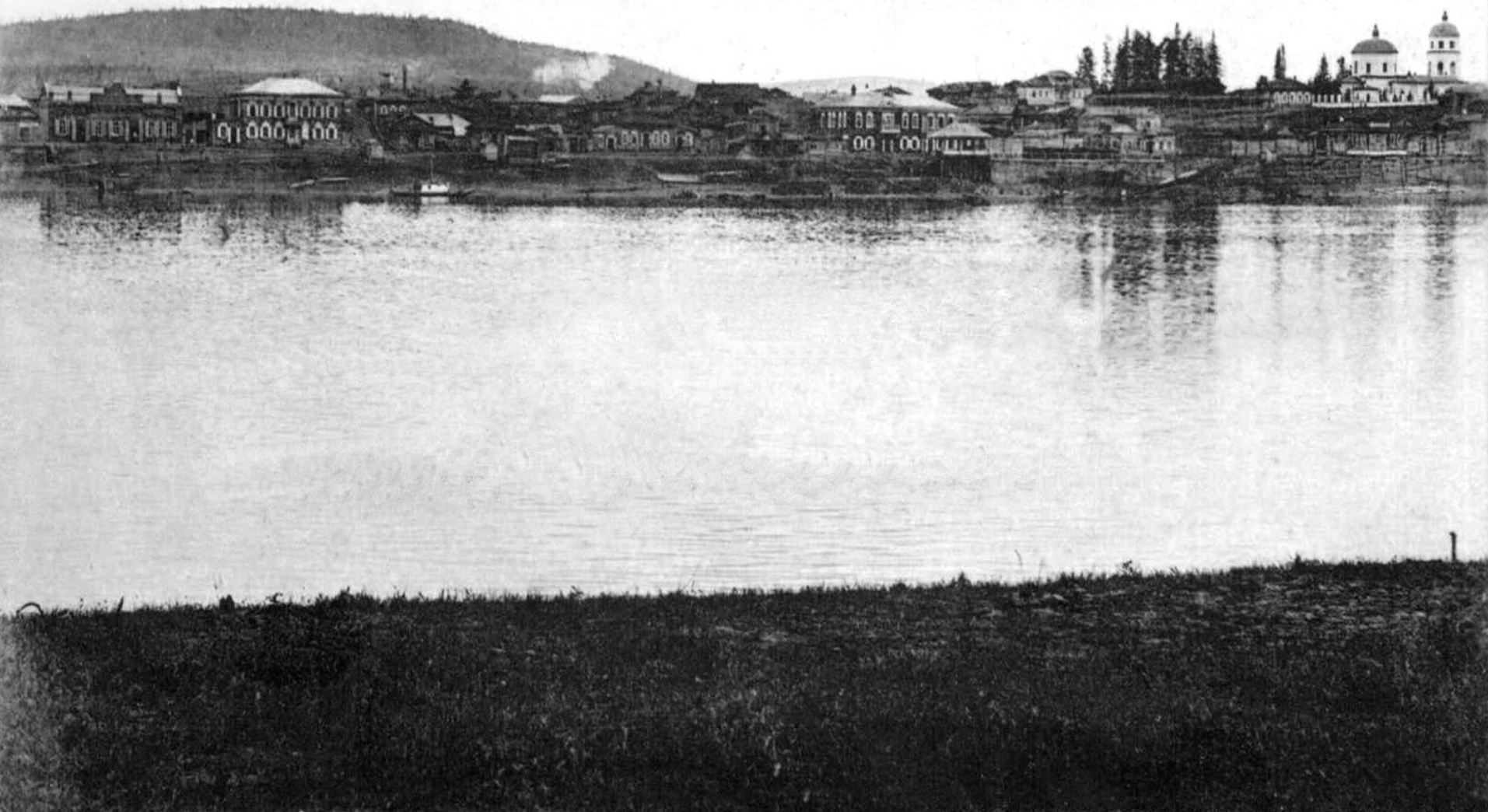
Г. Киренскъ Иркутск. губ. - Видъ Набережной р. Лены.