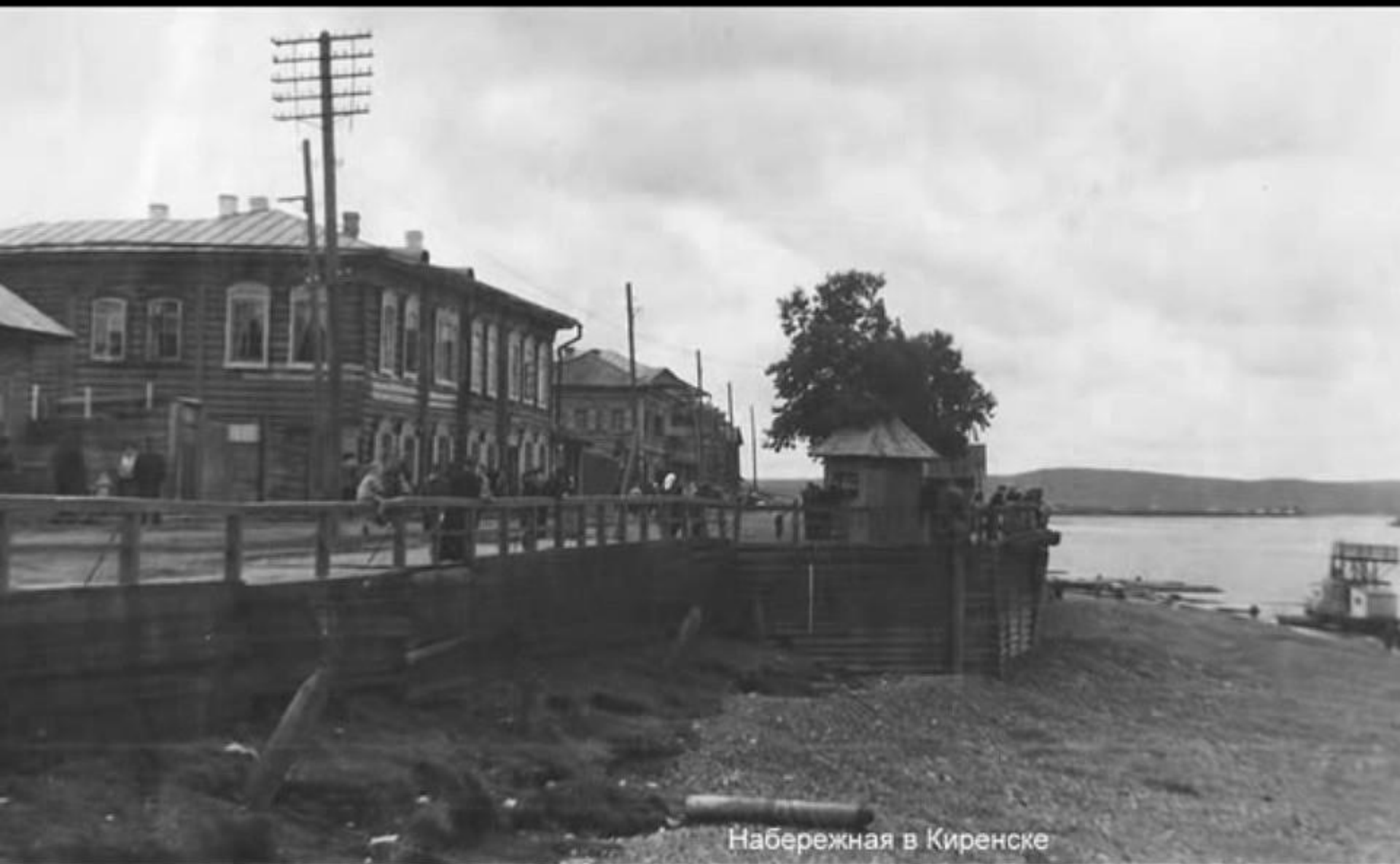
Набережная в Киренске