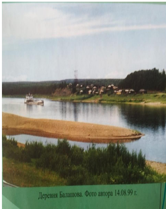
Деревня Балашова. 14.08.99 г.

посел. Бабо. 18. 4 га. в 18 году посели в школу в 20 году 27. 28. 29. 30. 31. 32. Бросила пятый класс операция 33. работала в колхозе 34. - " - " - 35. - " - " - 36. - " - " - в 37. пошла в 6 й класс в 38. окончила 7 кл. посели в деревне семье отца в 39. жила в гараже у Нины в 40. жила в колхозе в 41. жила в РК Райсо в 45. жила. в 60. пришла лесом и стала работала до 75 года 15 лет