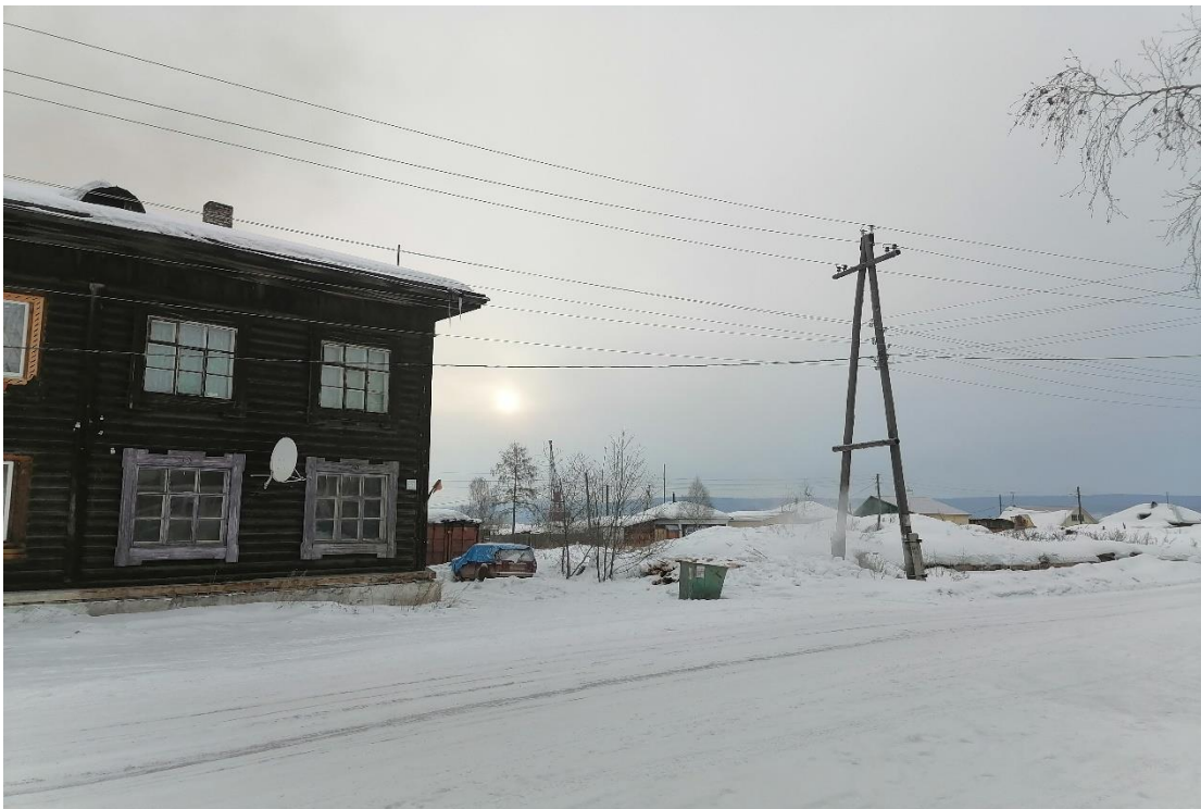
Фото 10. Фотография дома 33. Рядом пустырь, на котором ранее стояли дома 35, 37 Март, 2021 г.