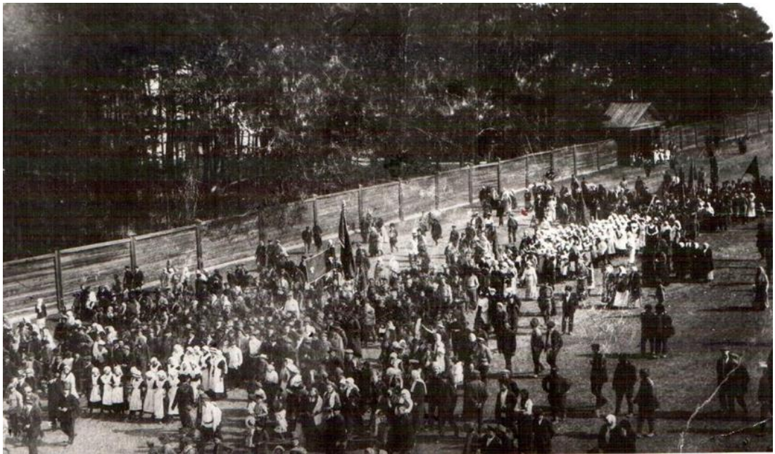
Фото 3. Первомайская демонстрация жителей Киренска на Троицкой улице. 1917 г.