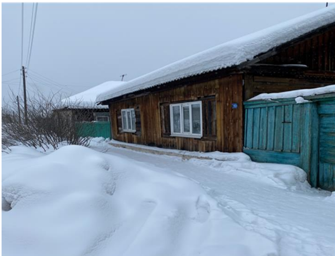
Фото 6. Во дворе этого дома в 1828 году была построена синагога. Февраль. 2021 г.