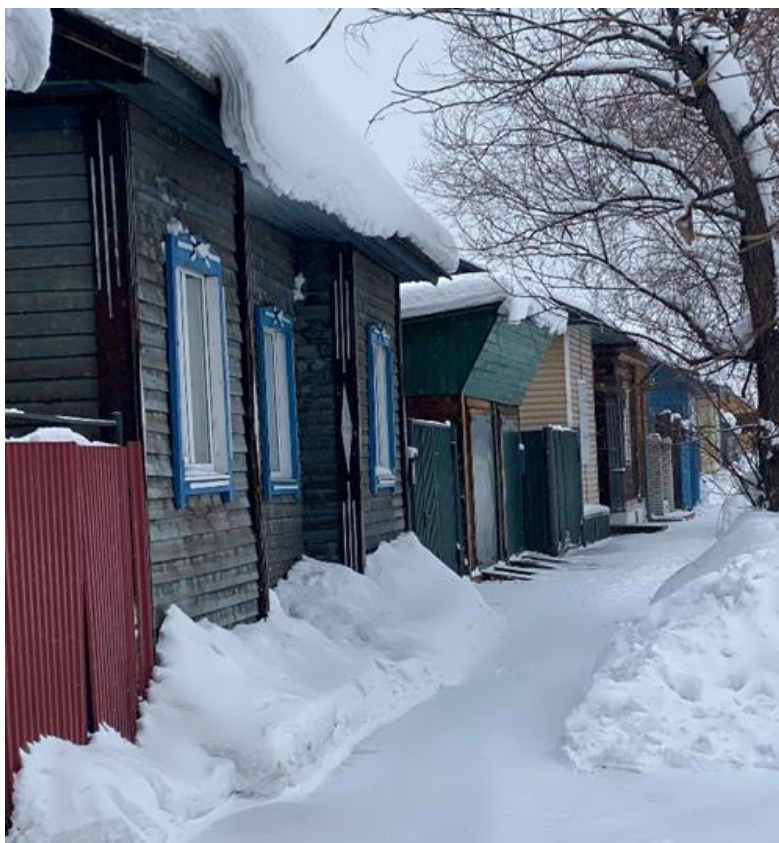
Фото 12. В 1930-40-ые годы прошлого столетия эти дома были построены для работников техучастка. Февраль, 2021 г.