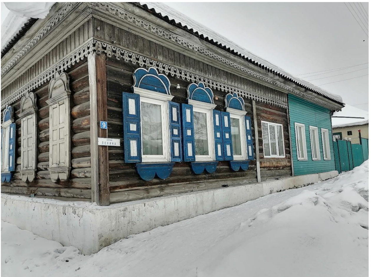
Фото 8. Фотография дома 9. Март, 2021 г.