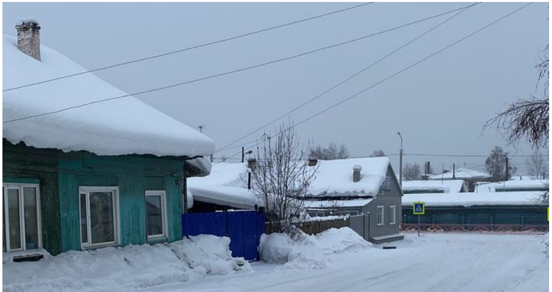
Фото 7. В 30-е годы во дворах этих домов были Курбатовские бани. Февраль.2021 г.