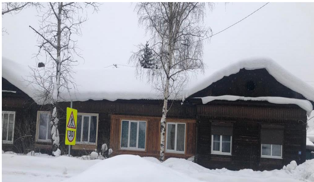
Фото 11. В 1930-40-ые годы прошлого столетия эти дома были построены для работников Киренской пристани. Февраль, 2021 г.