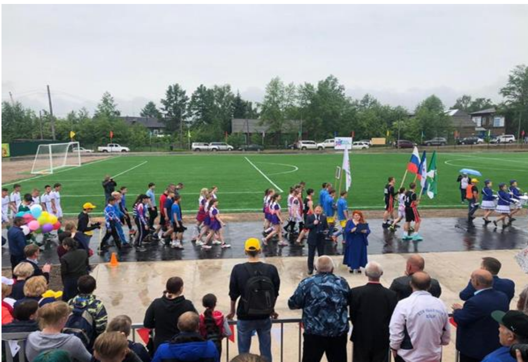
Фото 16. Открытие стадиона «Водник», 2019 г.