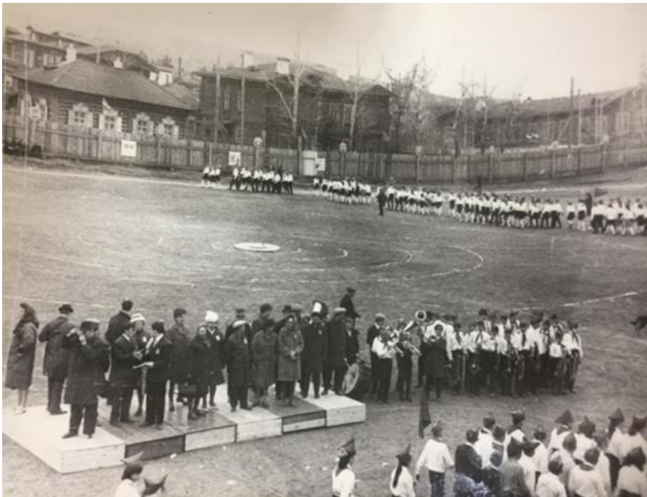
Фото 13. Празднование 50-летия пионерской организации на территории стадиона «Водник», 19 мая 1972 года.