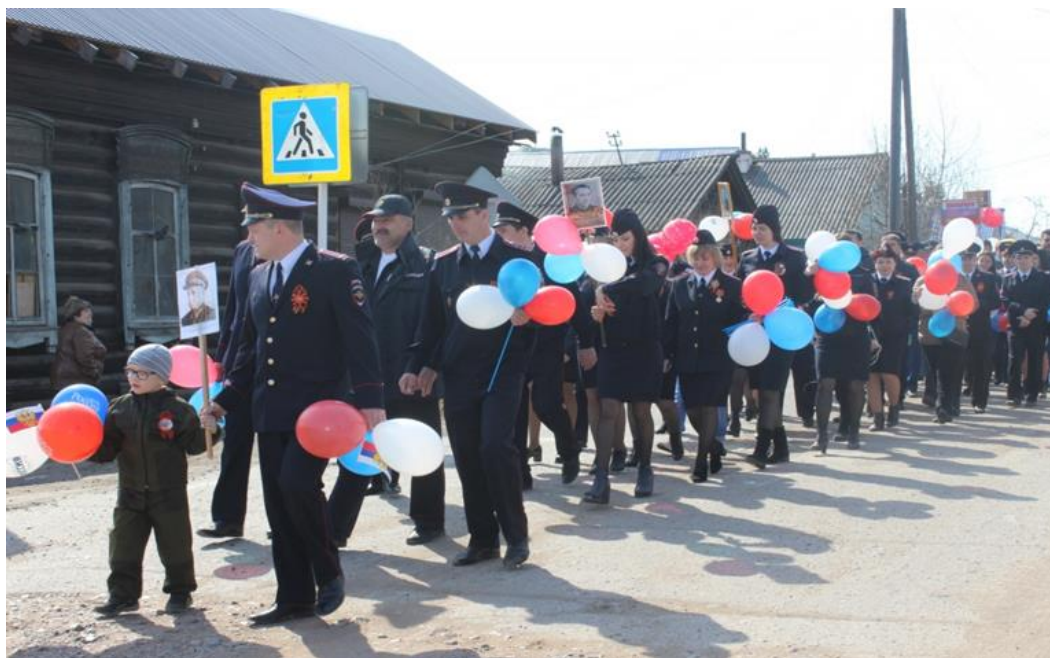
Фото 5. Я на праздничном шествии 9 мая по улице Ленина. 2013 г.