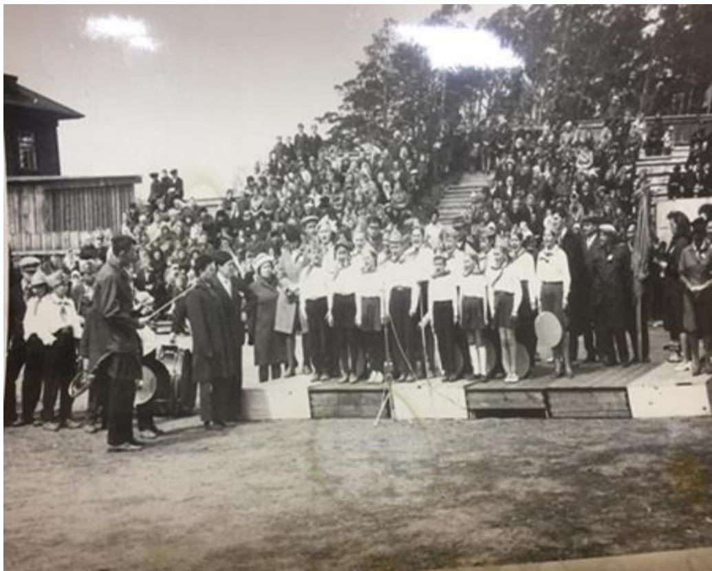
Фото 14. Празднование 50-летия пионерской организации на территории стадиона «Водник», 19 мая 1972 года.