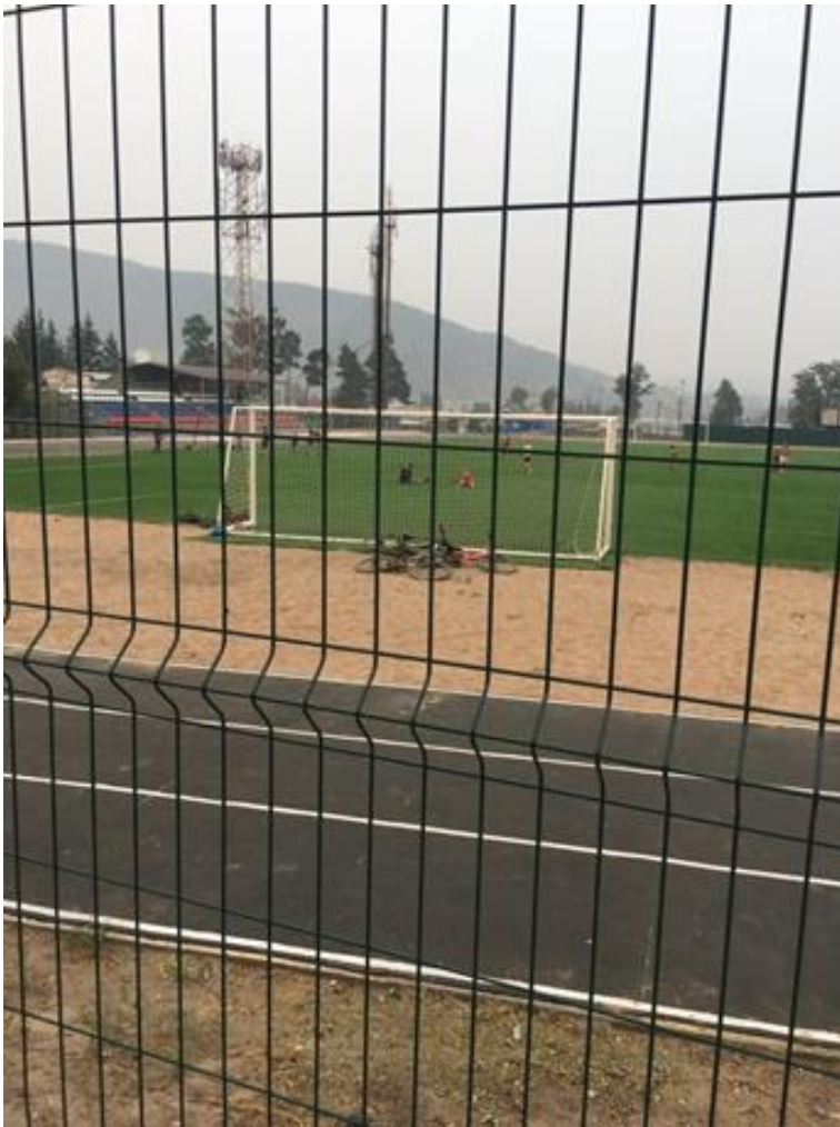
Фото 17. Новое покрытие на стадионе «Водник», 2020 г.