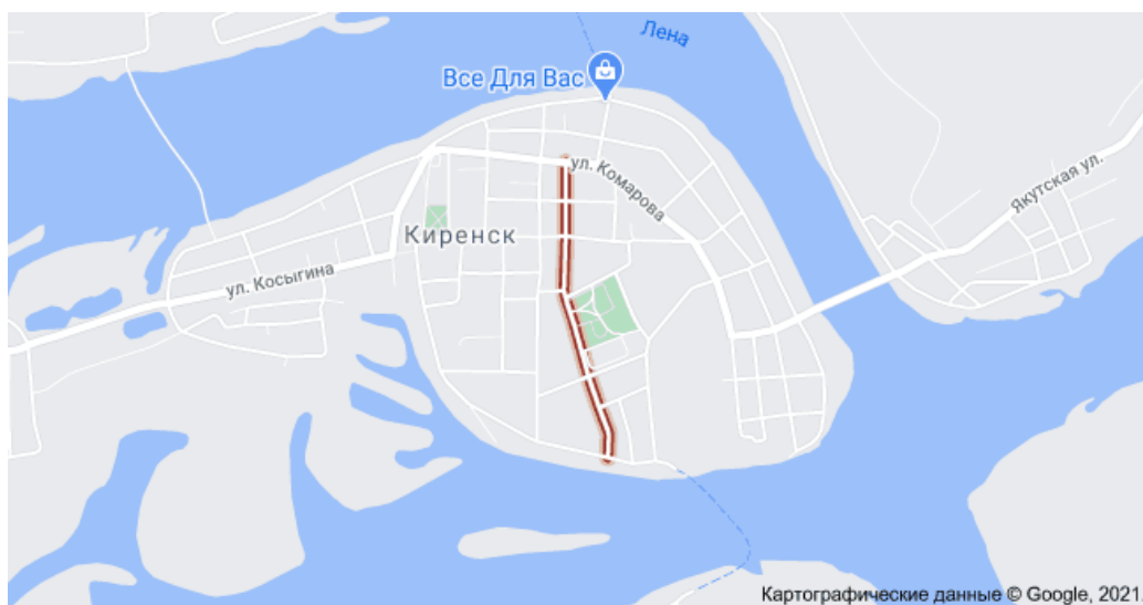
Рис.1. Карта города Киренска (выделена улица Ленина)

Сегодня улица Ленина – это улица протяженностью 850 метров, пройти которую можно пешком за 4 минут (1154 шага), а на автомобиле - за 2 минуты (рис.1) [6]: