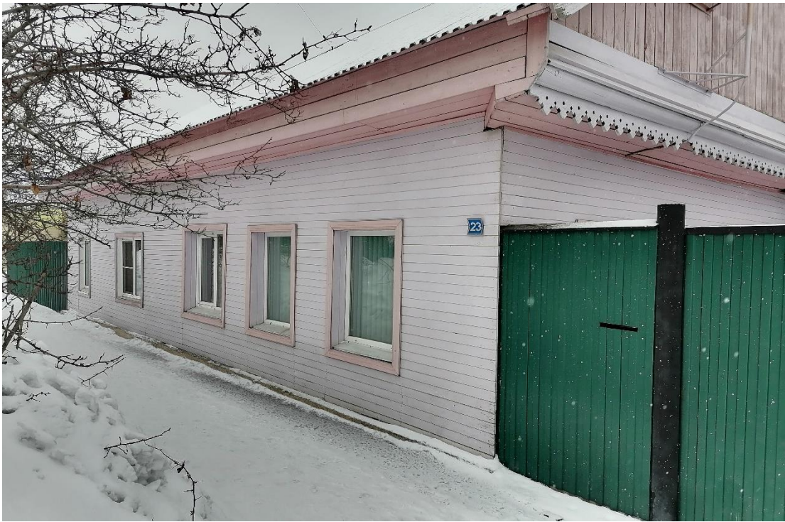
Фото 9. Фотография дома 23. Март, 2021 г.