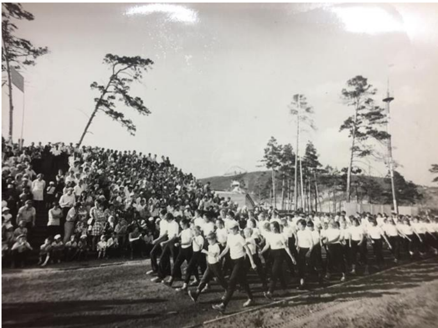
Фото 15. Шествие спортсменов на стадионе в честь 200-летнего юбилея города, 26 июня 1975 года.