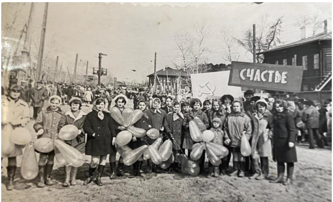
Фото 4. Первомайская демонстрация жителей Киренска на Ленина улице. 1973 г.