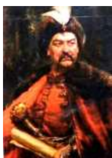
Гетман войска Запорожского Богдан Хмельницкий (1595-1657)