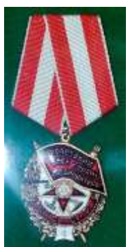
Орден Красного Знамени СССР, 20.04.1953г.