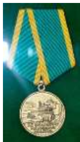
Медаль «За освоение целинных земель», 1964г.