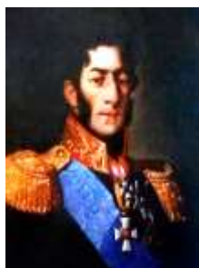
Российский генерал от инфантерии Багратион Петр Иванович (1765-1812)

До 1901 года школа стояла напротив нынешнего магазина «Ирина», по адресу улица Советская № 65. Дети учились в ней преимущественно богатых родителей. Школа была деревянная, почти не оборудованная. В 1901 году была построена церковь на месте спортивной площадки нынешней школы, в маленьком домике находилась дежурка. Напротив на площади построили школу. Школа была начальная. Уроки длились по 40 минут. В школе было два звонка: большой и маленький. Маленьким звонили на уроки, а большим в конце занятий. На уроках была палочная дисциплина. Если не выучил урок или нарушил дисциплину, то учитель бил линейкой или ставил в угол. Каждую субботу все учащиеся должны были идти в церковь. Тот, кто не пойдет - сурово наказывался.