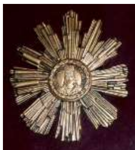
Орден Тудора Владимиреску II ст.