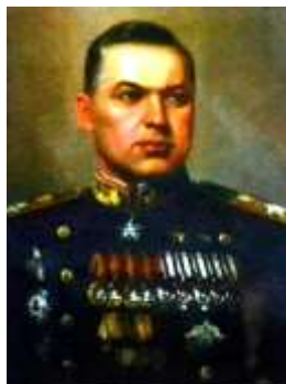
Генерал армии Антонов Алексей Иннокентьевич (1896-1962)