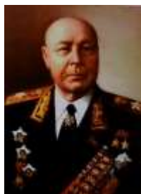
Маршал Советского Союза Тимошенко Семен Константинович (1895-1970)