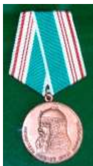
Медаль «В память 800-летия Москвы», 1951г.