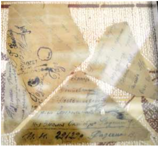
письма с фронта