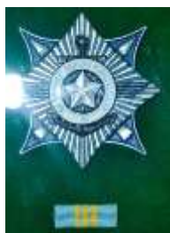
Орден «За службу Родине в Вооруженных силах СССР», 1975г.