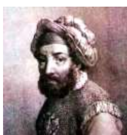
Казачий атаман, завоеватель Сибири Ермак Тимофеевич (1531-1585)