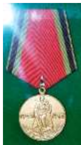
Медаль «Двадцать лет Победы в Великой Отечественной войне 1941-1945гг», 1965г.