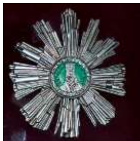
Орден Тудора Владимиреску III ст.