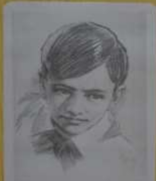
Валентин Котик Пилот-герой, юный партизан-диверсант замкий мотодол Гвард Советского Союза. На момент гибели ему было 14 лет. Звание Героя Советского Союза присвоено посмертно.

Валентин Котик — это один из талантливых сыновей нашей страны, который в годы Великой Отечественной войны проявил героические подвиги, за что ему было присвоено звание Героя Советского Союза.