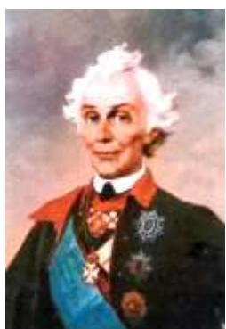
Генералиссимус Суворов Александр Васильевич (1730-1800)