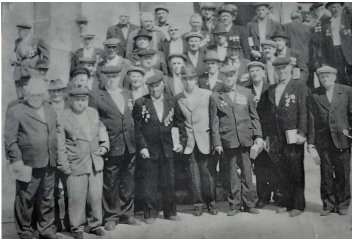
Ветераны-участники Великой Отечественной войны –жители с.Генеральское

Никто не забыт – ничто не забыто. Памятники с. Генеральское.