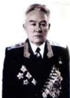
Главнокомандующий ВВС СССР Вершинин Константин Андреевич (1900-1973)