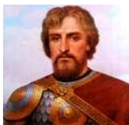
Русский полководец Невский Александр Ярославич (1221-1263)