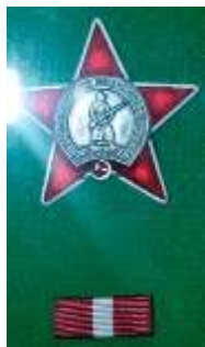
Орден Красной Звезды, 1947г.