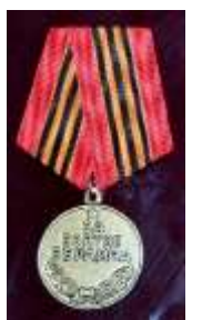
Медаль «За взятие Берлина»