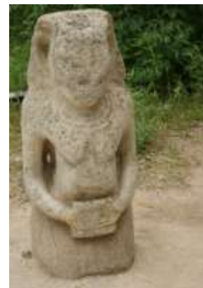
Статуя половецкого старшины