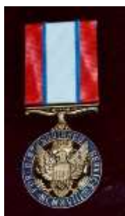
Медаль за отличную службу (США)