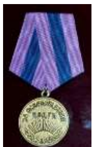
Медаль « За освобождение Праги» 09.06.1945г.