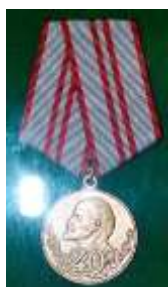
Медаль «40 лет Вооружённых сил СССР», 1957г.