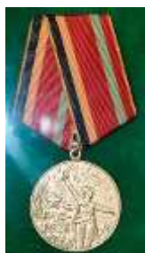
Медаль «Тридцать лет Победы в Великой Отечественной войне 1941-1945гг», 1975г.