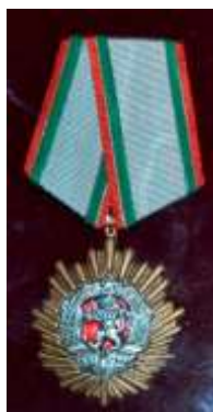
Орден Народной Республики Болгарии I ст.