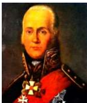
Русский флотоводец, адмирал Ушаков Федор Федорович (1745-1817)