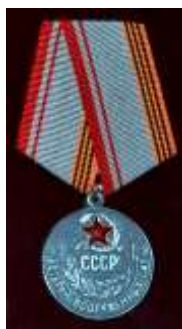
Медаль «Ветеран Вооруженных Сил СССР» 30.04.1984г.