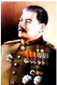
Генералиссимус Советского Союза Сталин Иосиф Виссарионович (1879-1953)