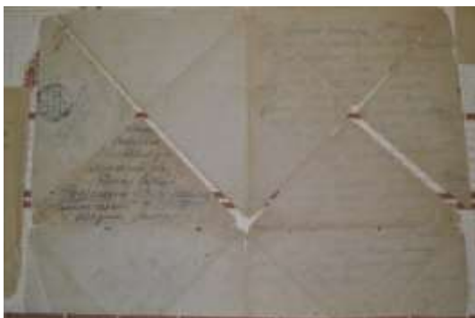
письма с фронта