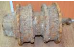
каток колеса тяжелого танка