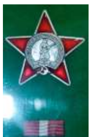
Орден Красной Звезды, 1955г.