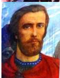
Великий князь Владимирский Донской Дмитрий Иванович (1350-1389)