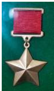
Медаль Золотая Звезда