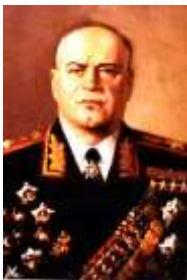
Маршал Советского Союза Жуков Георгий Константинович (1896-1974)