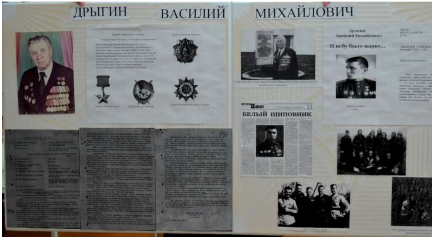
Стенд, посвященный участнику боев за освобождение Родионово-Несветайского района от немецко-фашистских захватчиков.