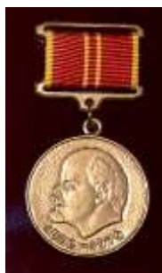
Медаль «За военную доблесть» 20.04.1970г.