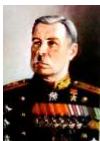
Маршал Советского Союза Говоров Леонид Александрович (1897-1955)