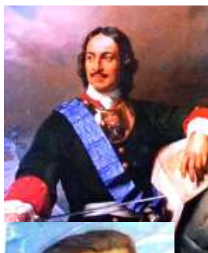
Первый Император Всероссийский Петр I (1672-1725)