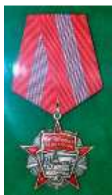
Орден «Октябрьской Революции», 1973г.