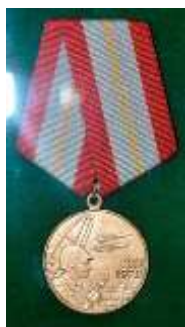
Медаль «60 лет Вооружённых сил СССР», 1978г.