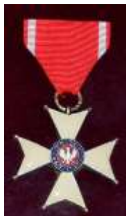
Орден возрождения Польши