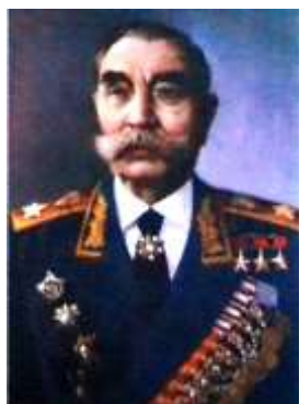
Маршал Советского Союза Будённый Семён Михайлович (1883-1973)