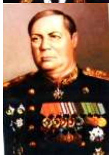
Маршал Советского Союза Толбухин Федор Иванович