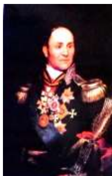
Атаман Донского казачьего войска Платов Матвей Иванович (1751-1818)