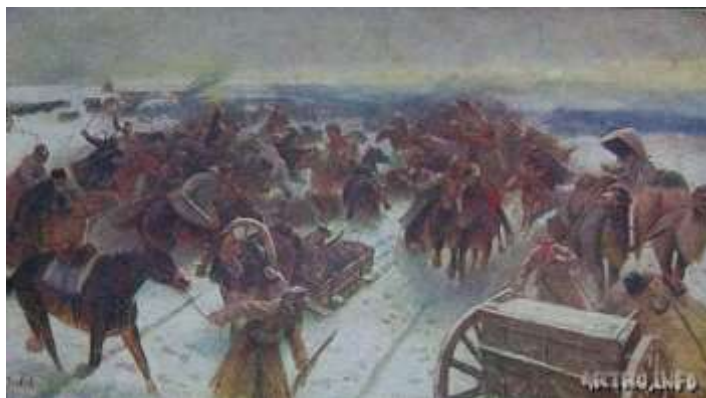
Картина «Бой за Ростов у села Генеральский мост»

С самого начала работы над картиной и особенно при углубленном исследовании боевых операций, решивших судьбу Ростова, Грекову были хорошо известны героические подвиги и рядовых бойцов и командиров Первой Конной Армии. Воля и мужество, проявленные Ворошиловым и Буденным в стратегически смелом по замыслу и отважном по осуществлению ударе, нанесённом врагу у Генеральского Моста.