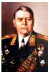
Маршал Советского Союза Василевский Александр Михайлович (1895-1977)