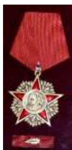
Орден Карла Маркса ГДР