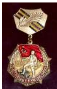
Знак 25 лет Победы в ВОВ 1941-1945г