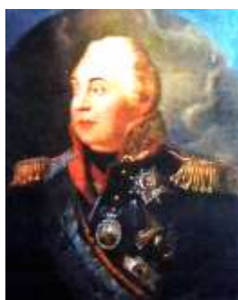
Генерал-фельдмаршал Кутузов Михаил Илларионович (1745-1813)