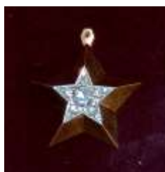
Маршальская звезда (малая)