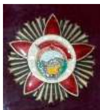
Орден боевого красного знамени (Монголия)