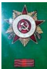
Орден Отечественной войны 1-й степени, 1985г.