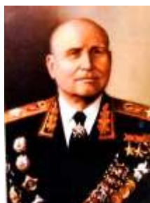
Маршал Советского Союза Конев Иван Степанович (1897-1973)