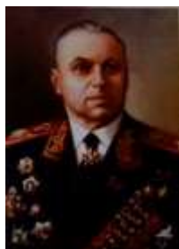
Маршал Советского Союза Рокоссовский Константин Константинович