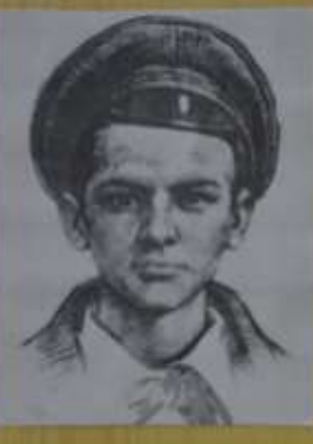
Павлик Морозов — герой войны, участник обороны Ленинграда.

Павлик Морозов родился в семье рабочего в городе Ленинграде. С детства он проявлял интерес к технике и авиации. В 1941 году он поступил в школу пилотов. В 1942 году Павлик Морозов был направлен в действующую армию в качестве пилота. Он проявил себя в боях за Ленинград и в небе над Финляндией. В 1943 году Павлик Морозов был награжден орденом Героя Советского Союза за мужество и героизм, проявленные в борьбе с немецкими захватчиками.