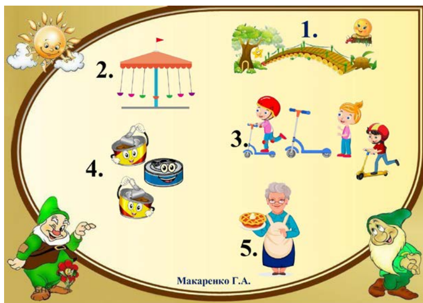
Рисунок. Карта-письмо от гномов для участников путешествия по маршруту

При организации терренкура учитываются индивидуальные особенности детей: функциональное состояние сердечно-сосудистой системы, возраст, соотношение массы тела и роста, степень работоспособности. Прогулки по терренкуру проводятся регулярно, в нежаркое время суток. Массовые терренкуры организуются 3–4 раза в месяц и соединяются с празд-