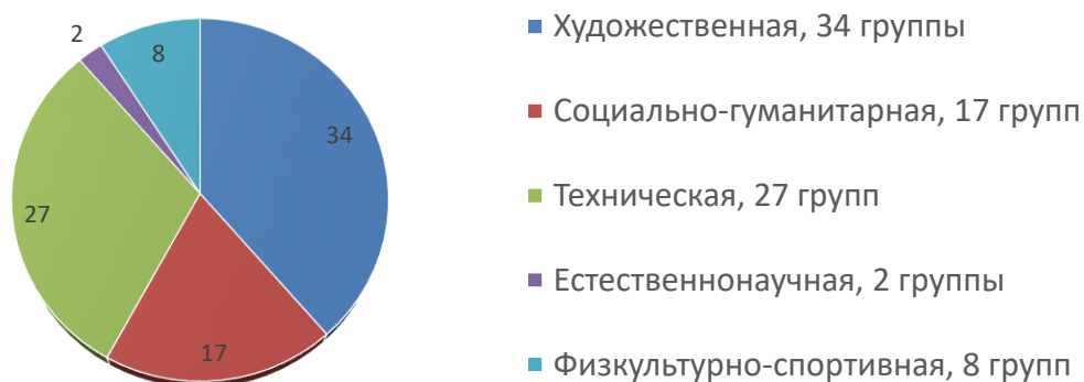
Направленности УДЮЦ 2025 год:

Реализовалось 69 программ дополнительного образования, которые обновлены по новым требованиям, предъявляемым к ДООП, 20 программ прошли региональную экспертизу НОКО, представлены разные виды программ: 7 сетевых программ, 1 дистанционная, 5 разноуровневых, 2 адаптированных.