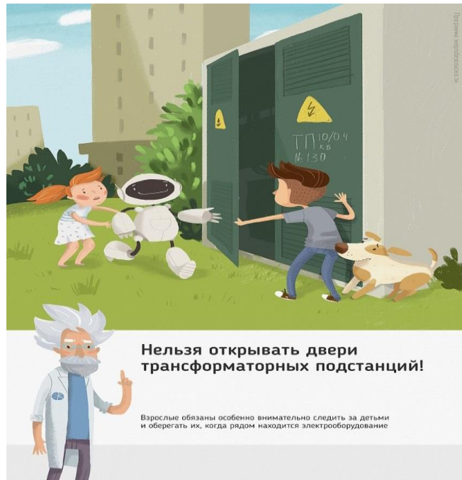
Рис.1 Нельзя открывать двери трансформаторных подстанций

Ежегодно энергетики проводят для школьников познавательные уроки, конкурсы рисунков и историй на тему электричества и правильного с ним обращения. Но работы одних энергетиков в данном направлении недостаточно, для полного понимания проблем электробезопасности нужен пример общества, в котором растет ребенок, и, конечно же, главным образом родителей. Эта работа приносит свои результаты: электротравмы на энергетических объектах единичные, и каждый случай становится поводом для служебной проверки. Но только технических мер мало для того, чтобы полностью обезопасить детей. Им нужен пример родителей.