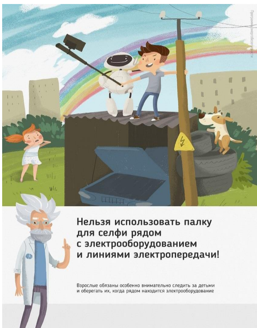
Рис 2. Нельзя использовать палку для селфи рядом с электрооборудованием и линиями электропередачи

Ну и, наконец, нужно повторить с ребенком алгоритм действий в экстремальной ситуации. Проверьте, умеет ли он набирать на сотовом телефоне телефон экстренных служб. Изучите с ним вещества и предметы, которые хорошо проводят электрический ток и потому особенно опасны, и, наоборот, вещества и предметы, плохо проводящие электрический ток и полезные в экстремальной ситуации.