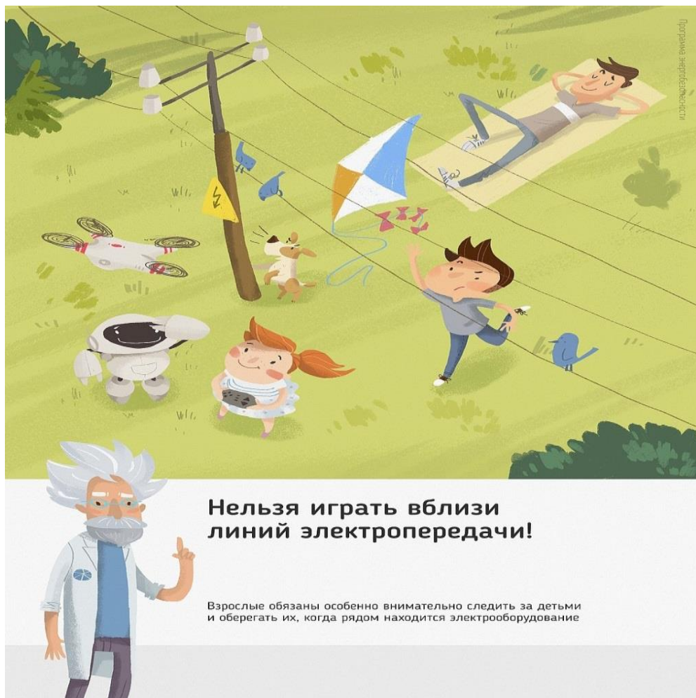
Рис.3 Нельзя играть вблизи линий электропередачи