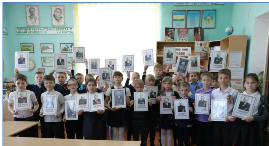
Библиотечный урок о Героях Кубани «Боевое имя Кубани», 29.04.2022г.