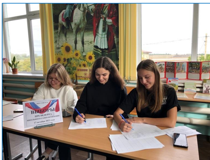
Выборы лидера ШУС