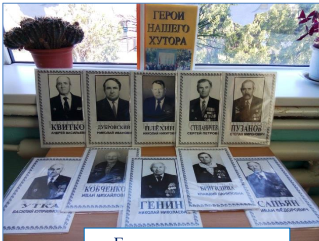
Герои нашего хутора