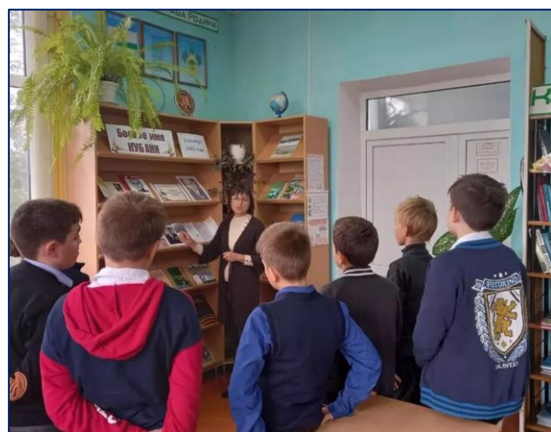
«Боевое имя Кубани» Обзор книжной выставки для 5-7 классов