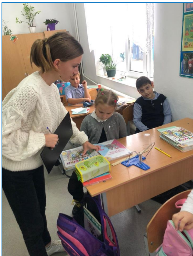
Рейд по проверке сохранности учебников