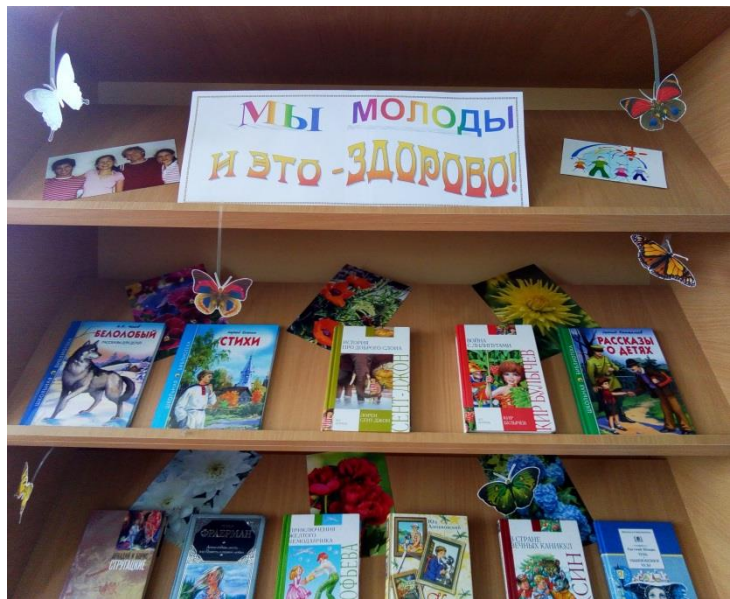
Выставка ко Дню молодёжи Инновационный приём: бабочки