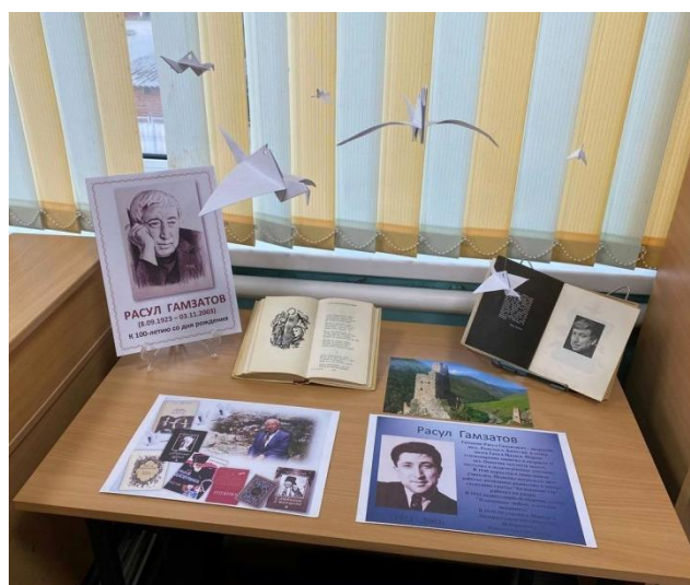
Выставка к юбилею Р.Гамзатова Инновационный приём: журавлики из бумаги