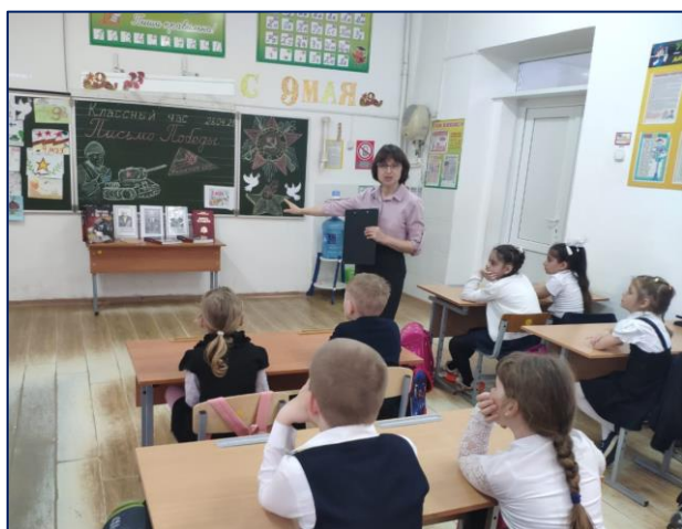
«Письма Победы» Информационный час для 1-4 классов

В преддверии праздника Дня Победы в 1-9 классах школы проводились информационные часы «Письма Победы», рассказывающие о трёхтомнике Т.А. Василевской «Письма с фронта».