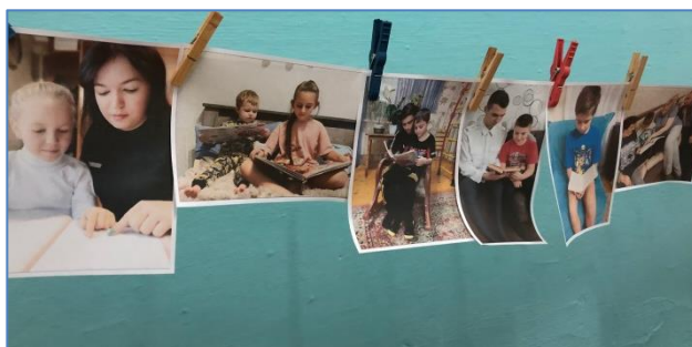
Фотогалерея конкурса «Читаем всей семьёй»

В рамках месячника актив школы, состоящий из учениц 10 класса, провёл рейды в 1-10 классах по проверке сохранности учебников. Десятиклассницы взяли на контроль нерадивых учеников и после каникул решили провести повторные рейды.