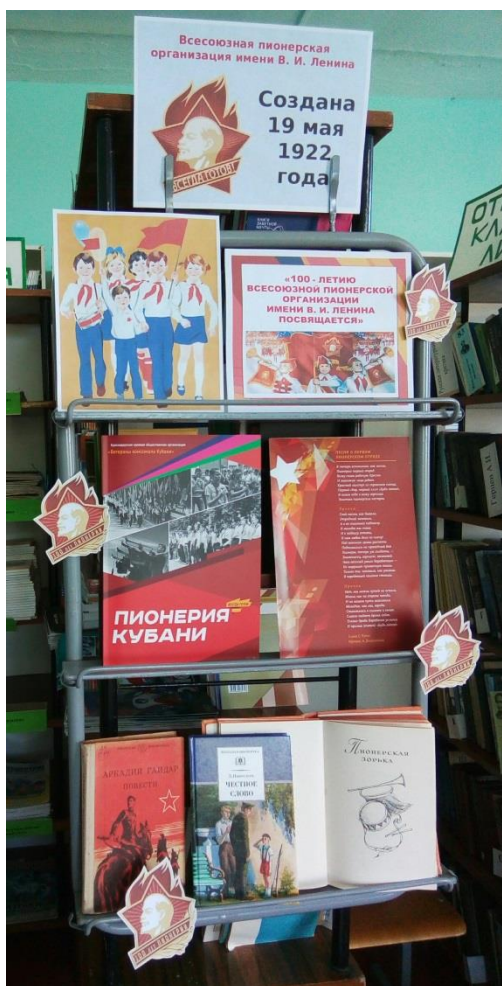
Выставка к 100-летию пионерской организации Инновационный приём: пионерские значки

Сегодня для того, чтобы дети и подростки читали, необходимо прикладывать гораздо больше усилий, чем раньше, и эти сложные задачи библиотека решает в тесном сотрудничестве с классными руководителями, учителями школы и родителями. Кроме рекомендательных списков, информационных сообщений о новинках литературы немаловажной формой пропаганды книги и чтения была и остаётся книжная ВЫСТАВКА. В нашей библиотеке оформление выставки превращается в творческий процесс. Различные формы, инновационные находки не только привлекают внимание, но и активизируют познавательную деятельность читателей, способствуют повышению уровня восприятия, вызывая всплеск эмоций. Возможности таких выставок огромны для развития творческих способностей наших читателей. Работа над выставками с инновационными моментами становится интересной и для библиотекаря и для учащихся.