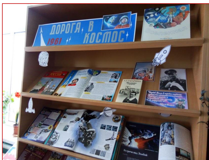
Выставка ко Дню космонавтики Инновационный приём: ракеты, планеты и пр.