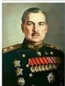
ГОВОРОВ Леонид Александрович