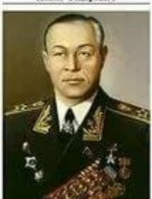
КУЗНЕЦОВ Николай Герасимович