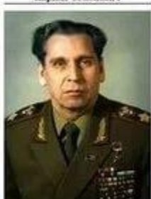
ОГАРКОВ Николай Васильевич