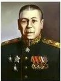
ШАПОШНИКОВ Борис Михайлович