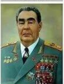
БРЕЖНЕВ Леонид Ильич