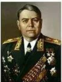
ВАСИЛЬВСКИЙ Александр Михайлович