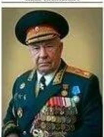
ЯЗОВ Дмитрий Тимофеевич