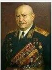
БАЙБАКОВ Николай Христофорович