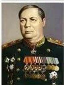
ТОЛБУХИН Фёдор Иванович