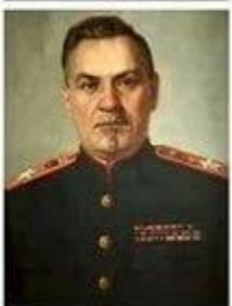
БУЛГАНИН Николай Александрович