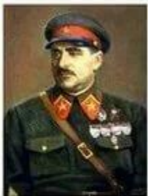
БЛЮХЕР Василий Константинович