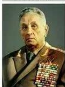
ГРЕЧКО Андрей Антонович