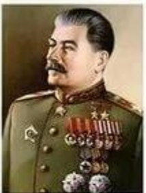
СТАЛИН Иосиф Виссарионович