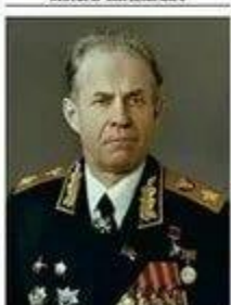
АХРОМЕЕВ Сергей Фёдорович