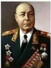
ТИМОШЕНКО Семён Константинович