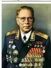
УСТИНОВ Дмитрий Фёдорович