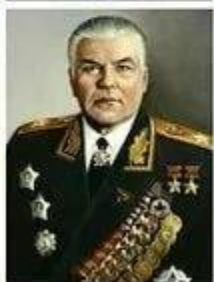
МАЛИНОВСКИЙ Родion Яковлевич