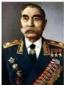
БУДЁННЫЙ Семён Михайлович