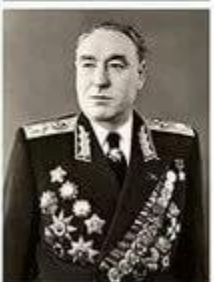
БИРЮЗОВ Сергей Серафимович