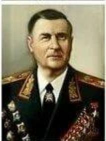
СОКОЛОВСКИЙ Василий Давыдович