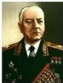
ВОРОШИЛОВ Климент Фёдорович