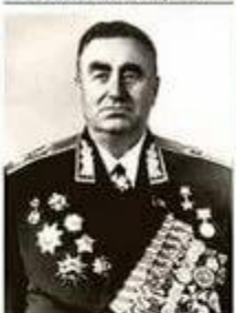
БАТИЦКИЙ Павел Фёдорович