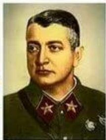
ТУХАЧЕВСКИЙ Михаил Николаевич