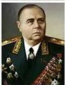
МЕРЕЦКОВ Кирилл Фёдорович