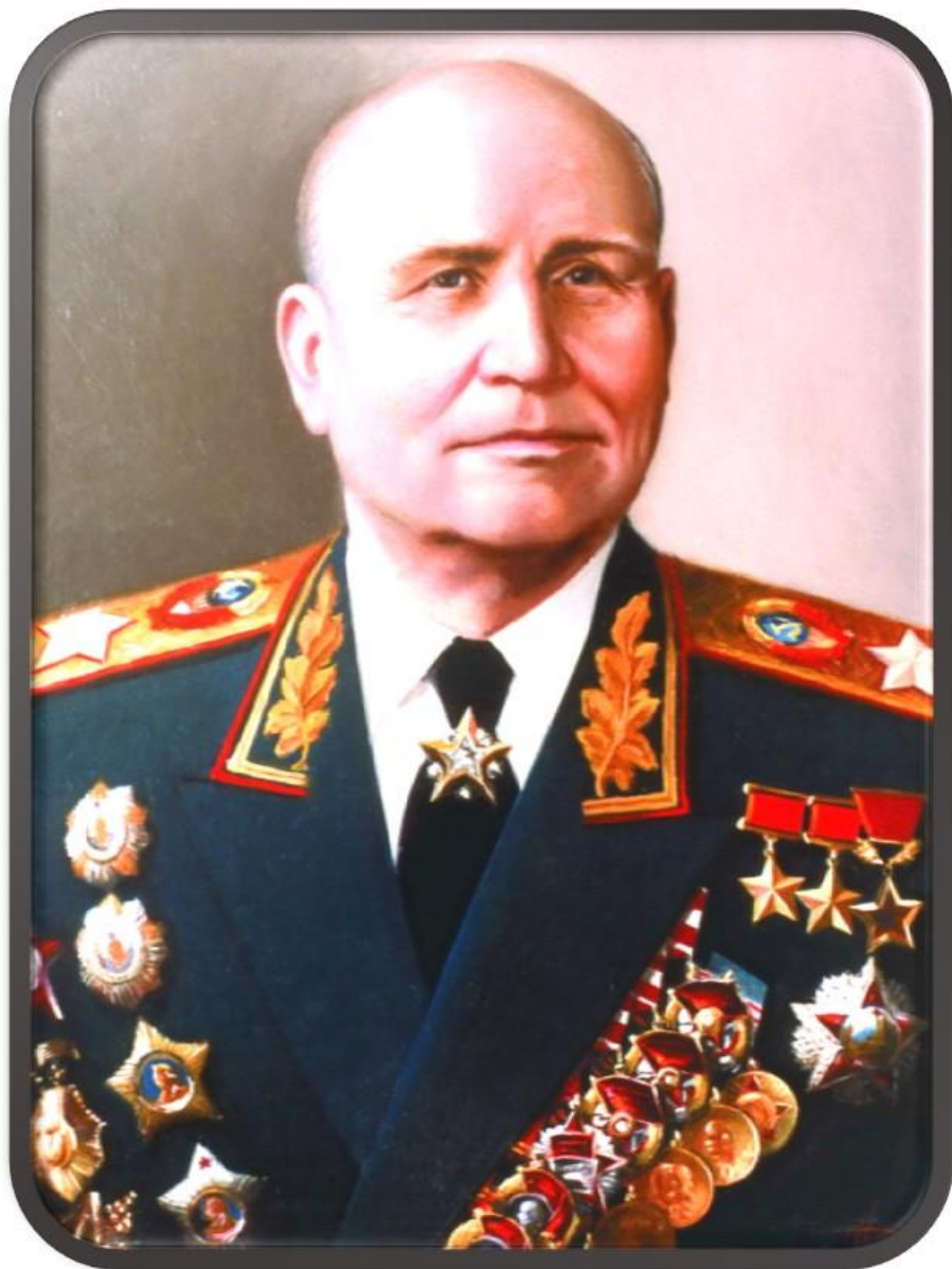
КОНЕВ ИВАН СТЕПАОВИЧ