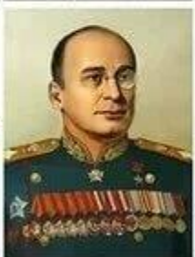
БЕРИЯ Лаврентий Павлович