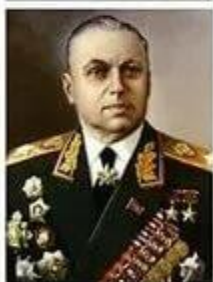
РОКОССОВСКИЙ Константин Константинович