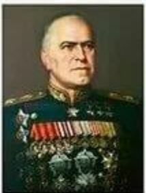
ЖУКОВ Георгий Константинович