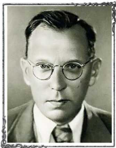
ПАВЛЕНКО ПЕТР АНДРЕЕВИЧ (1899—1951)

Есть писатели, которые интересны и значительны не только творчеством, но и всей жизнью. Таким был яркий представитель литературы социалистического реализма ПЕТР АНДРЕЕВИЧ ПАВЛЕНКО.