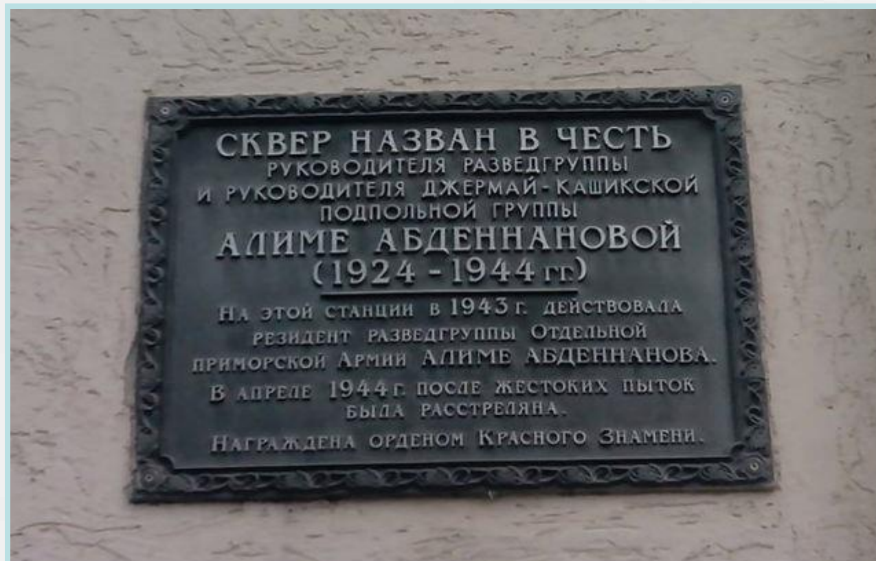
Эта памятная доска находится на здании вокзала в поселке Ленино.