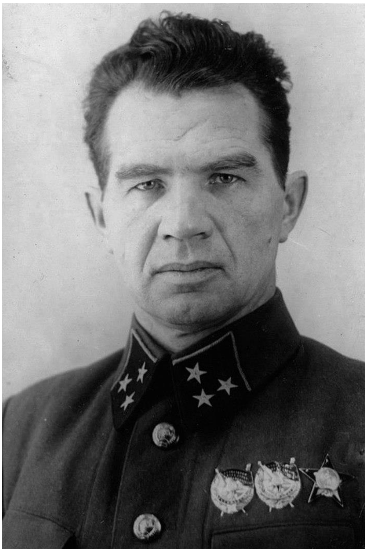
Василий Иванович Чуйков