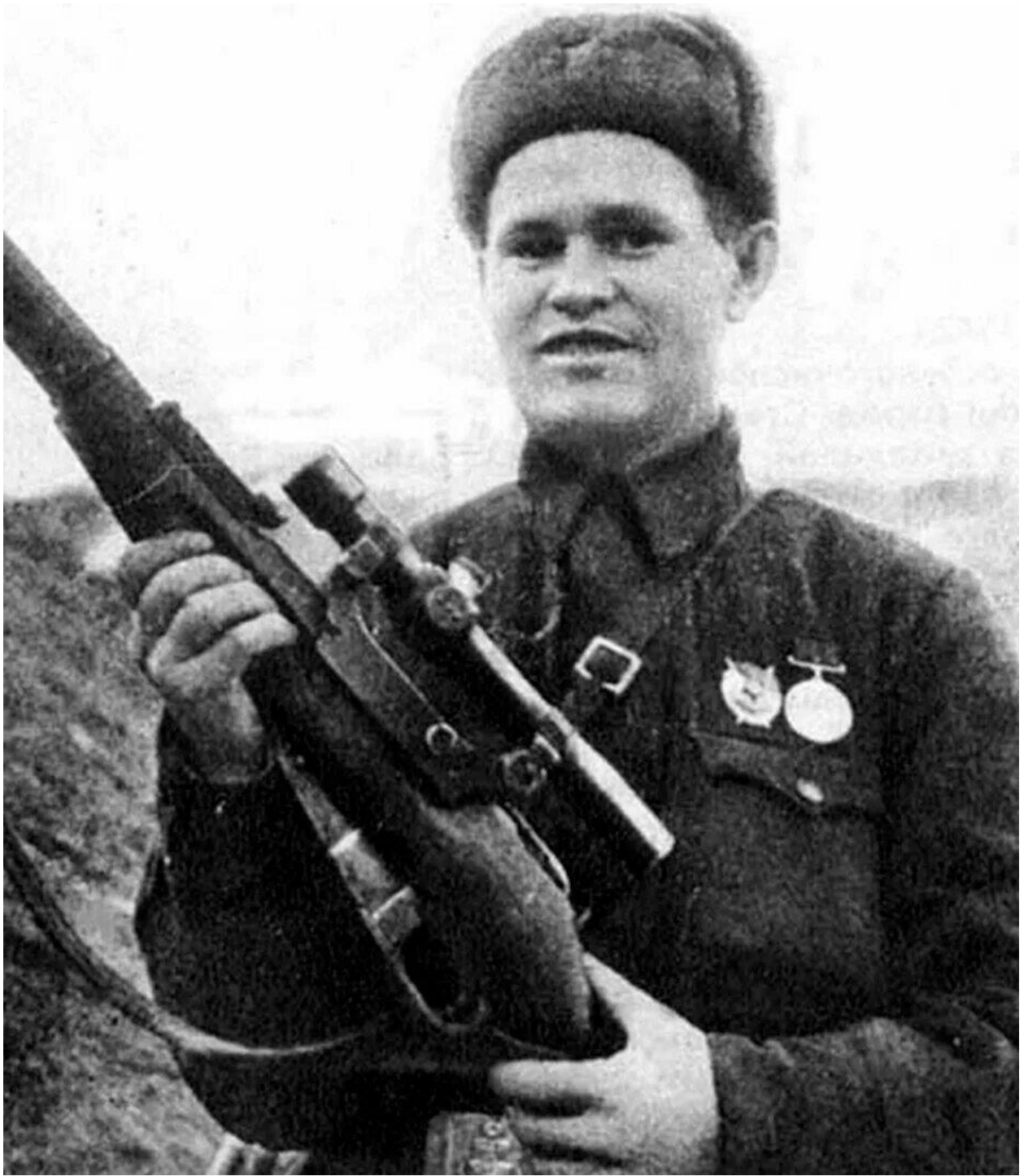
Снайпер Василий Зайцев.