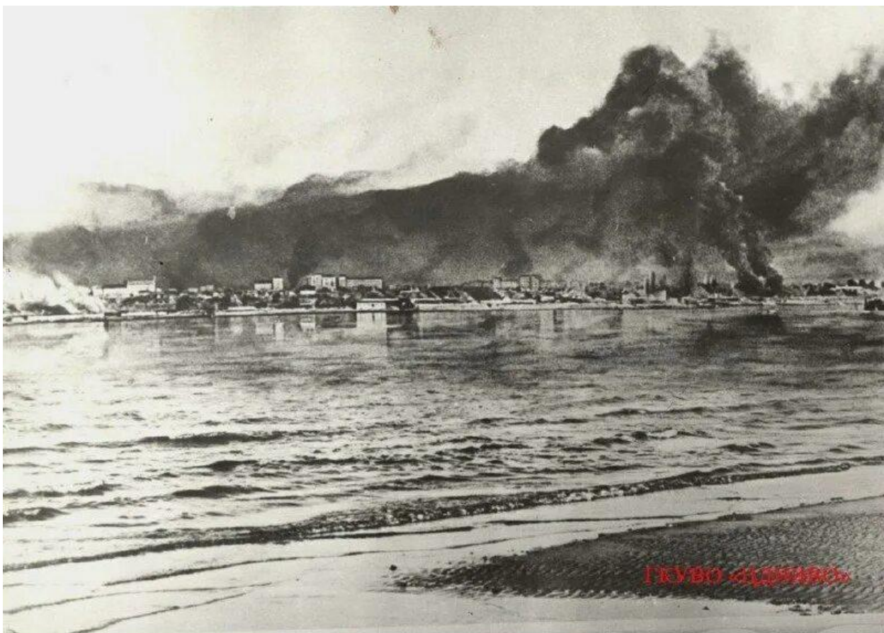
Сталинград в огне, август 1942 г.