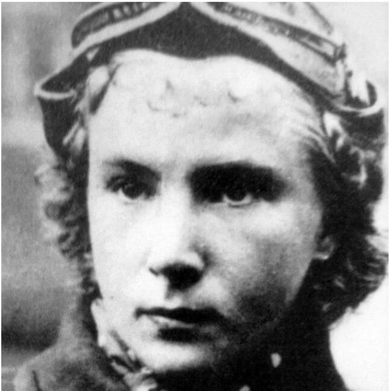
Лидия (Ли́лия) Литвяк