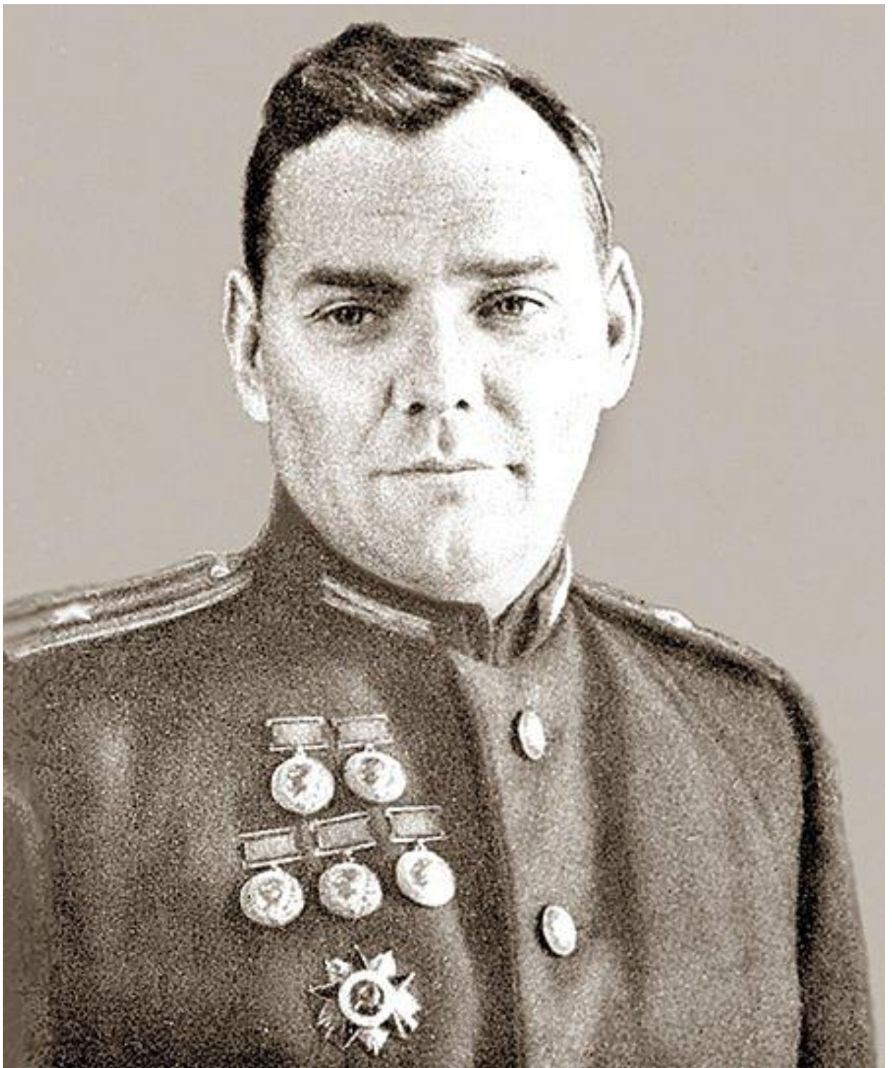
Евгений Викторович Вучетич