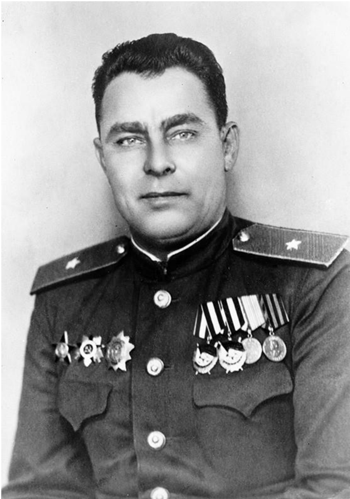
Леонид Ильич Брежнев