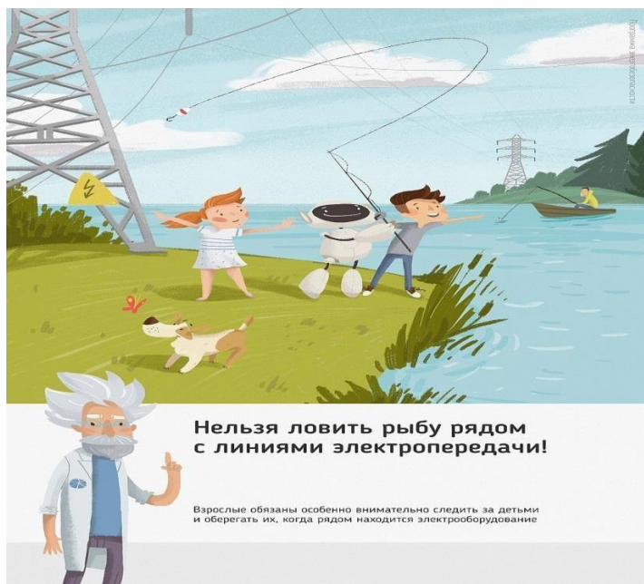
Рис. 4 Нельзя ловить рыбу рядом с линиями электропередачи

Об открытых подстанциях, оборванных проводах нужно сообщить в Кубанское ПМЭС по телефону 8-861-219-40-20 или позвонить на единый телефон всех экстренных служб 112.