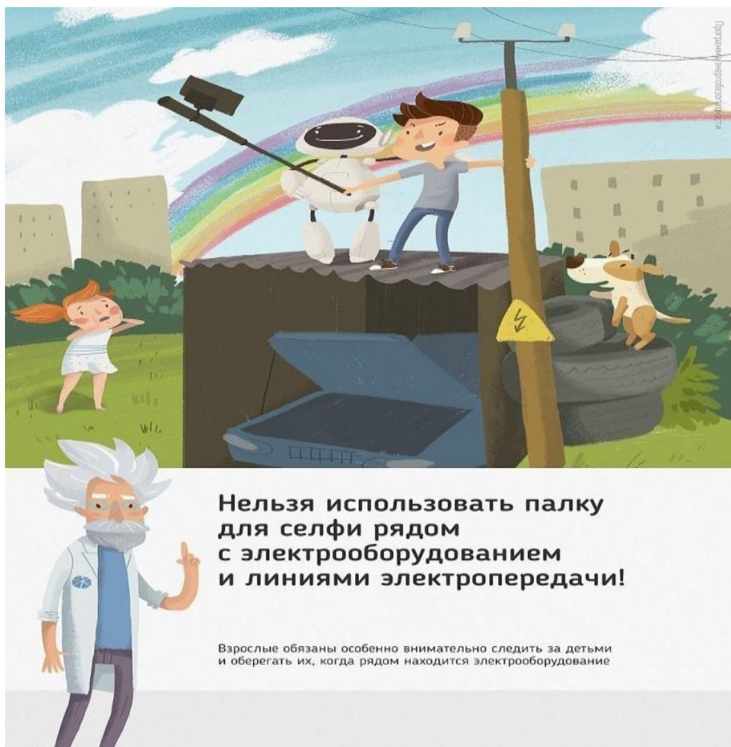
Рис2. Нельзя использовать палку для селфи рядом с электрооборудованием и линиями электропередачи

Ну и, наконец, нужно повторить с ребенком алгоритм действий в экстремальной ситуации. Проверьте, умеет ли он набирать на сотовом телефоне телефон экстренных служб. Изучите с ним вещества и предметы, которые хорошо проводят электрический ток и потому особенно опасны, и, наоборот, вещества и предметы, плохо проводящие электрический ток и полезные в экстремальной ситуации.