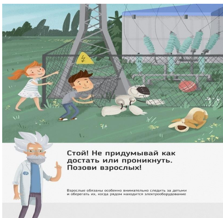
Рис. 5 Стой! Не придумывай как достать или проникнуть. Позови взрослых!