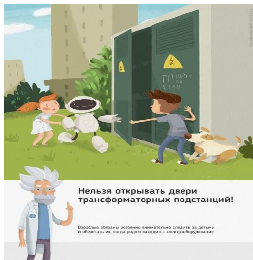
Рис.1 Нельзя открывать двери трансформаторных подстанций

Ежегодно энергетики проводят для школьников познавательные уроки, конкурсы рисунков и историй на тему электричества и правильного с ним обращения. Но работы одних энергетиков в данном направлении недостаточно, для полного понимания проблем электробезопасности нужен пример общества, в котором растет ребенок, и, конечно же, главным образом родителей. Эта работа приносит свои результаты: электротравмы на энергетических объектах единичные, и каждый случай становится поводом для служебной проверки. Но только технических мер мало для того, чтобы полностью обезопасить детей. Им нужен пример родителей.