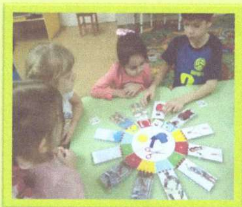
«Играй, о Кубани узнай»

Цель: формирование представлений об основных видах народно-прикладного творчества, обрядовых праздниках Кубанского казачества, закрепление знаний о символике, флоре и фауне края