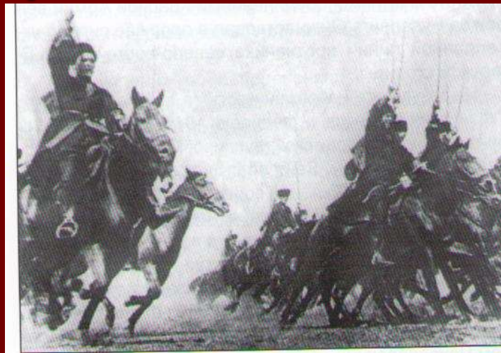
Кавалерия Кубанских казаков