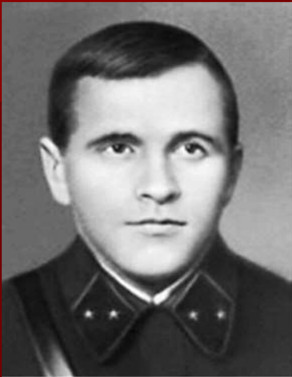
Командир кавалерийской группы Л.М. Доватор