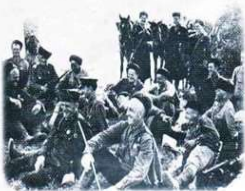
Бойцы 4-го Кубанского гвардейского кавалерийского корпуса на привале. 1942 г.