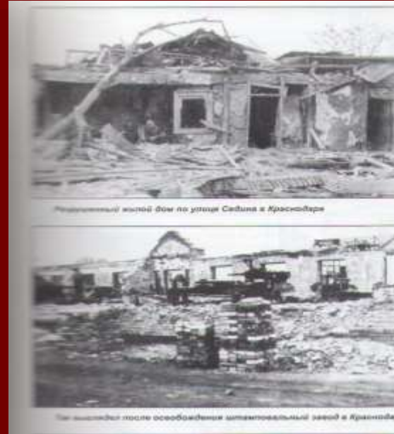
Разрушенный жилой дом по улице Сидина в Краснодаре