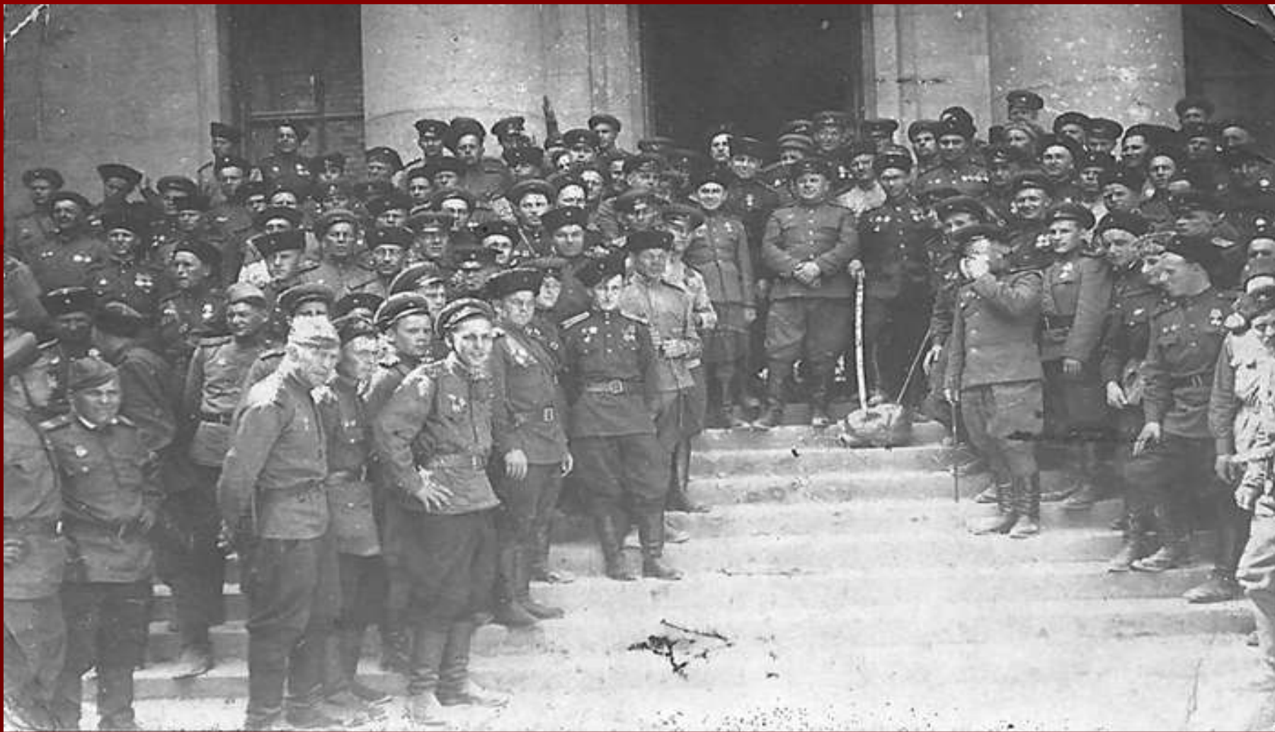
■ Казачи в Берлине. 1945 г.