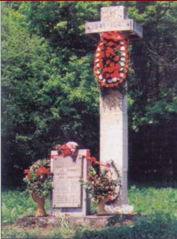
Мостовский район. Памятник на месте бывшего поселка Михизеева Поляна, 207 жителей которого были расстреляны 13 ноября 1942 года немецко-фашистскими оккупантами