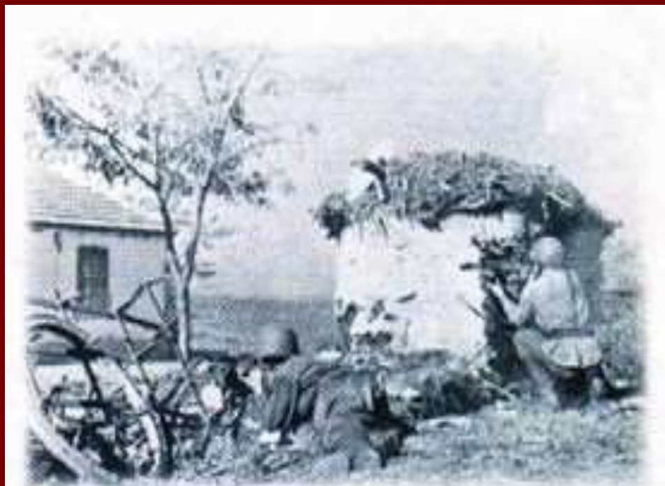
Атака. Кубань, 1943 г.