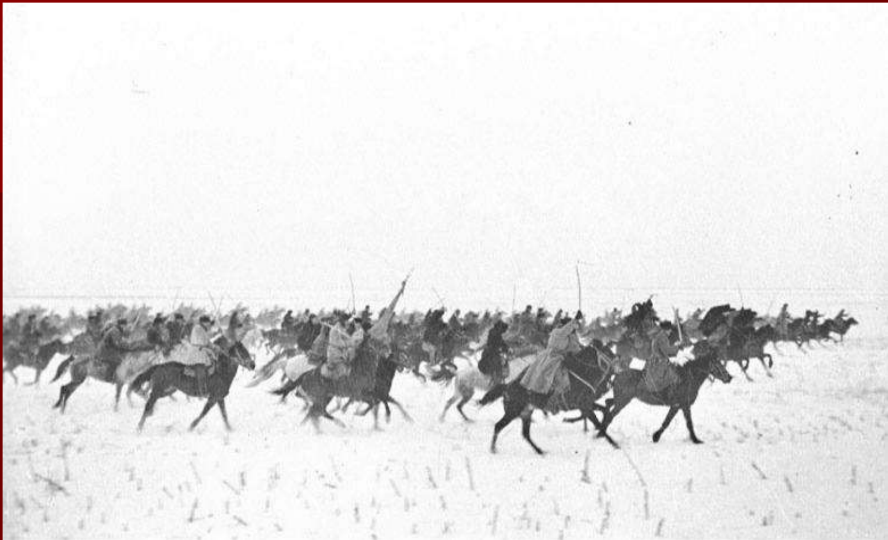
Рейд конницы Доватора по тылам противника