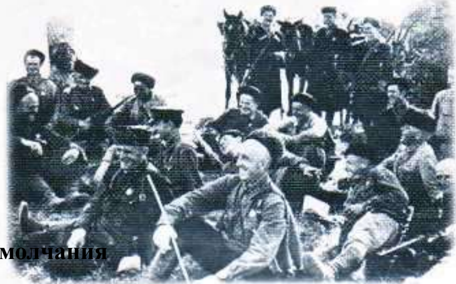
Бойцы 4-го Кубанского гвардейского кавалерийского корпуса на привале. 1942 г.